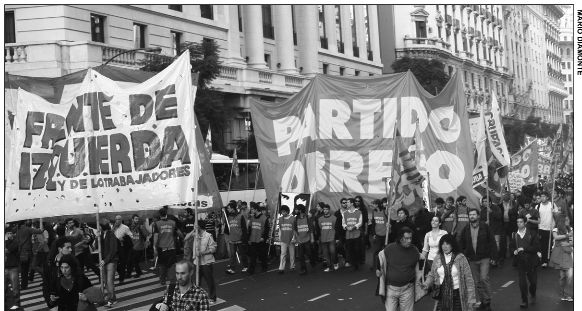
El FIT en la jornada del 27 de junio.

Luego resume: "En Argentina hay una crisis de fondo, y el