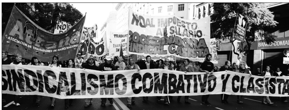
Coordinadora Sindical Clasista. La reunificación del movimiento obrero se hará únicamente sobre nuevas bases de democracia sindical, de independencia política de la clase obrera, de la lucha por una nueva dirección clasista.

Claramente, la crisis de la burocracia sindical es una expresión de la disgregación del régimen político K, acosado por la bancarrota capitalista mundial y por el "modelo" nacional. La disgregación del régimen y de la burocracia forman un paquete; por eso la salida será política, no sindical en sí misma. Con Moyano, el kirchnerismo tuvo una CGT que se esforzó por garantizar la "paz social". Hoy estamos ante una definida tendencia huelguística contra las primeras manifestaciones del ajuste en marcha: docentes, dragones, camioneros, metalúrgicos, alimentación, etcétera.