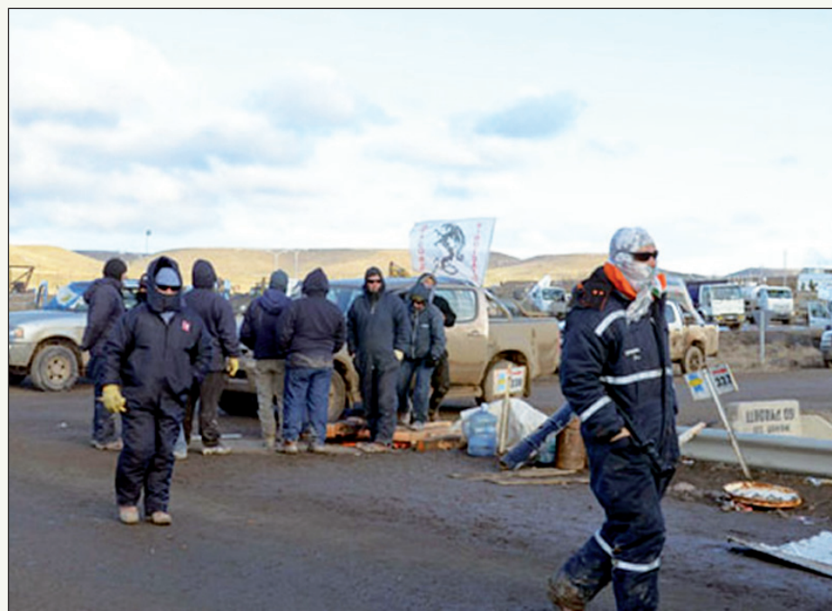
Trabajadores de Cerro Dragón. Otra lucha contra la tercerización.

Los trabajadores de la construcción de Cerro Dragón están protagonizando una lucha que es distorsionada por la gran prensa.