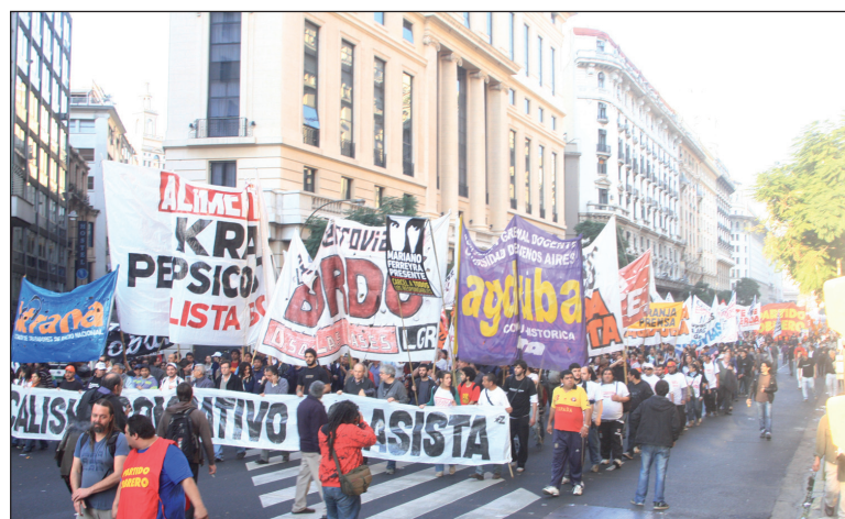
Columna del sindicalismo combativo y clasista. El porvenir de los reclamos requiere una orientación sindical y política independiente para la clase obrera y para los trabajadores.

Moyano tuvo a sus pies al gobierno, desesperado porque las