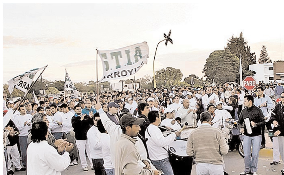
Trabajadores de Arcor Córdoba.

El jueves 21, tras los paros que siguieron a la conciliación obligatoria, fábricas como Stani-Cadbury o Kraft rechazaron el pre-