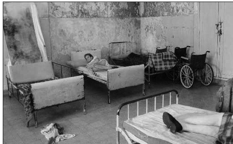
Hospital Borda. La burocracia sindical pretende entregarle a Macri un cheque en blanco para que avance en sus planes de vaciamiento y cierre.

Cabe mencionar que, según algunos medios, algunas fuerzas opositoras al gobierno de Macri en la Ciudad, como el kirchnerismo, habrían dado su visto bueno al proyecto del centro cívico, condicionado a que un porcentaje de los fondos obtenidos por la futura venta del edificio del Plata sea destinado a "obras hospitalarias", lo que constituye un antecedente de características bochornosas: el financiamiento de la infraestructura hospitalaria