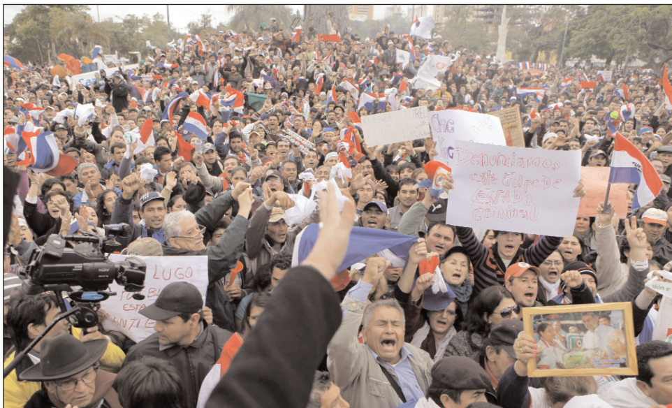
Marcha antigolpista en Asunción. La movilización política independiente contra el golpe debería ir acompañada del planteo en favor de una asamblea constituyente contra el Estado "colorado", una tarea del pueblo de toda Latinoamérica.

Las concesiones a la derecha realizadas por Fernando Lugo -en especial luego de la masacre de campesinos- no sirvieron para evitar el golpe. Lugo asumió con la promesa de la reforma agraria y con la crítica a la apropiación de tierras públicas por parte de la oligarquía paraguaya. Sin embargo, cuando las ocupaciones de tierras de las organizaciones campesinas fueron denunciadas a la Justicia y esta convalidó los títulos de los terratenientes paraguayos y brasileños, Lugo se jugó a desalojarlas. El hambre de la soja, que vive un boom exportador en Paraguay, no permite concesiones en materia de tierras. El desalojo violento de las tierras de Blas Riquelme -terrateniente del Partido Colorado-, en el que murieron once campesinos y seis policías tiene el antecedente de los desalojos "pacíficos" de Nanducay, en los primeros meses del año. La denuncia del gobierno, de que los colorados -el partido de la oligarquía terrateniente- se encontraban atrincherados en la Justicia y en el parlamento, sirvió para... una capitulación frente a la Justicia y al parlamento.