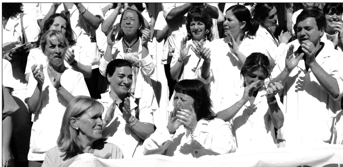
Trabajadores del Sardá. Frente a la mafia y la corruptela, constituir una comisión de control por la defensa del hospital y por una salida propia.

dado en paritarias- su salario de bolsillo (técnico tramo A) va a ser en julio de 4.200 pesos, por 20 módulos cobra 1.700 pesos; es decir, más del 40% de su futuro sueldo.