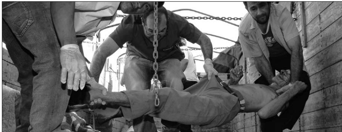
Campesinos trasladan compañero asesinado por la policía. Lugo avanza hacia un verdadero co-gobierno con los oligarcas.

La principal propuesta de campaña de Lugo había sido llevar adelante una reforma agraria. El oficialista Frente Guasu -que incluye al Partido Comunista de Paraguay- denunciaba la usurpación de tierras desde la guerra de la Triple Alianza. El gobierno denuncia ahora el boicot de la Justicia -que convalida los títulos de propiedad de las llamadas "tierras mal habidas"- y del parlamento -con mayoría colorada. El gobierno no ha expropiado una sola hectárea de tierra, mientras los otorgamientos a los campesinos se realizaron a cuentagotas.