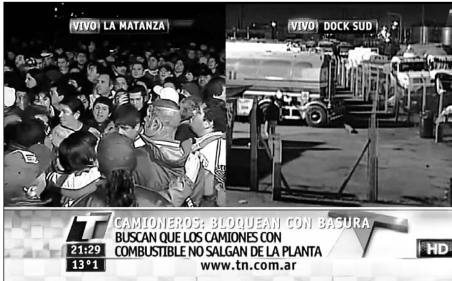
Piquete de camioneros frente a la Gendarmería. Los límites del moyanismo para dar una respuesta a esta escalada son insuperables, el porvenir de los reclamos exige una orientación política y sindical independiente.

Moyano, por su parte, se manifestó dispuesto a bajar la pretensión de aumento del 30 por ciento si el gobierno sube el mínimo no imponible. Pero no dijo de cuánto tiene que ser esa suba, lo que deja la puerta abierta a un acuerdo en torno de un aumento efectivo inferior. Según los mentideros oficiales, CFK piensa elevar el mínimo después del congreso de la CGT. Pero no en más de un 20 por ciento, en línea con los aumentos homologados en las paritarias. Esa variante deja la exacción impositiva al salario en el mismo nivel que existía antes de las paritarias, en el mejor de los casos.