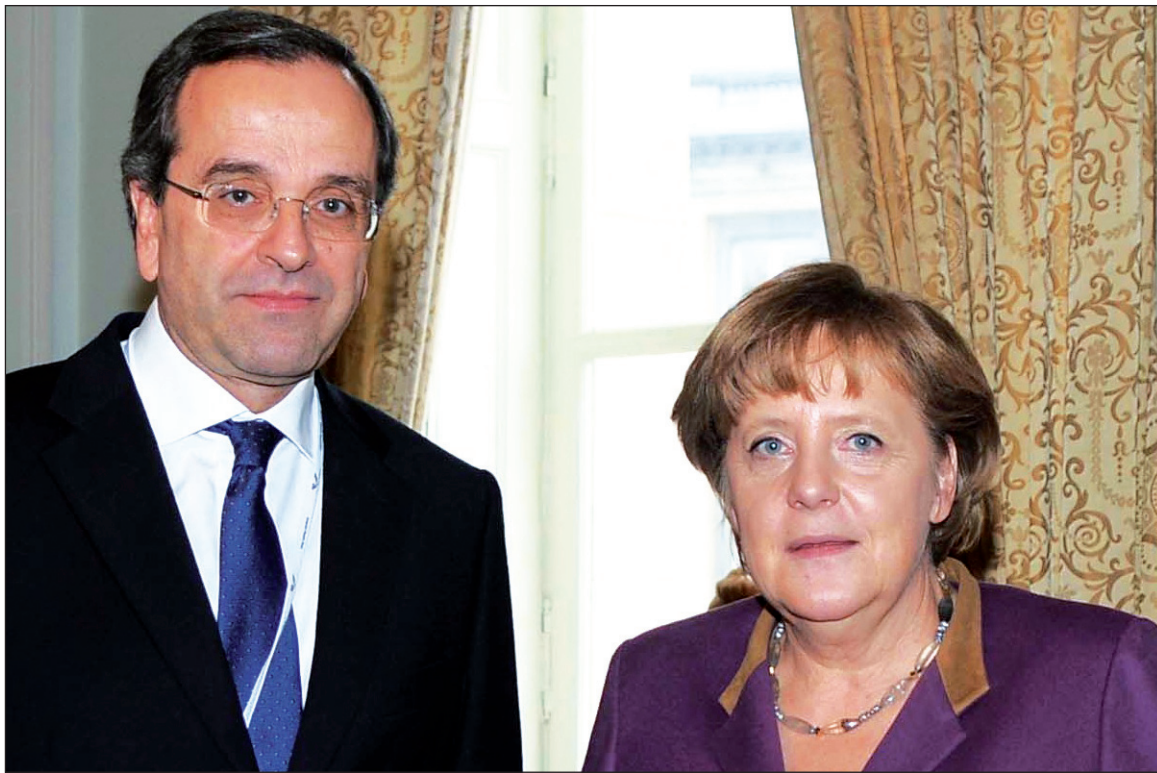
Georgios Samaras, de Nueva Democracia, con Angela Merkel. Se conformó un gobierno burgués muy débil y heterogéneo, en medio de una bancarrota capitalista generalizada y enfrentado a una fuerte oposición oficial de izquierda y, sobre todo, a un pueblo devastado, hostil a la implementación del Memorandum.

La falta de dicha perspectiva fue utilizada por la clase gobernante en su campaña de intimidación no solamente contra el KKE y Antarsya, sino también contra el mismo Syriza. Tsipras y Syriza pidieron un compromiso imposible: el rechazo del Memorandum sin una ruptura con la UE y el euro y sin romper el marco del sistema capitalista. Las burguesías griega y europea, así como sus políticos presentaron una posible victoria electoral de Syriza y la formación de un gobierno de la izquierda en Atenas como el preludio de la famosa "Grexit": la expulsión automática de la UE y la salida del euro. A pesar de todas las protestas de Tsipras y Syriza, que afirmaban lo opuesto -su lealtad a la UE y al euro,