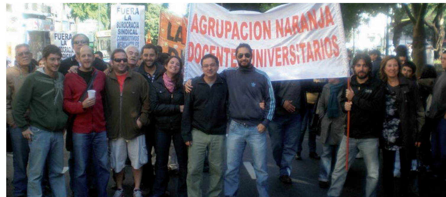
La Agrupación Naranja de la UBA, en la movilización del 1° de Mayo. La masiva elección reflejó el crecimiento de AGD, un sindicato defensor de la educación pública, aliado al movimiento estudiantil organizado en la Fuba, independiente del gobierno kirchnerista y de las gestiones universitarias y enrolado en las filas del sindicalismo antiburocrático y clasista.

El agrupamiento "Docentes por el cambio" (que buscó aglutinar a los K, al michelismo y al yaskismo, todo junto y en el mismo programa "a la carta") probó todas las maniobras: a la campaña más macartista a la que hayamos asistido -levantaban la consigna "saquemos al PO"- le sumaron una presentación en el Ministerio de Trabajo, que nos fuera notificada a cuatro días de iniciado el proceso electoral y cuando ya habían votado -sin la más mínima impugnación- cerca de 2.000 docentes. Curiosos: quienes denunciaban que pretendíamos hacer votar a los que no eran docentes (o estaban muertos) se empearon, por un lado, en observar los votos de jubilados y cesanteados; por el otro, en hacer votar a estudiantes de económicas, bajo el pretexto de que eran investigadores y no figuraban ni en el padrón de afiliados ni en el padrón de la facultad. Un escándalo. No menos que el hecho manifiestamente público de la intervención del viceministro de Economía, Axel Kicillof, y de funcionarios del Estado que bajaban de los automóviles oficiales para ir a votar "por el cambio" en esa facultad. En el Gran Buenos Aires, incluso, fiscalizaron para la lista de Docentes por el Cambio militantes de la Juventud Sindical de Fucundo Moyano, enrolados en el sindicato de canillitas.