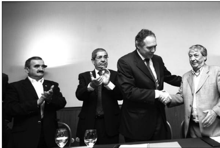
La dirigencia de la CUT, con la cúpula empresarial. Quieren descargar la crisis económica sobre los trabajadores.

Esta medida fue tomada por el gobierno a partir de una declaración de voluntades de la CUT (Central Unitaria de Trabajadores) y de la Confederación de Producción y Comercio, con el fin de "proteger el empleo". Un acuerdo escandaloso entre la burocracia sindical y los empresarios, para descargar el peso de la crisis económica sobre los trabajadores. Con una caída sostenida en el precio de la cotización del cobre, el gobierno -que cuenta sólo con