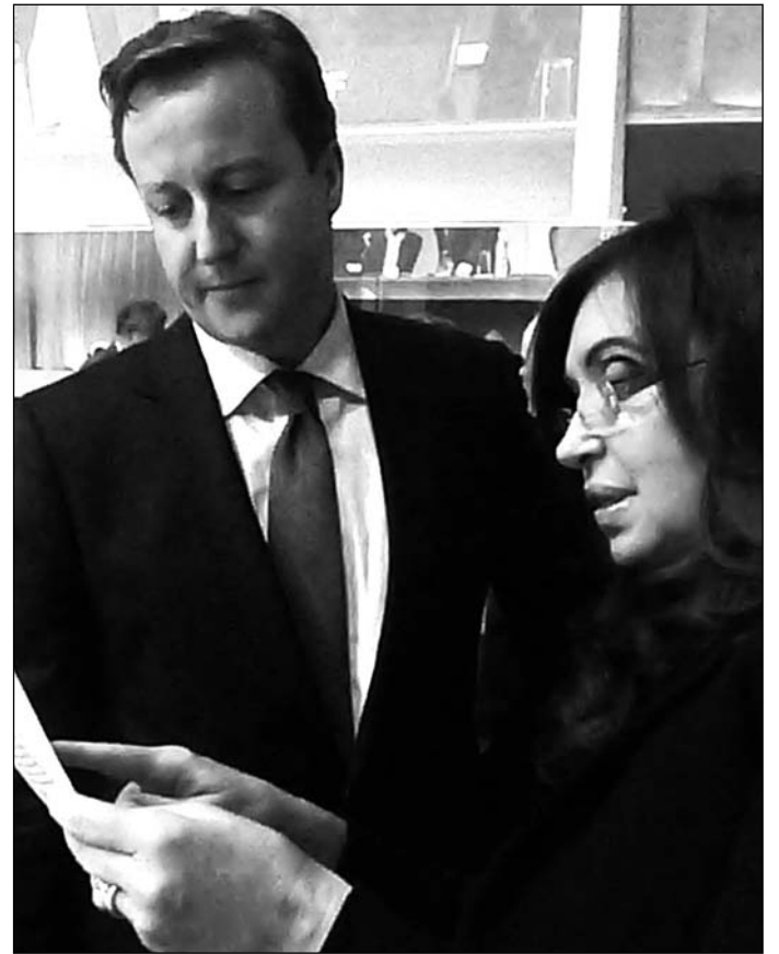
La Presidenta con el jefe de gobierno británico, David Cameron.