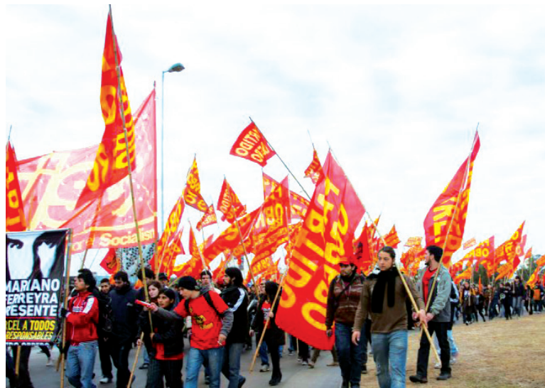
Delegación de la UJS-PO en Córdoba.

Desde hace casi treinta años la Franja Morada dirige la que debería ser la principal federación del país, a espaldas del movimiento estudiantil. El Congreso anual se limita a una ceremonia vacía de contenido, que no resuelve absolutamente nada: ni programa, ni orientación, ni plan de lucha. Los delegados se distribuyen de manera completamente irregular, al punto que se conoció a las 6 de la mañana del sábado 15! Eso ocurrió en el Congreso de la FUA, que se reunió en Córdoba el pasado fin de semana. Todo lo contrario sucede con la Fuba, cuyos delegados surgen de elecciones intachables y no son cuestionados por nadie, ni siquiera por aquellos que la quieren romper.