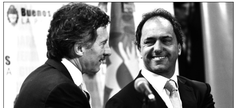
Macri y Scioli. Asistimos al final de la tentativa de salvar el esquema de las privatizaciones menemistas a costa de subsidios millonarios.

La mesa tripartita es un intento por reducir subsidios con el auxilio de Macri y de Scioli; el último, antes de que la situación se des-