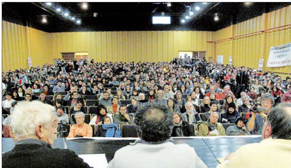
"Clase magistral" de los cesanteados por el rectorado de la UBA. La AGD-UBA se va prefigurando como un sindicato de punta del clasismo; construido con delegados de facultad, soberanía de las asambleas y la más rigurosa práctica de la democracia sindical.