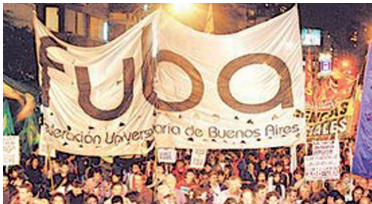
Una lucha política para quebrar el intento de vaciamiento de la principal organización del movimiento estudiantil de la UBA -y posiblemente del país.

Para los socialistas se trata de un problema decisivo: ¿integrarnos para aceptar los dictados del pago de la deuda y los subsidios a los Cirigliano? Queda claro que