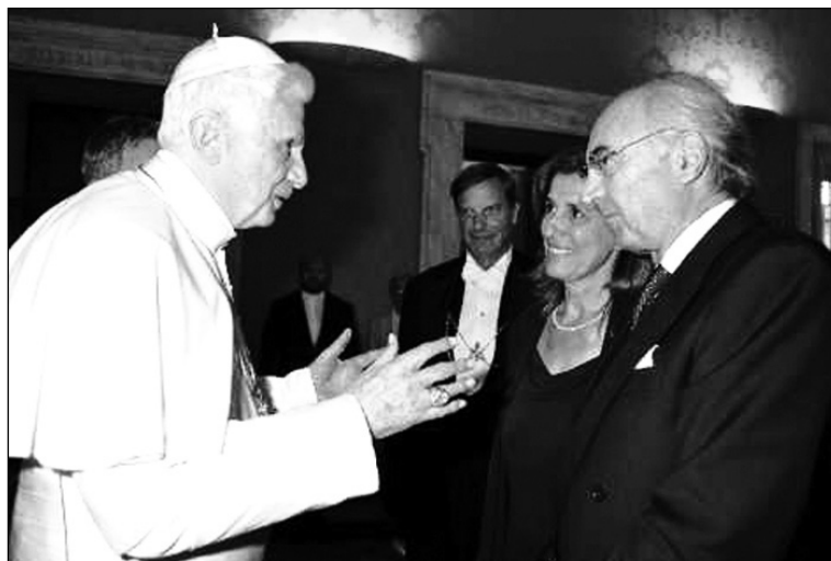
El papa Benedicto y Gotti Tedeschi. Empieza a derrumbarse el Vaticano, una potencia económica, financiera, industrial y mafiosa, además de armadura ideológica de toda explotación.

También recordará Gotti Tedeschi a Roberto Calvi, dueño del Banco Ambrosiano, que en socie-