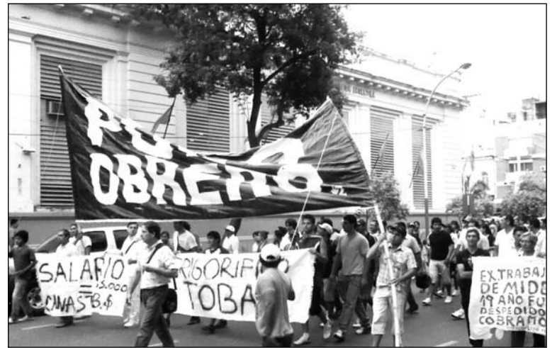
Trabajadores del gremio de la carne, protagonistas del clasismo chaqueño.

El plenario votó el apoyo a la tenaz lucha del sector de médicos y de los activistas de la UTA, que sufren permanentes persecuciones. También se caracterizó que la CGT local no existe y que la CTA