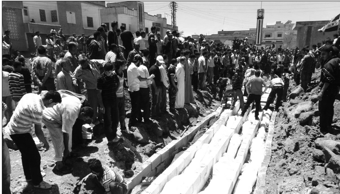
Funeral de civiles asesinados por el régimen. Multipliquemos acciones contra las masacres de El Assad y la intervención imperialista.

El análisis de lo que ocurre en Siria toma como paradigma lo ocurrido en Libia, donde el desenlace de un levantamiento popular contra una dictadura que había llegado a importantes arreglos con