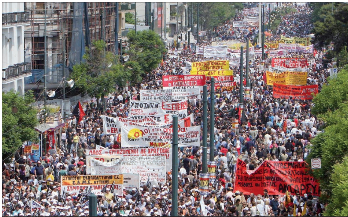
Movilización contra el ajuste en Grecia. La bancarrota capitalista mundial tiene alcances históricos; se trata, entonces, de proceder a una reorganización social planetaria que debe tener por eje político y social al proletariado.

por completo normal que los titulares de los medios se salgan de los goznes. Hay que advertir, de todos modos, algo que es esencial en la caracterización de la bancarrota actual: a partir de los activos y pasivos de los bancos se ha construido otro edificio financiero, más inmenso, que consiste en contratos de seguros sobre esos activos y pasivos, al igual que otras inversiones compensatorias (conocidas como "derivados"). De modo que reducir la crisis al 'defol' de los activos visibles (subyacentes), le priva a ella de perspectiva adecuada (catastrófica).