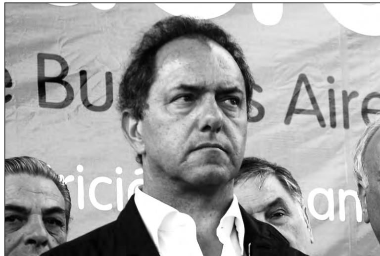
Daniel Scioli. Se aprobó un revalúo impositivo de tierras intrascendente, pero la reciente crisis político-fiscal es sólo el comienzo.

La 'batalla' del revalúo puso de manifiesto el carácter recontrar capitalista de La Cámpora y del binnerismo, que frente a un retraso del 98% de la valuación rural (equivalente a un aumento