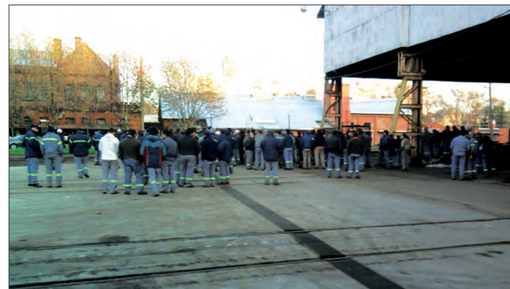
Asamblea en los talleres. En Escalada se ha recompuesto el activismo luego de años de dictadura de Pedraza y del 'Gallego' Fernández.

¡Viva la lucha de los trabajadores del Inti!