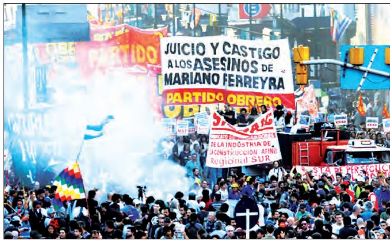
Obstaculizan el inicio del juicio a la patota. Se encuentra en marcha un operativo oficial para aislar el juicio a Pedraza y despojarlo de sus connotaciones políticas.

Los problemas no se agotan aquí. Hasta ahora, el TOC 21 no ha permitido el acceso de las querrelas a las escuchas telefónicas y a las computadoras personales de