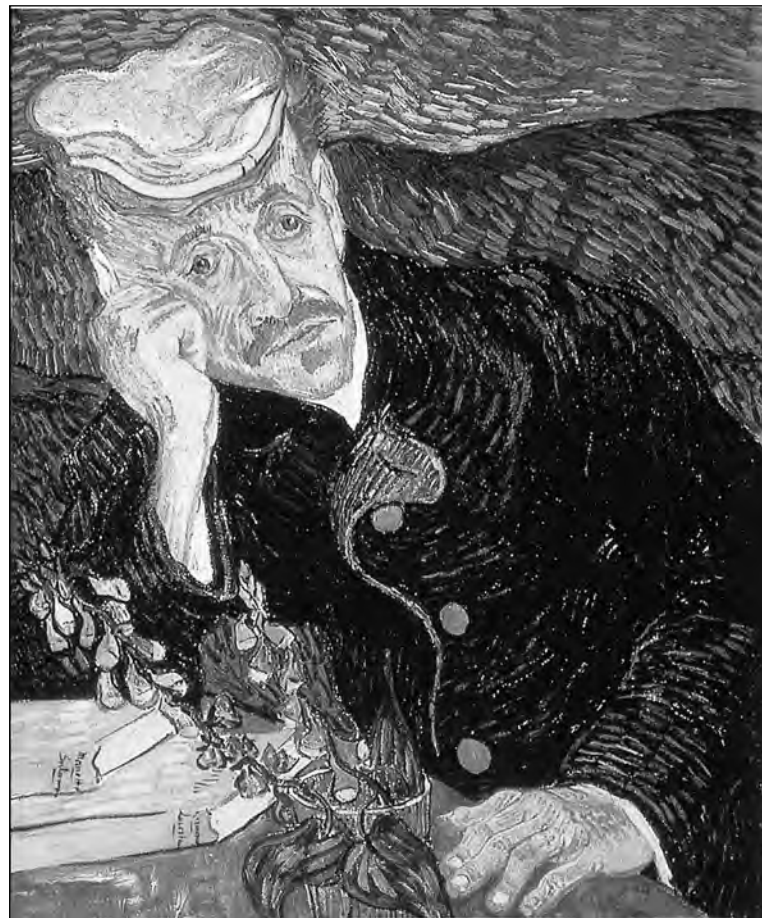
"Retrato del doctor Gachet", de Van Gogh, 82,5 millones de dólares.

Así, el arte se ha ido convirtiendo en un negocio millonario, una forma de inversión similar a las acciones, los inmuebles, el oro, o la soja, por estos lados. Y un lienzo como "El Grito" es un valor seguro, que sólo puede aumentar de precio con el tiempo. Como para tener un ejemplo de cómo funciona el mercado: el coleccionista Charles Saatchi compró en 1991 por 50.000 libras un tiburón en formol de Damien Hirst: 13 años después lo vendió por 6,5 millones de libras.