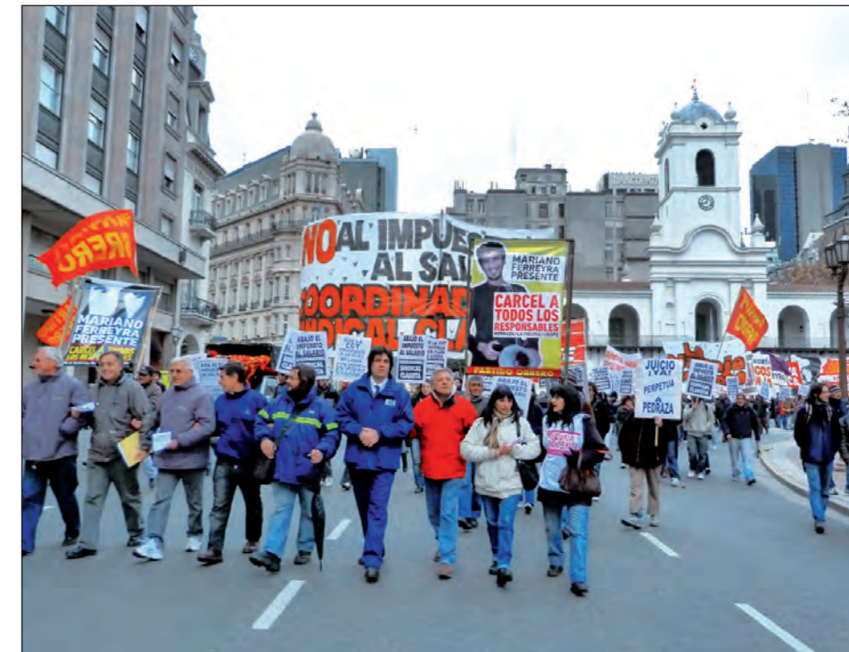
Movilización de la Coordinadora Sindical Clasista, contra el impuesto al salario.

La circunstancia de que Moyano o Barrionuevo empiecen a hablar de una marcha por determinadas reivindicaciones, es el lejano reflejo de la inquietud creciente entre los trabajadores y de las profundas razones para una huelga general a la que la burocracia sindical le escapa como a la peste.