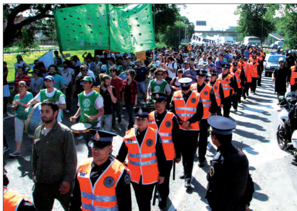
Movilización durante la huelga. Esta enorme lucha ha dejado a la vista de todos que si los trabajadores irrumpen pueden defender sus conquistas y obtener otras nuevas.

La experiencia que han recorrido los trabajadores en estos meses de lucha ha sido muy importante. Por cada ataque patronal, las asambleas se multiplicaban en número y contenido. Hemos pasado casi por todos los estadios y medidas, paro por tiempo indeter-