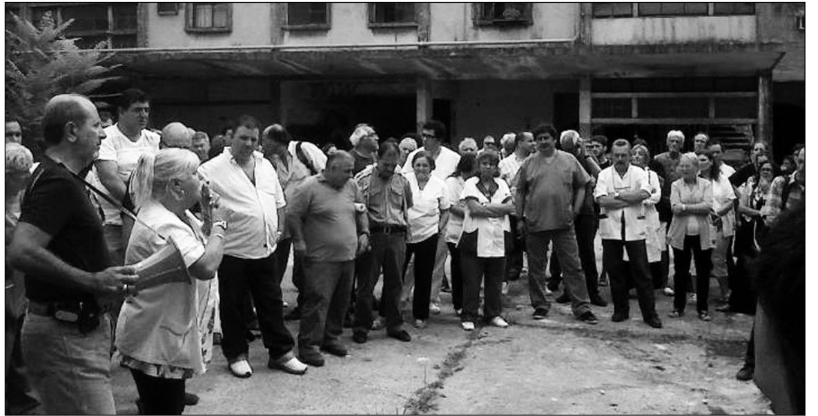
Asamblea de trabajadores del Hospital Borda. Macri y los K, comprometidos con el ajuste.

Las direcciones sindicales kirchneristas se han sumado al oficialismo nacional -o sea al ajuste nacional y popular que quieren