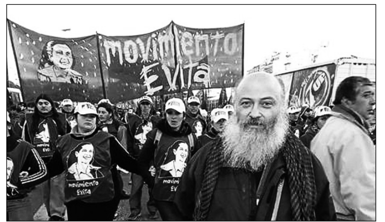
Movimiento Evita, empleador en negro.

Los trabajadores denuncian que sus tareas ya no las realizan en el obrador de Piletones, sino en municipios del Gran Buenos Aires, en obras para Aysa -lo que también es cómplice de lo que ocurre. La construcción del complejo de viviendas en el barrio se ha paralizado, a pesar de que las necesidades habitacionales son explosivas. Unas cincuenta casas ya habían sido adjudicadas a familias que