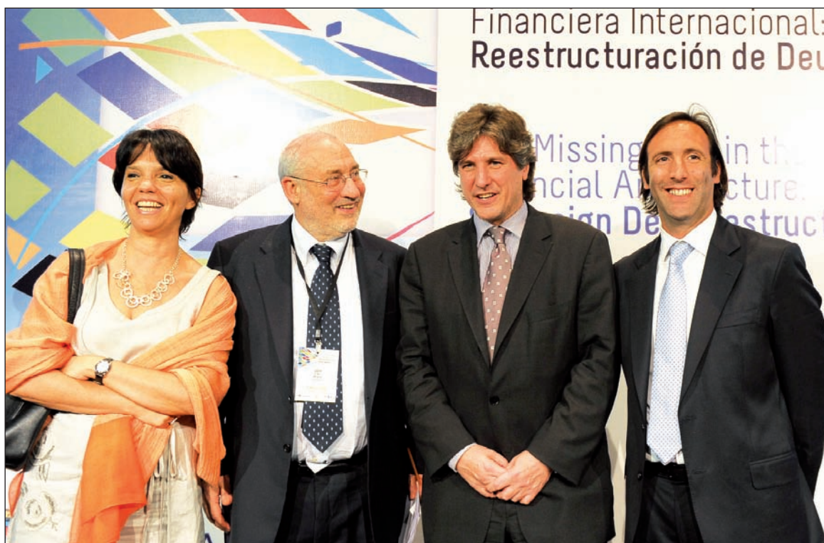
Del Pont, Boudou y Lorenzino sonríen junto a Joseph Stiglitz. Pero Argentina enfrenta la amenaza de una cesación de pagos.

El cupón PBI, un certificado que da derecho a cobrar una renta determinada, concentra una parte elevada del movimiento bursátil. El volumen operado en la Bolsa de Buenos Aires por este instrumento, en 2011, fue de más de 23.000 millones de pesos, mien-