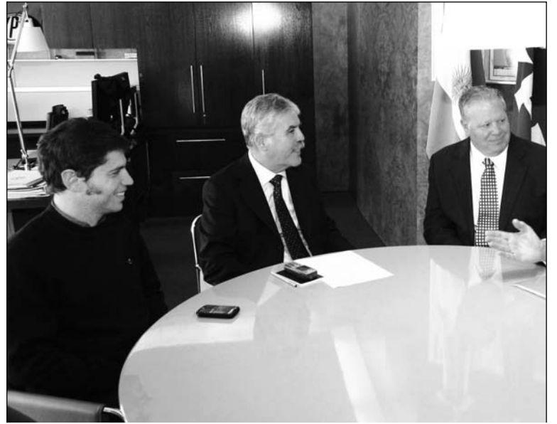
Reprivatización. Kiciloff y De Vido, con directivos de Exxon.