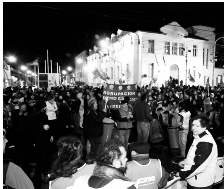
Movilización y cacerolazo en Calafate contra el atraso salarial. Santa Cruz anticipa la crisis nacional.