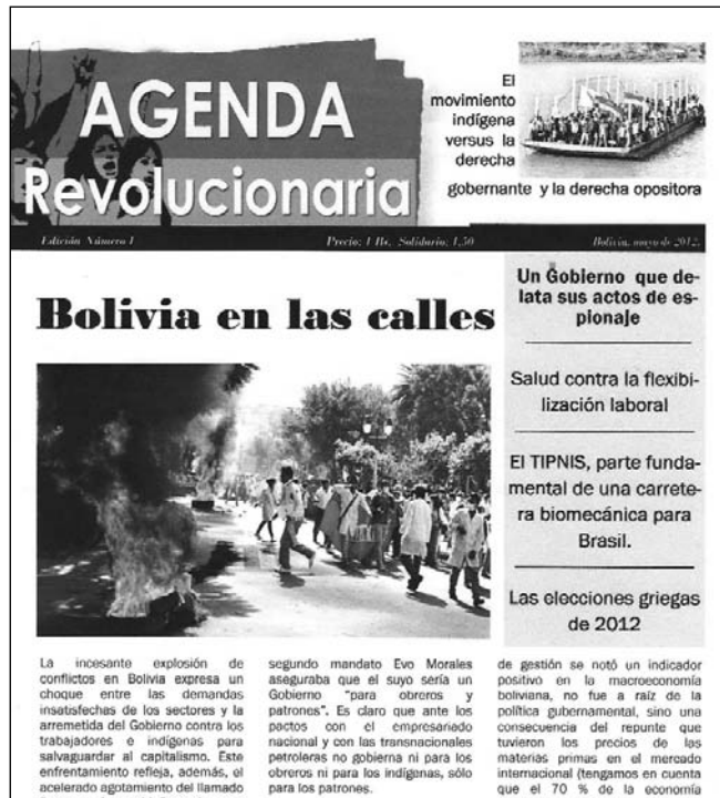
Facsimil del primer número de Agenda Revolucionaria , Bolivia, mayo de 2012. En el cuerpo del artículo publicamos extractos de su editorial.

El gobierno promueve la división y paralelismo en las direcciones de las organizaciones indígenas y de trabajadores.