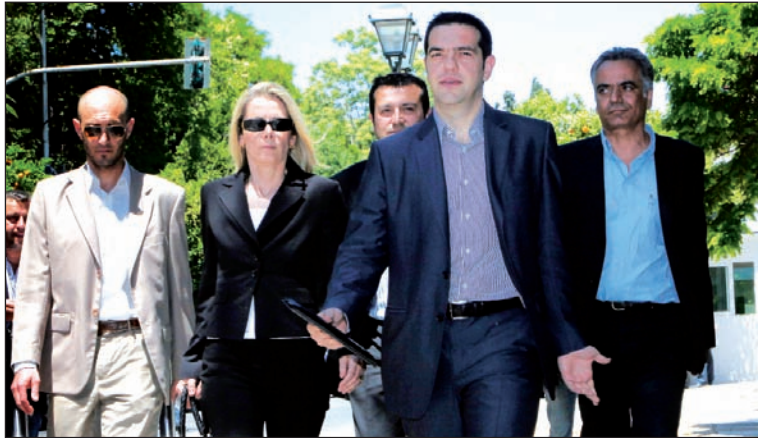
Syriza. Rechaza el memorándum del ajuste, pero defiende la permanencia griega en la Unión Europea.

¿Chau Grecia, entonces? No necesariamente, porque la crisis griega es parte de un juego mayor y un pretexto para hacer valer intereses ajenos a Grecia. El cuadro de conjunto demuestra que la inviabilidad no es de Grecia sino de la zona euro, y que la amenaza vale para todo el mundo. La señora Merkel acaba de perder por goleada en el estado más industrial de Alemania, debido a que el electorado rechazó el 'ajuste' en la región más endeudada del país. Francia, por su lado, no tiene espaldas para rescatar a ninguna entidad bancaria del país, si llegara el caso. Lo revela la disputa con