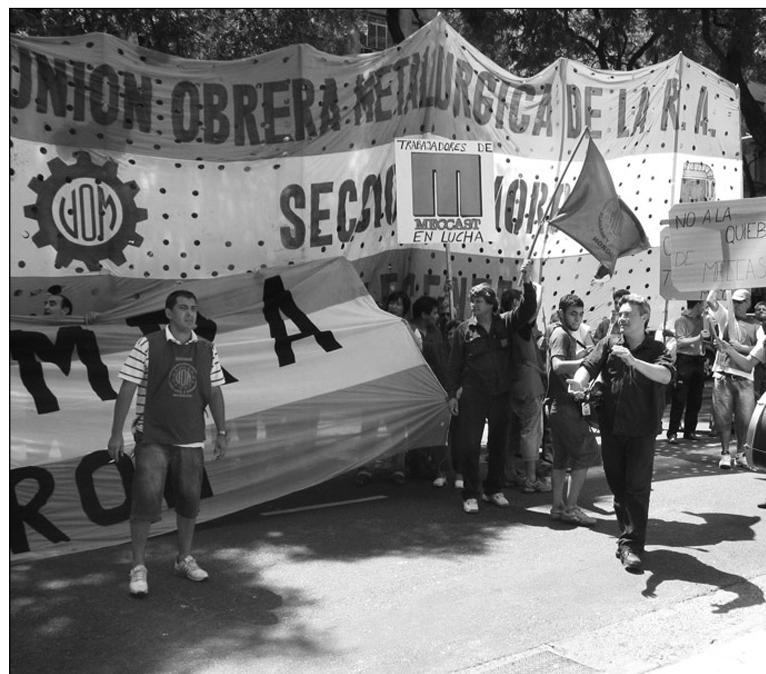
Movilización de los trabajadores de Mecca

Las divisiones entre la directiva son manifiestas. El otro sector ha hecho un llamado a los delegados para no intervenir, para no darle apoyo a los trabajadores ni al entregador y