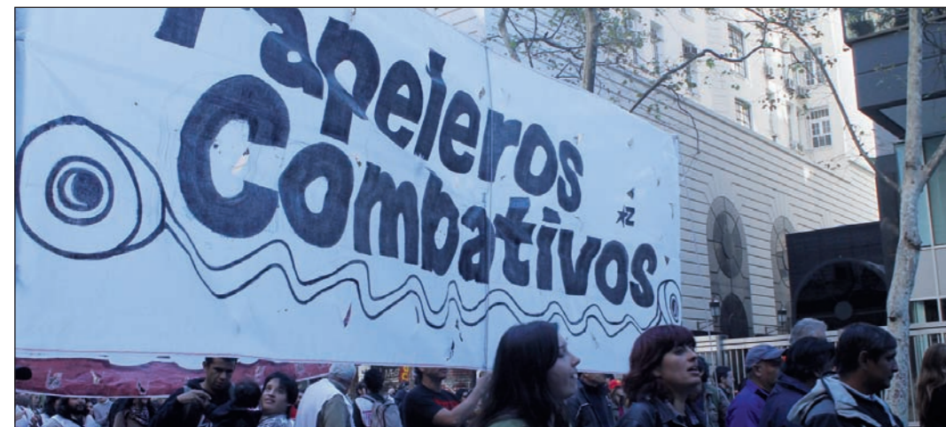
Papeleiros Combativos, en marcha. Para luchar de verdad, la juventud obrera que trabaja en la fábrica tiene que terminar con la gerontocracia que ha hundido el salario y las condiciones de trabajo.

Ha comenzado la discusión paritaria en el gremio papelerero. La industria del papel superó las ganancias de años anteriores y tuvo lugar una importante absorción de empresas. Para este año, sin embargo, las cámaras patronales prevén un 'enfriamiento' y apoyan el tope salarial establecido por los K para las paritarias. Las del año pasado dejaron rezagado el salario y las categorizaciones.