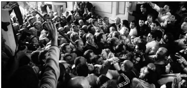
La Cámpora en su gresca con ruralistas. El vacío de programa deja el paso al lumpenismo político e ideológico.

Desde el punto de vista de la circunstancia política concreta, el centenar de afiliados de la Carba vino para reclamar a favor de un privilegio para los terratenientes -defender un impuesto inmobiliario sobre tierras varias veces devaluadas en términos fiscales-, algo que les aseguran las constituciones vigentes. No actuaron en condiciones propicias para un grupo de choque interesado en promover un golpe o un atentado de fuerza contra los derechos democráticos vigentes. En un país donde el gran capital complota con el gobierno que defiende La Cámpora contra el derecho de los trabajadores a ajustar el salario de acuerdo con la inflación, ejercer la prepotencia contra otro sec-