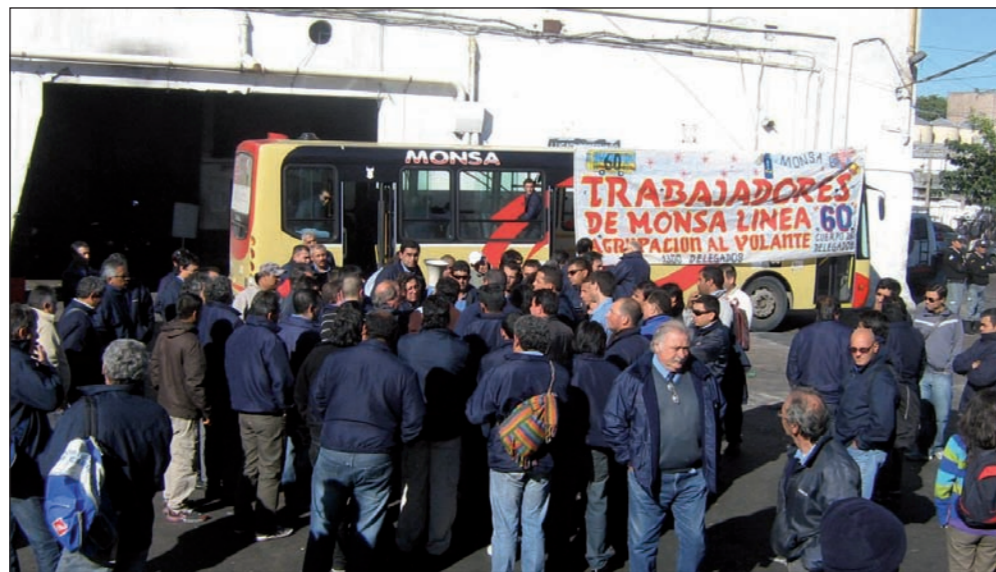
Trabajadores de la línea 60, en abril. Rebelión en las bases del gremio, en el marco de huelgas y piquetes.

El aumento, repudiado por la base en las