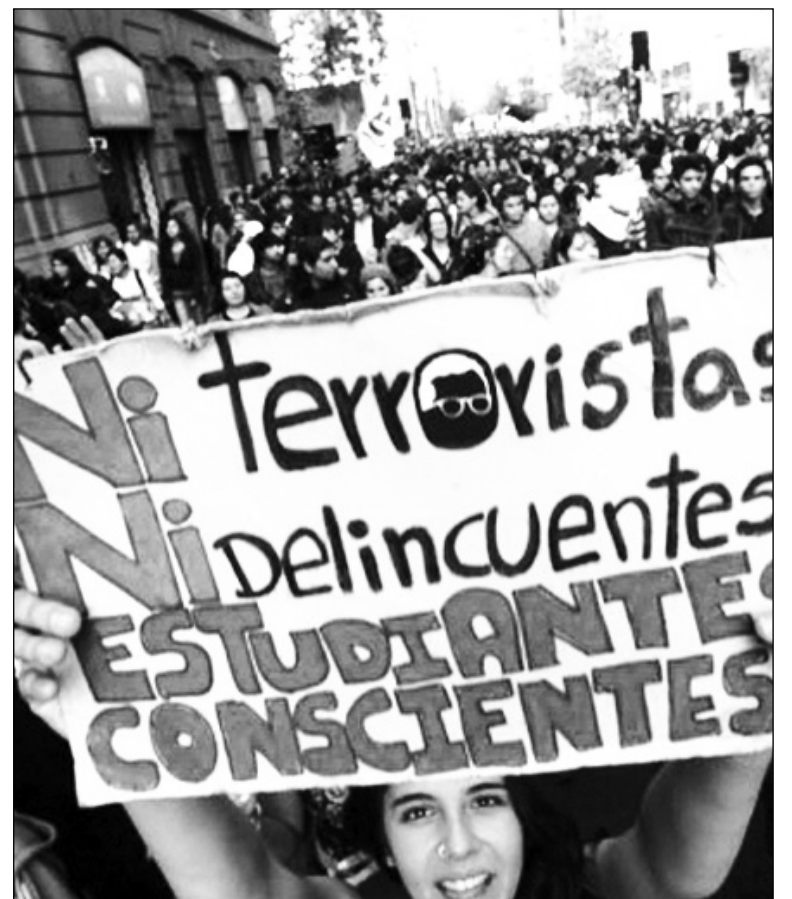
Ochenta mil estudiantes salieron a las calles. El gobierno quiere desarmar la movilización ante la inminencia de las elecciones municipales y las presidenciales de 2013.