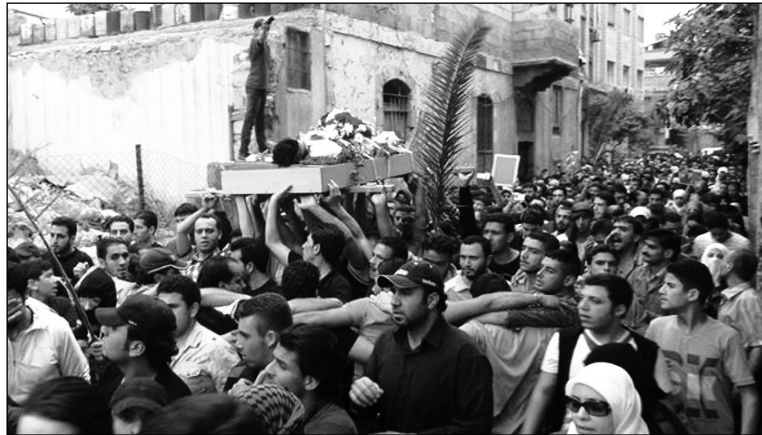
Funeral de asesinados por la represión.

El imperialismo ha fracasado, hasta ahora, en agrupar a la oposición en una sola plataforma favorable a una intervención militar. La tregua le sirvió al imperialismo para que Damasco hiciera el trabajo sucio de golpear severamente a los Comités Locales. El canciller francés, Alain Juppé, ha colocado nuevamente sobre la mesa la opción intervencionista -quizá para darle lustre a la decaída situación interna de Sarkozy, cuando su rival Hollande ya dio su apoyo a la misma.