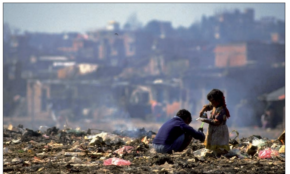
Villa 31 de Retiro. En la Ciudad hay más de 140.000 familias con problemas de vivienda.

Lo curioso es que la urgencia de una "vulnerabilidad extrema" choca con la extensión, costo y dilación del proceso judicial que debe hacer valer ese derecho. El proceso judicial se mofa de la condición de "operativa