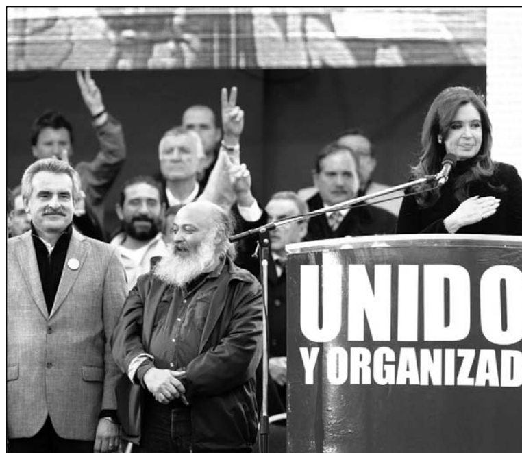
Acto oficialista en Vélez. Al final todo se reduce a la cuestión de la sucesión presidencial.