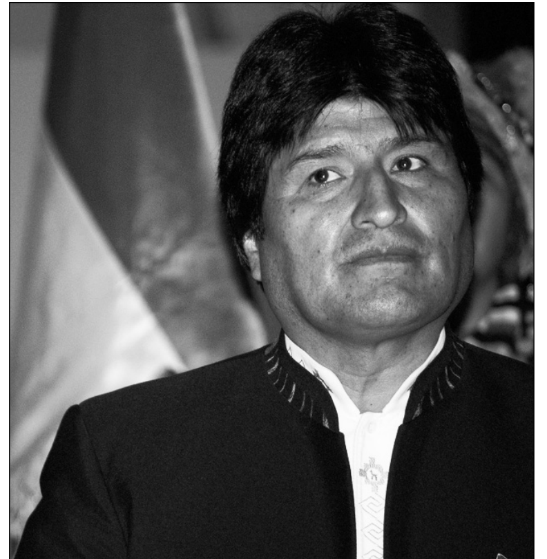
Evo Morales. Las movilizaciones populares no paran de erosionar su popularidad.

En la base del conflicto con los trabajadores se encuentra una crisis fiscal. El intento de saldar esta crisis por medio de la eliminación de los subsidios