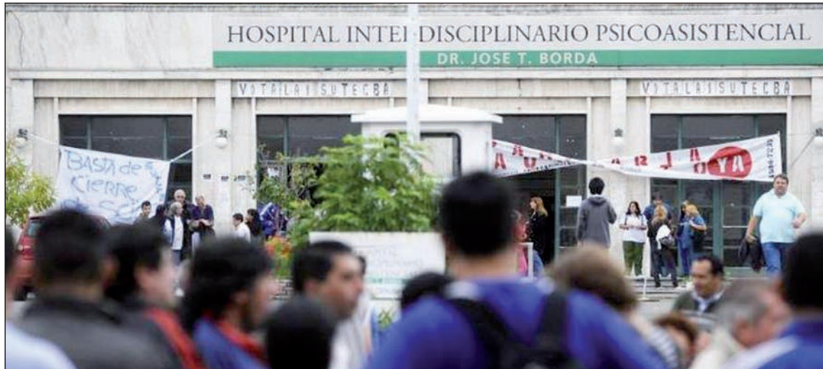
Movilización de los trabajadores del Hospital Borda. En la Ciudad es necesario un plan de lucha independiente de todos los trabajadores.

A la impasse del convenio colectivo de trabajo se suma la del servicio de seguridad, que el macrismo se rehúsa a cubrir. Por otro lado, Roggio acaba de anunciar que se retira del negocio de la basura de la Ciudad, y que no se presentará a una nueva licitación. Se niega a pagar las indemnizaciones acordadas por Macri con Moyano para los recolectores de basura, por los cambios de firmas de fines de la década del '90: serían más de 180 millones de pesos. En la cola para quedarse con el negocio está Covelia, la empresa vinculada con Moyano, que ya tiene negocios con el gobierno de la Ciudad.