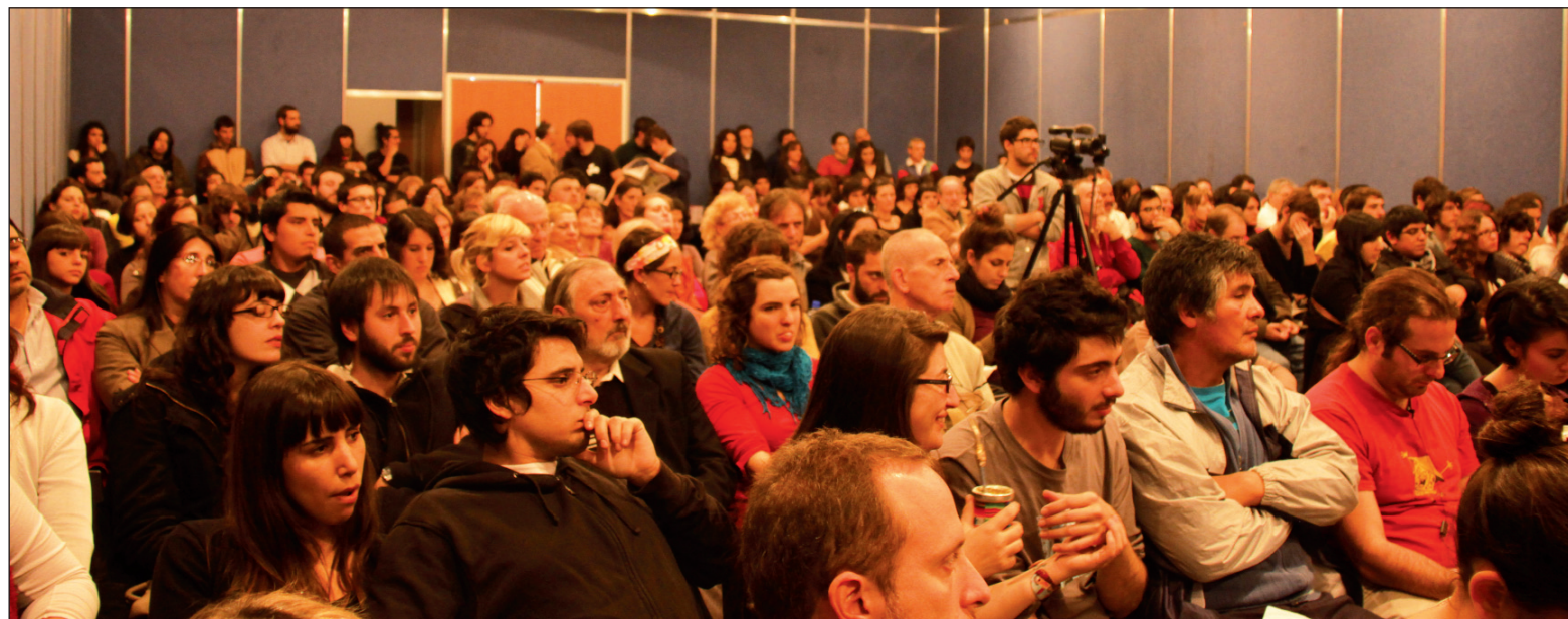
Presentación del libro El ascenso de la izquierda . La actualidad de la izquierda revolucionaria no es solamente una cuestión ideológica -o sea, de vigencia de las ideas socialistas: la crisis capitalista está colocando a las masas trabajadoras del mundo ante la necesidad de encontrar una salida en términos de alternativa política.

Un segundo momento se planteó en 2003, cuando el PJ y la UCR participan divididos en tres listas y la izquierda venía