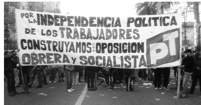
Columna del Partido de los Trabajadores de Uruguay. El PT convocó a la conformación de una columna clasista para reivindicar la independencia política de la central obrera (PIT-CNT) y la unificación por el triunfo de todas las luchas.