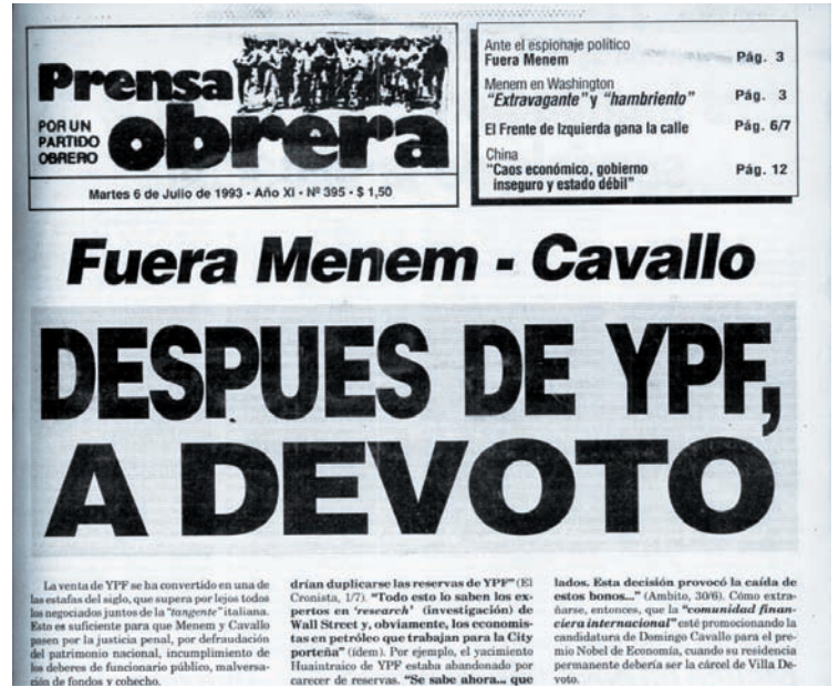
Prensa Obrera, 6 de julio de 1993. La gestión de José Estenssoro, que hoy reivindica Cristina Kirchner, avanzó con el desguace de YPF como petrolera nacional.

arregló para que esas reservas fueran subestimadas antes de la venta parcial de las acciones. Apenas meses después de la privatización, empezaron a "subir". Como resultado de este proceso, el Estado retuvo el 20% de YPF y las provincias otro 12%, mientras que bancos y fondos de inversión locales e internacionales compraron el 46% de las acciones. En años posteriores, la parte privada del capital fue ampliando progresivamente su participación.