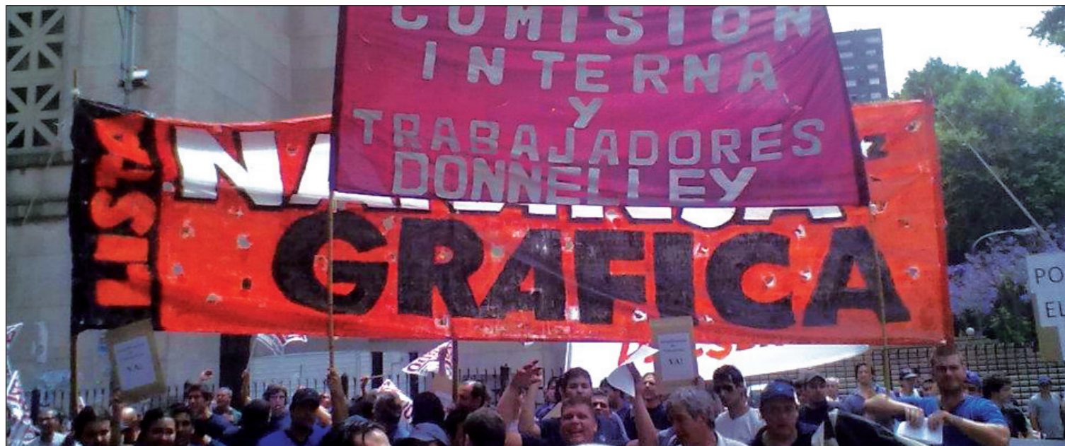
Movilización de los activistas de la oposición a la asamblea del sindicato. Las próximas luchas mostrarán la verdadera relación de fuerzas que existe entre la burocracia en decadencia y el clasismo en ascenso.

Recibimos denuncias de parte de obreros de Cooperativa el Sol, donde no se pusieron