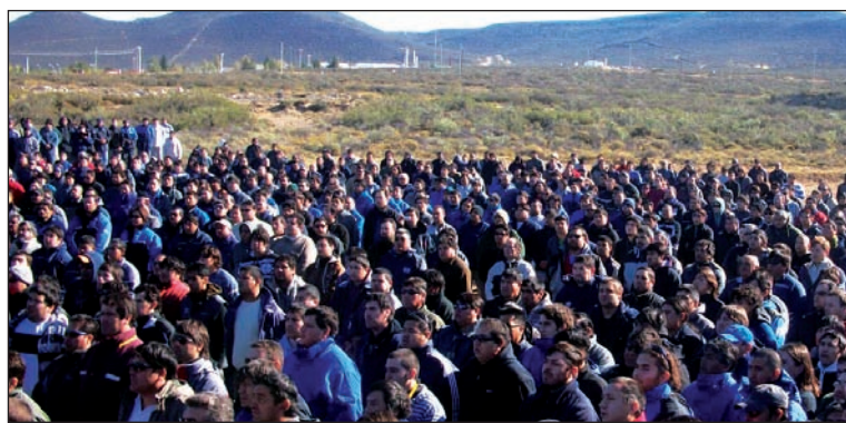
Asamblea de petroleros en el norte de Santa Cruz.