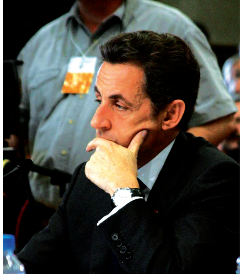
Nicolas Sarkozy. Su derrota acelera la crisis política y financiera de Francia.

La bancarrota de la Unión Europea se concentra de aquí en más en Francia, en especial por el inmovilismo de la izquierda oficial. Hollande, el candidato del PS, se ha limitado a proponer una re-discusión del "pacto fiscal" que firmaron Merkel y Sarkozy, un planteo irrelevante