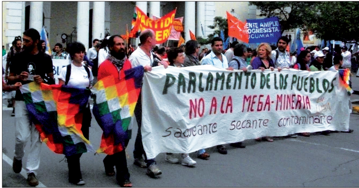
Más de 1.000 personas se movilizaron el viernes 20.

La cuestión de la "expropiación" kirchnerista de YPF delimitó dos posturas. Una sustentada por el PCR, que destacó que la medida era positiva, pero limitada -o sea un paso en la dirección correcta. Y la posición del PO, que destacó que estábamos en presencia