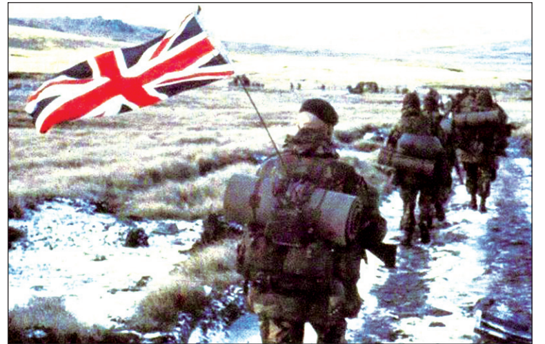
Para los socialistas, la cuestión Malvinas es un asunto secundario y subordinado del problema nacional de Argentina y América Latina: la dominación económica y hasta cierto punto política del capital financiero internacional y sus Estados.

La cuestión de Malvinas resulta una cuadratura del círculo para la intelectualidad pequeño burguesa, sea la cipaya o la nacionalista, porque ignora que su condición de problema nacional deriva de la condición semi-colonial de Argentina. Mientras duró el idilio de esta condición con Inglaterra, Malvinas se refugió en los manuales es-