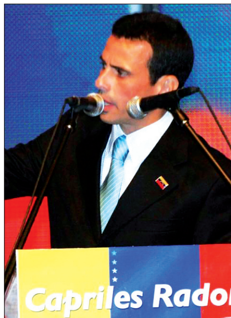
Capriles tomó como referencia a Lula, algo más que un discurso.

Este escenario de base ha quedado fuertemente golpeado por la noticia de que Chávez debe sufrir una segunda operación de cáncer maligno. Todo parece indicar que Chávez busca llegar como sea a octubre, para definir su sucesión una vez superado el trance electoral. Se trata de una apuesta arriesgada, que pone al desnudo la vacancia política en el chavismo. La posibilidad de una desaparición física de Chávez ha acentuado las contradicciones entre Estados Unidos y el gobierno de Brasil, los que se disputan la orientación de una Venezuela sin Chávez. Obama juega la carta de un acuerdo con Dilma Rousseff. Pero, en un año electoral, los republicanos arrecian su ofensiva contra esta política. El resto de los gobiernos del continente sentiría duramente el ocaso del chavismo que produciría la muerte o relegamiento físico de su líder, simplemente porque daría mayor fortaleza a las fuerzas de oposición -por ejemplo en Argentina y, por sobre todo, en Brasil (el PSDB). La hegemonía brasileña significará un féretro de lujo para el Alba y todo lo que tenga que ver con la demagogia nacional y popular. Evo Morales está retrocediendo visiblemente ante los movimientos