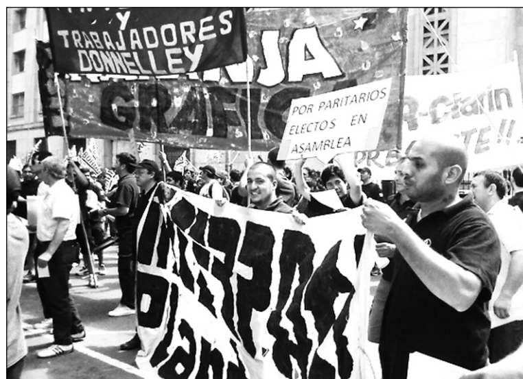
Un gran trabajo de La Naranja en más de 100 talleres.

El texto que está ahora en circulación, en el cual se reclama "que el sindicato se pronuncie contra el ajuste y se convoque a un plenario