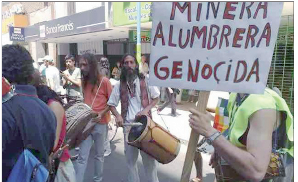
Movilización contra Bajo La Alumbreira. La utilización contra los manifestantes de la "ley antiterrorista" confirma la denuncia hecha por todas las organizaciones que repudiaron su aprobación.