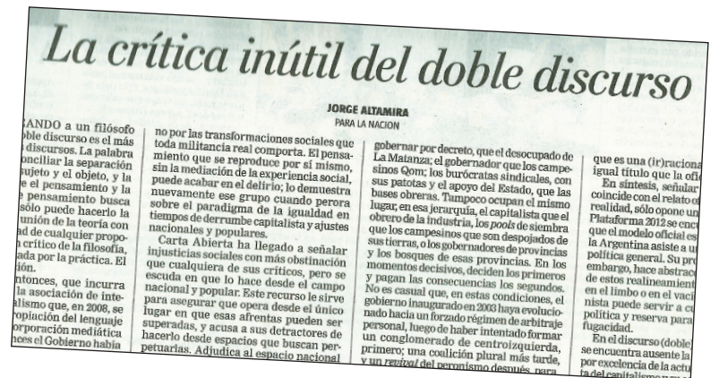
Facsimil del artículo publicado por La Nación .

Este artículo apareció publicado en el diario La Nación , el pasado lunes 30, bajo el título "La crítica inútil del doble discurso". Sirve para destacar la posición de la izquierda en una polémica que ha ganado un espacio considerable en los medios de comunicación de mayor alcance. Lo presentamos al lector en la versión original enviada al diario (los extractos no publicados se recien en bastardillas), dado que refuerzan varios de los planteos más relevantes.