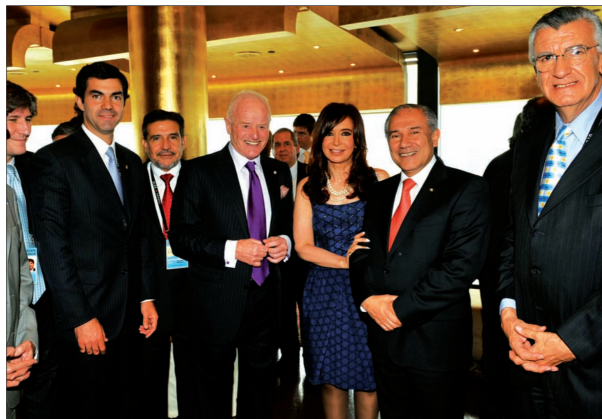
Izq: Junto a Peter Munk -el jefe de la Barrick Gold- posan Amado Boudou, Urtubey, Beder Herrera, Cristina Kircher y Gioja. Der: La pueblada de Famatina instaló un nuevo escenario político y la posibilidad de ejercer el derecho de revocatoria desde la calle.

El jueves 26 de enero, más de 10.000 personas marcharon en capital de La Rioja con la consigna "El Famatina no se toca". La marcha culminó con un festival de "Arte a cielo abierto". Unos 3.000 manifestantes habían llegado de Famatina, Chilecito, Olta, Campaña, Sanagasta y otros pueblos de interior. La presencia de personas de la capital fue enorme. Alrededor de la capital están en marcha cuatro emprendimientos de explotación de uranio a cargo de la empresa Diositex, la que ya fue expulsada de Mendoza por contaminación. En el acto público, que tuvo lugar en la Plaza 25 de Mayo, la multitud reclamó la renuncia del gobernador Beder Herrera.