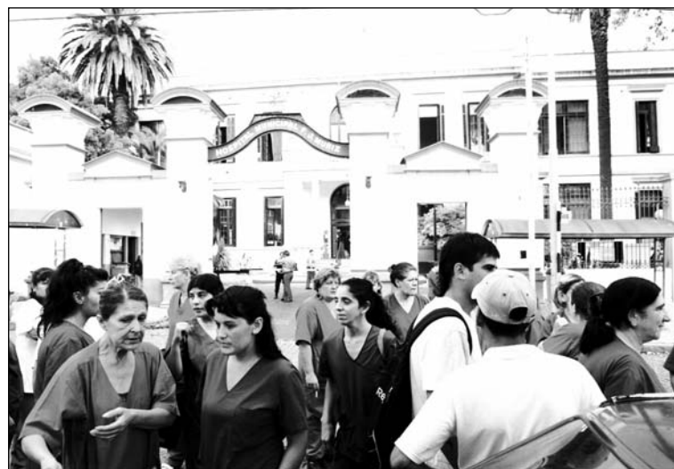
Trabajadores del Hospital Muñiz. El objetivo de la gestión es la preservación del negocio capitalista de la salud, preparemos asambleas hospitalarias para hacer un reclamo unificado.

La lluvia derrumbó los cimientos de un pabellón abandonado y comprometió las estructuras de dos salas de pediatría (las que debieron ser desocupadas) en el Hospital Muñiz. El presupuesto de reparación ya acumula dos rechazos.