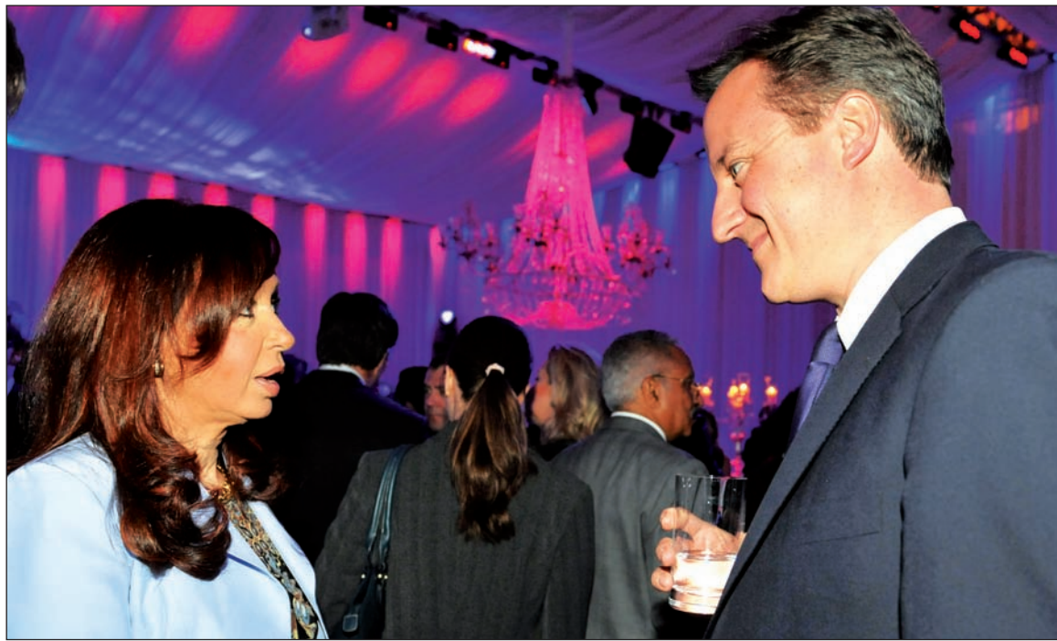
Cristina Kirchner y el primer ministro británico David Cameron. La "unidad nacional" de los K es el taparrabos de una capitulación ante los intereses fundamentales del imperialismo -que en Malvinas es convertir a Argentina en un satélite del capital petrolero y bancario internacional.

La cuestión económica torna ahora insoslayable la reaparición del tema Malvinas. El factor distraccionista -en especial en tiempos de ajuste- ocupa en la actualidad un lugar importante, pero secundario. Ninguna de las concesiones que hicieron Menem-Di Tella en su momento permitieron avanzar en la solución del conflicto siquiera un milímetro. Los K acompañaron al menemismo sin chistar, al extremo de apoyar la privatización de YPF en beneficio de Repsol, la cual no es más que una agencia de la City de Londres. El oficialismo emprendió a mitad de mandato un nuevo rumbo ante la evidencia palpable del fracaso.