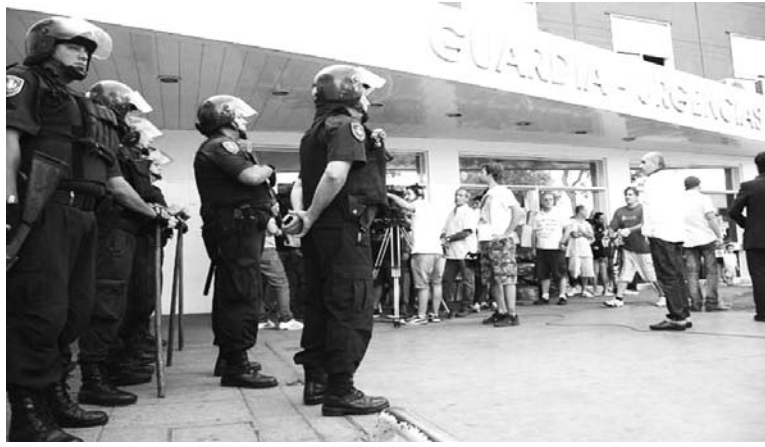
'Seguridad' en el Hospital Santojanni, luego de la acción de los barras.

Mientras el gobierno nacional y el gobierno de la Ciudad se echan entre sí la pelota por la seguridad en los hospitales, los trabajadores ejercen sus tareas en condiciones de creciente inseguridad: escupitajos, amenazas, ro-