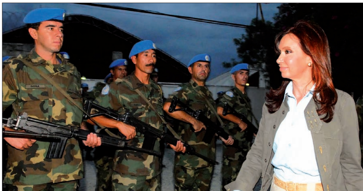
Cristina Kirchner en una visita a tropas argentinas en Haití. La intervención, junto a los ejercicios militares conjuntos con el Pentágono en Panamá y la sanción de la Ley Antiterrorista, es una muestra del carácter semicolonial del kirchnerismo.

Para la "construcción/reconstrucción" de Haití, Bill Clinton le pidió hace unos años una "ayuda" a los grandes capitalistas reunidos en el Foro de Davos, no sin antes avivarlos de las "muy buenas condiciones económicas para la inversión, como por ejemplo muy bajos