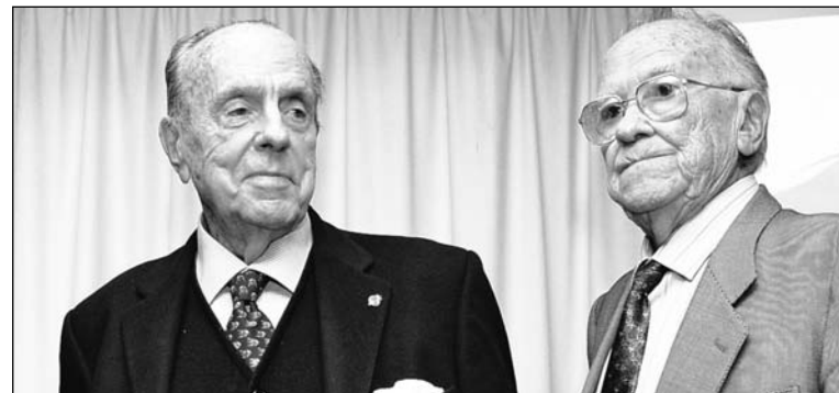
Manuel Fraga Iribarne, viejo líder de la derecha española y Santiago Carrillo, dirigente del Partido Comunista.