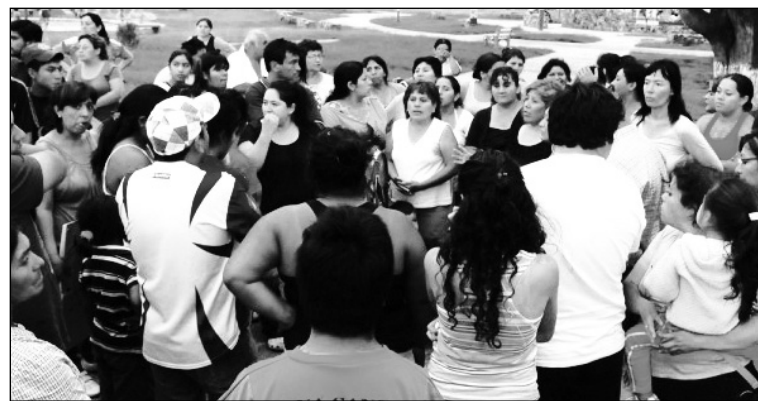
Las asambleas de vecinos marcan un camino independiente. Mientras siga gobernando la misma clase social, nos espera más contaminación, colapsos estructurales y sanitarios.

La intendencia realiza sus campañas de "concientización" para que los vecinos de la ribera no arrojen papellitos y botellas al cauce. También da clases de "prevención", en las que enseña a los niños a guardar su DNI en bolsitas plásticas para poder identificarlos luego de la inundación.