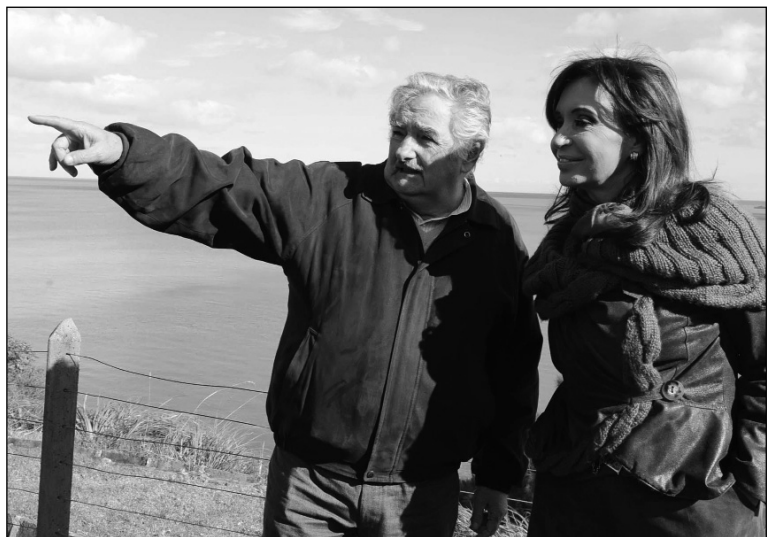
El presidente uruguayo José Mujica, junto a Cristina Kirchner. La "solidaridad continental" de los gobiernos capitalistas está condicionada a una política entreguista de los recursos.

La última cumbre del Mercosur resolvió que los barcos ingleses rumbo a Malvinas no pudieran recalar en los puertos de la región. Los diarios oficialistas de Argentina celebraron la "victoria diplomática" de Cristina. Pero el fervor se desinfló cuando un buque con bandera británica, efectivos militares y el antecedente inmediato de haber localizado petróleo en el Mar del Norte, recaló en el puerto de Montevideo, sin que el gobierno de Mujica hiciera la menor objeción. Enseguida, los funcionarios uruguayos aclararon que el acuerdo de los "hermanos del Mercosur" sólo impedía el paso de buques si éstos ostentaban bandera malvinense. En cambio, no existía ninguna restricción para los de bandera británica. La 'victoria diplomática' resultó una farsa.