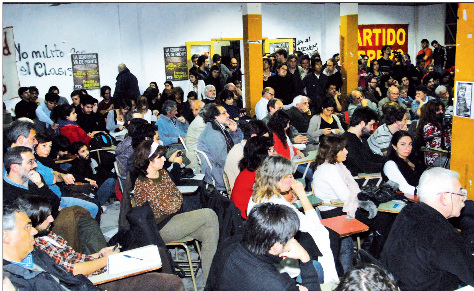
Asamblea de intelectuales, docentes y artistas en apoyo al Frente de Izquierda. La intelectualidad, si quiere desempeñar un rol social transformador, debe, con independencia de las circunstancias particulares de cada intelectual, formar Partido y tomar Partido. Desarrollemos una intelectualidad que contribuya a la construcción socialista revolucionaria.

La caracterización de Pagni, sin embargo, es muy generosa con Carta Abierta. Antes que una delimitación de posiciones frente al derrumbe de la orientación oficial, el texto de Carta Abierta es una operación de encubrimiento de la “sintonía fina” con la que el gobierno adorna el ajuste. Esta operación queda demostrada, de entrada, en el título: “Carta de la Igualdad” -como si la ‘igualdad’ (¡“que se avizora!”), nos asegura el texto) pudiera siquiera ser pensada en un régimen de explotación del hombre por el hombre. La grandilocuencia del propósito no logra disimular la tentativa grosera de tapar -con el abuso de la verbosidad- el tarifa-