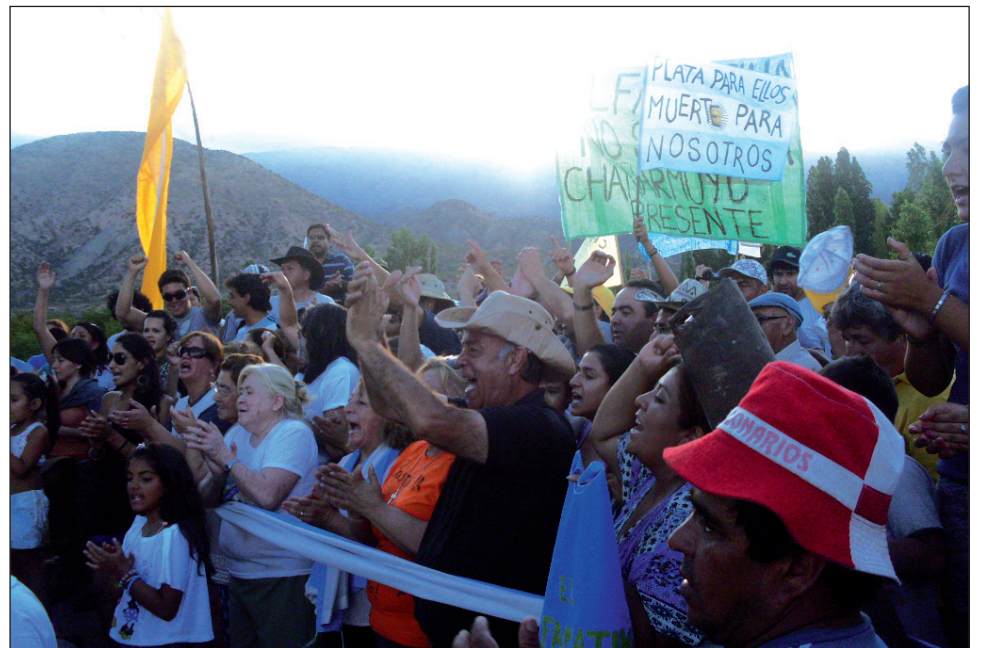
Levantamiento popular contra la minería contaminante.