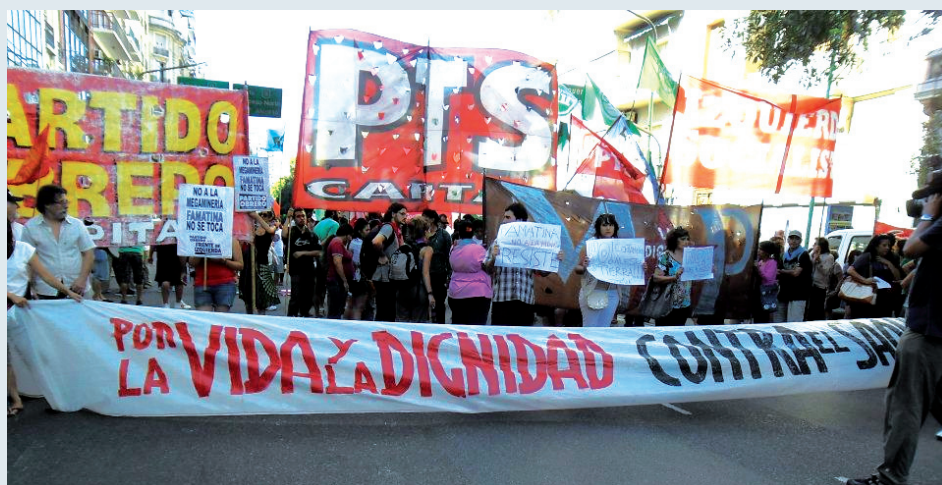
Movilización en Buenos Aires, en apoyo al pueblo de Famatina.

Recordemos también que en Canadá y otros países desarrollados, la minería contaminante está prohibida por su impacto sobre el medio ambiente y que solamente se permite en algunos países subdesarrollados, con gobiernos que admiten que se realice la extracción de minerales suntuarios como oro y plata, de escaso o nulo valor para la industria, a costa de dejar fuentes de agua secas o contaminadas, conver-