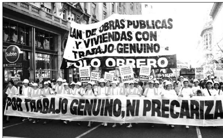
Movilización piquetera. Los manejos y manipulaciones con las necesidades de los más pobres son moneda corriente entre los punteros K.

Luego de cuatro horas de corte, llegó el recule del gobierno y