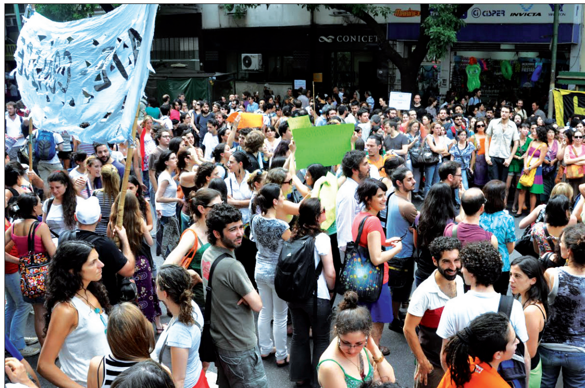
Movilización de jóvenes investigadores de Conicet.

La política nacional y popular de ciencia y técnica es incapaz de superar sus limitaciones capitalistas.