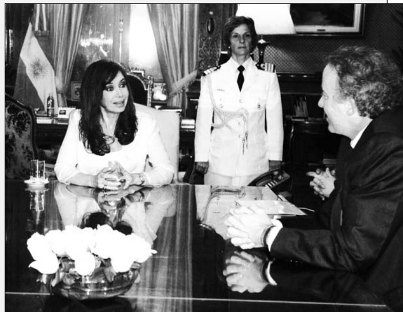
La presidenta, con directivos de Repsol. La dureza con los monopolios sirve para las conferencias de prensa, pero sólo prepara la coartada para una agresión a los trabajadores.

Si de denuncias a las petroleras se trata, los funcionarios se cuidaron muy bien de silenciar la más grave de sus cartelizaciones. Repsol, Total, Petrobras y otras se han sentado "consensuadamente" sobre los pozos petroleros y gasíferos, a la espera de una re-