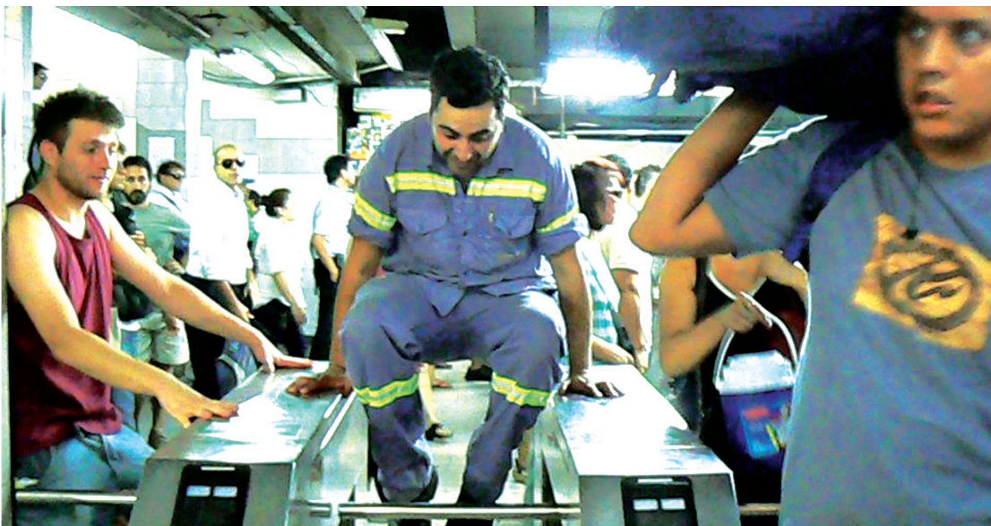
La lucha contra el tarifazo en el subte (página 5). Para derrotarlo, es necesaria una acción de conjunto de las organizaciones sindicales.

D urante diez años, quienes gobiernan usaron el presupuesto público para rescatar a las privatizadas con subsidios.