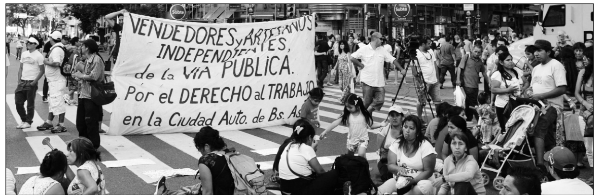
La lucha de los manteros en centro de la ciudad. El único 'espacio' que protege el macrismo es el de las constructoras inmobiliarias.

Durante los años del 'crecimiento a tasas chinas', la instalación de manteros y vendedores ambulantes siempre fue en ascenso. La venta callejera no es "un resabio de 2001", sino un retrato de la reactivación kirchnerista, que agudizó la polarización social. Ahora, cuando la curva de la economía se revierte hacia abajo, el