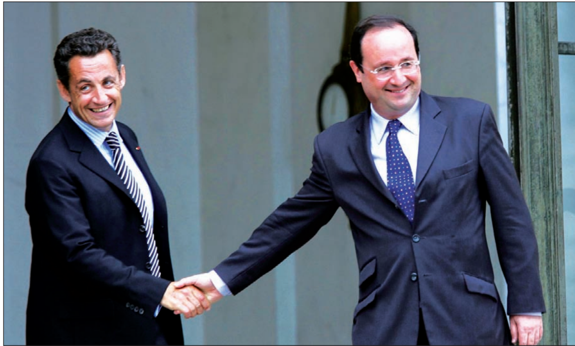
El presidente francés Nicolas Sarkozy saluda al candidato del PS, François Hollande. Ante la crisis del régimen político, luego de las revueltas y huelgas de 2008 y 2009 los explotados de Francia tienen una oportunidad para ir más lejos que sus ‘ensayos’ históricos previos.

No es la primera vez que el Frente Nacional arribaría al ballottage. Pero, a diferencia de 2002 (cuando el padre de Marine Le Pen desplazó del segundo lugar al ‘socialista’ Jospin y ganó el derecho a enfrentar al derechista Chirac, el antecesor de Sarkozy), esta vez su hija pondría fuera de juego al derechista Sarkozy y ‘pelearía’ la final con el ‘socialista’ Hollande. La diferencia es sustancial, porque en aquella ocasión Chirac se quedó con el ‘voto republicano’ de toda la izquierda, incluidos los trotskistas, contra el ‘fascismo’. Ahora, en cambio, una parte significativa del electorado de derecha (o sea el ‘sarkozysmo’) acompañaría a la candidata ‘fascista’ contra el ‘republicano’ Hollande. Como se ve, no habrá reciprocidad ni será devuelto el favor de 2002. O sea que el Frente Nacional podría ganar las presidenciales, como ya ha ocurrido en Hungría -aunque Francia, claro está, no es Hungría. En sus tres décadas de existencia, el princi-