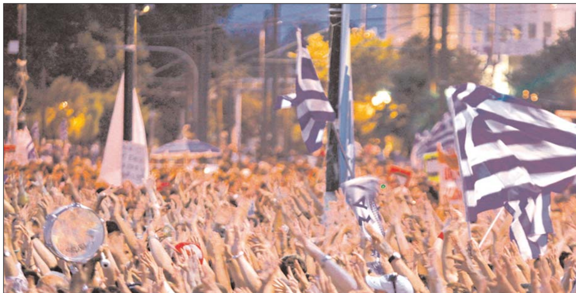
'Argentinazos' de ayer y de hoy. Arriba: cacerolazo en Buenos Aires durante las jornadas de diciembre de 2001. Hoy se desarrolla una perspectiva política revolucionaria, en el marco de una crisis definitiva del gobierno y de una crisis mundial imparables.

Abajo: movilización en Atenas en octubre de 2011. La bancarrota de la UE plantea la toma del poder por los trabajadores y la Unidad Socialista de Europa.