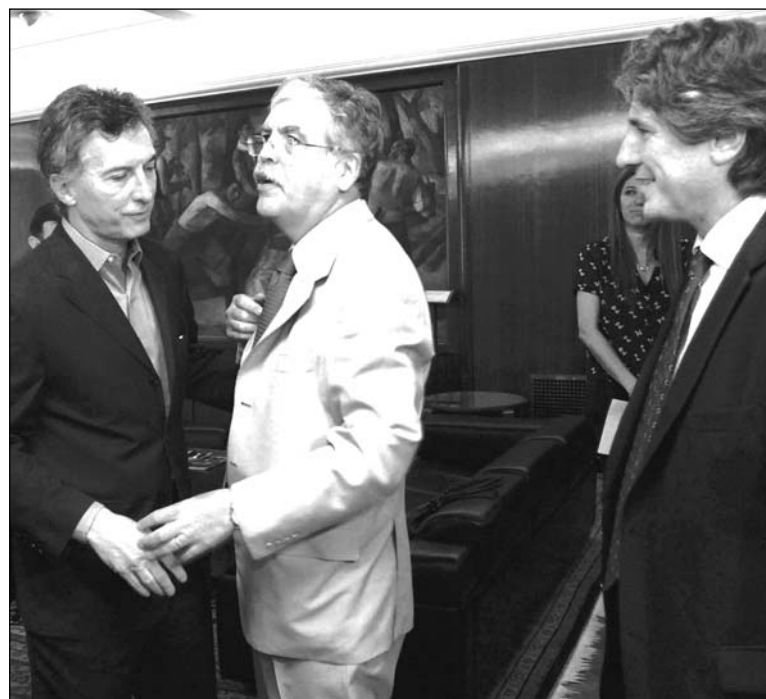
Macri, De Vido y Boudou: En la reunión de traspaso del subte.

Roberto Pianelli, secretario general del sindicato de trabajadores de Metrovias, se manifestó "preocupado" por "empezar a formar parte de las políticas macristas, que no son las mismas que la del gobierno nacional". Pero el dirigente no se pregunta por qué, siendo 'distintos', los K han aceptado entregarle el subte a los derechistas. La razón es que unos y otros defienden el régimen de privatizaciones y, principalmente, la garantía que éstas requieren para sus operaciones económicas futuras: el tarifazo. En la legislatura, el kirchnerismo le habilitó a Macri operaciones de endeudamiento usurario, uno de cuyos destinos son las obras del subte. Pero el capital financiero y la patria contratista exigen para estos negocios garantías "sólidas", o sea, que los ingresos del subte no dependan de los subsidios estatales sino de las tarifas. A partir de esto, se entiende por qué el Estado nacional sólo cubrirá el 50 por ciento del actual subsidio a Me-