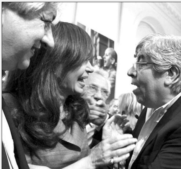
Julio Piumato, Cristina Kirchner y Hugo Moyano.