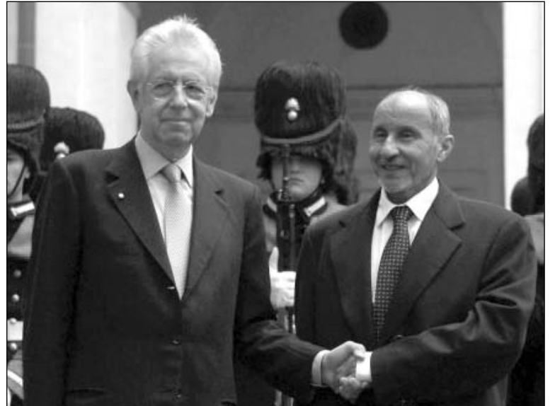
Mario Monti -jefe de gobierno italiano-, junto a Mustafá Abdul-Jalil -presidente "de transición" libio. Se afanan el dinero de Libia para usarlo en el rescate del capital internacional.