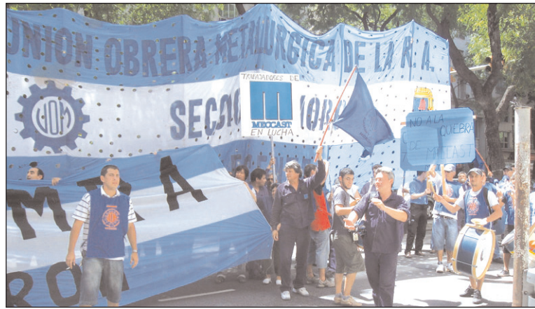
Trabajadores de Mecca Castelar. La lucha mostró para qué deben servir los sindicatos.

El martes 27, con poco tiempo debido a la proximidad de los feriados -tanto estatal como judi-