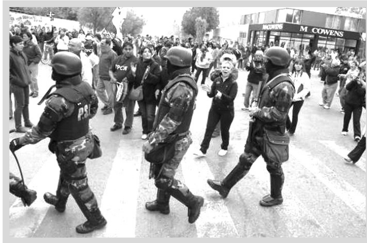
Rebelión contra el ajuste en Santa Cruz. No sólo está planteada una enorme movilización de fuerzas, sino también un programa alternativo.

Con la quiebra de las provincias, estalló otra de las contradicciones del kirchnerismo. La contrapartida del superávit fiscal del Estado nacional, que el gobierno exhibía como una expresión de "fortaleza", era la asfixia económica de las provincias. De igual modo que la Anses, los trabajadores y el pueblo del interior contribuyeron a bancar el pago de la deuda pública y los subsidios a los capitalistas. Los Scioli, De la Sota y otros aspiraban a postergar sus crisis a través de la emisión de deuda en el exterior, pero el default europeo ha derribado esa posibilidad. Como alternativa, provincias como Córdoba o Mendoza estudian endeudarse en el mercado local, pero sólo podrían hacerlo a tasas de interés usurarias debido al peligro de una devaluación del peso; en dólares, quedarían sujetos a una hipoteca temeraria. En