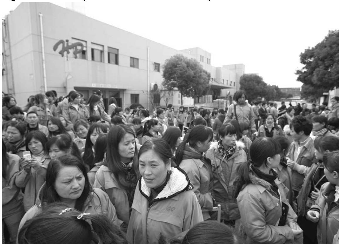
Trabajadoras textiles en huelga. Los que pretendieron que la restauración del capital en China sería la vía de escape para la economía mundial suelen olvidar que esa restauración se procesa en los mismos términos de las leyes que llevan al capital a la crisis y al colapso.

El conflicto de Wukan toca la línea de flotación de todo el proceso de restauración capitalista: la cuestión de la privatización de la tierra. Es la sustentación de la gigantesca especulación inmobiliaria que atraviesa el país. En la China ultracapitalista no hay propiedad privada de la tierra: como propiedad del Estado, los gobiernos están autorizados a expulsar