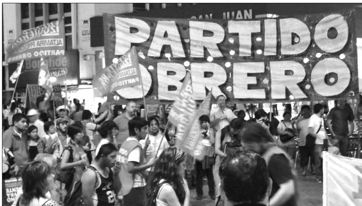
Acto del PO salteño. Las bancadas obreras son un instrumento político, de lucha y de organización de la clase obrera, en el camino hacia el gobierno de los trabajadores.

La llegada del Partido Obrero al Parlamento despertó la atención de muchísima gente. Las sesiones comenzaron a ser seguidas sistemáticamente por un amplio sector de trabajadores y de las clases medias. Nuestras intervenciones llevaban por primera vez a ese ámbito los reclamos e intereses populares.