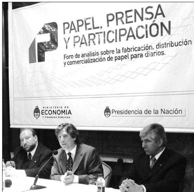
La libertad de imprenta requiere la expropiación del monopolio y la exclusión del Ejecutivo del manejo de la prensa. Resulta imposible ser un demócrata consecuente sin poner en cuestión todo el régimen político y social imperante.

Como se ve, la ley no tiene el propósito de asegurar la provisión de papel, disponible para todo el que pueda pagar algo más de 3 mil dólares la tonelada. Como ha dicho el diputado kirchnerista Agustín Rossi, la nueva norma no pone en peligro los derechos de propiedad de Clarín y La Nación sobre Papel Prensa. La posibilidad de que el