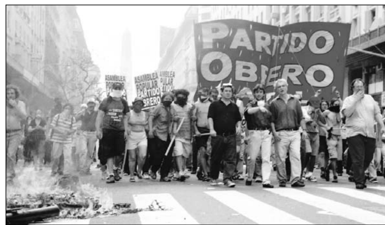
Columna del Partido Obrero, el 20 de diciembre de 2001.

• "El proceso de lucha popular ya ha comenzado... El planteamiento del Partido Obrero es la necesidad de que cada movimiento popular, sea un cacerolazo, sea una ocupación contra los despidos, se convierta en la ocasión de una Asamblea Popular del barrio, del distrito o de la provincia. Que se formen comisiones, se elijan delegados, que gente que sale a la calle a protestar arme una Asamblea Popular que concentre la soberanía del pueblo, que sea el lugar donde se tomen las decisiones. Que a partir de las Asambleas Populares en cada lugar del país, se arme una Asamblea Popular provincial o nacional que coordine el movi-