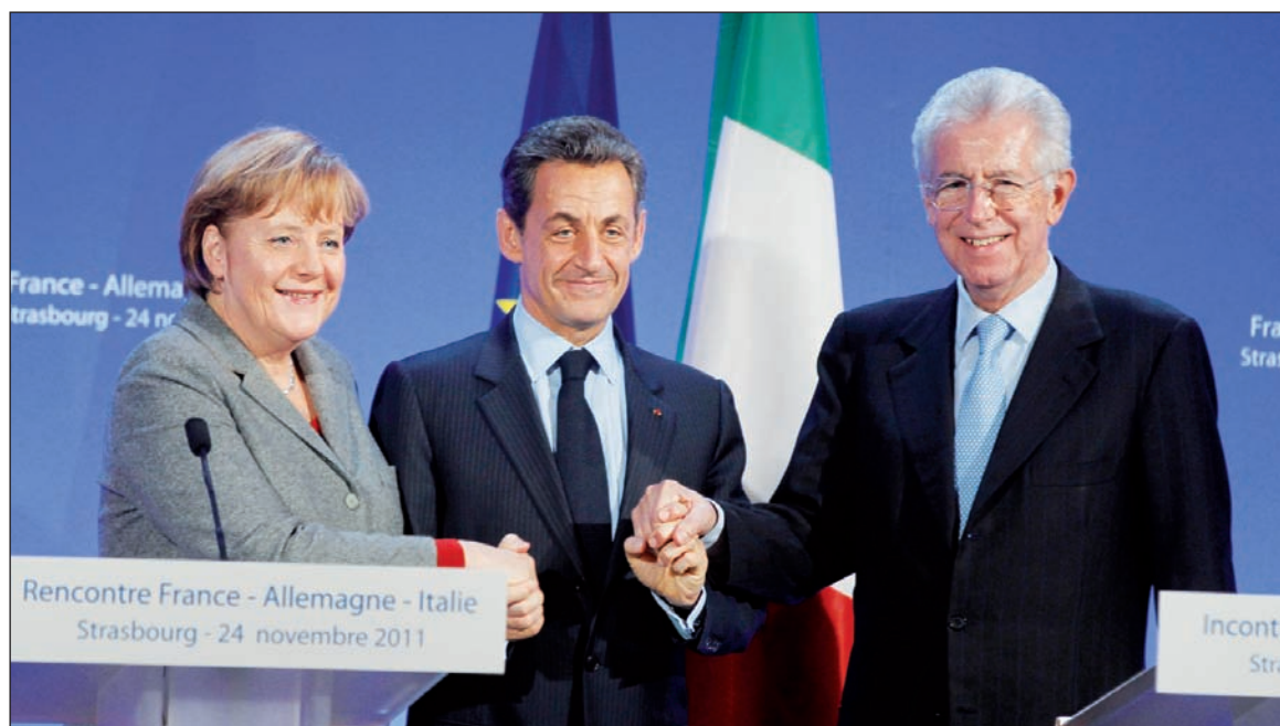
El derechista "Merkozy" quiere la tutela de los presupuestos nacionales. La Unión Europea y el euro están condenados: si no le pone fin la clase obrera en nombre de una Federación de gobiernos de trabajadores, le pondrán fin la derecha y el fascismo para reforzar la opresión nacional.

Las salidas que se discuten en Europa son fuertemente deflacionarias -o sea reducciones de gastos públicos y de salarios, depre-