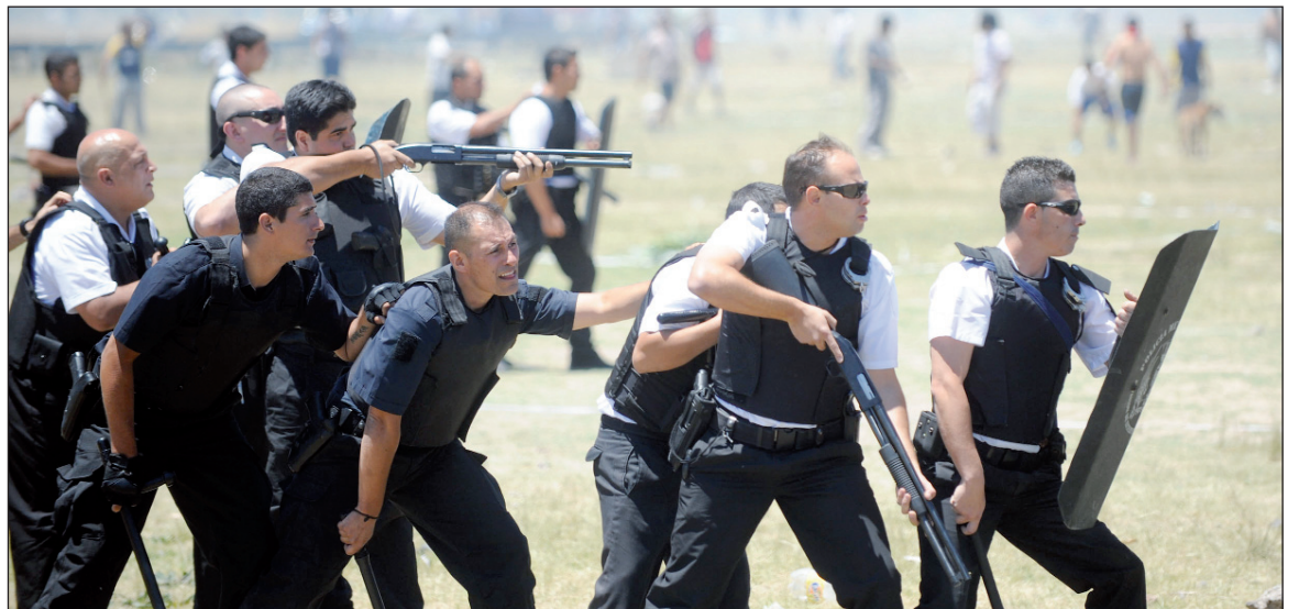
Policías de la Federal y la Metropolitana durante la represión. Un año después, todavía no hay detenidos ni procesados.