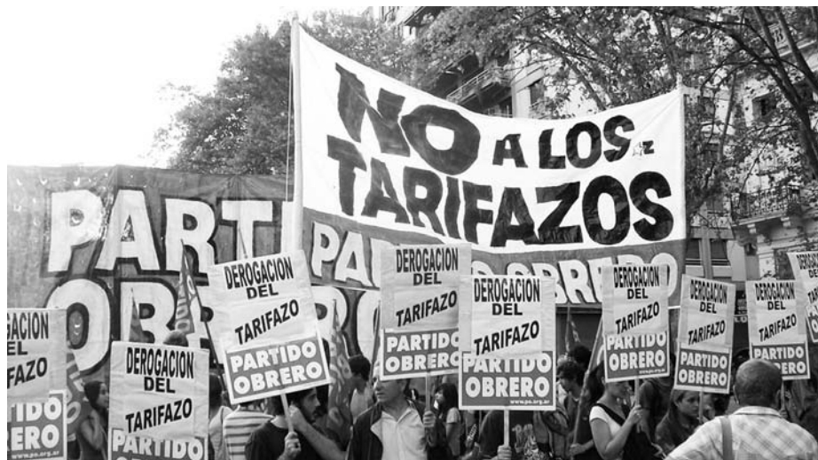
Juntamos fuerzas contra los tarifazos e impuestazos. El gobierno pretende forzar una gigantesca transferencia de ingresos proveniente del bolsillo popular a favor del capital.

No es moco de pavo. "Por cada 100 pesos que se eliminan de subsidio, hay que sumar 28 pesos por los tributos nacionales o de otro nivel" (ídem). Cuando se habla de "otro nivel", se hace referencia a los tributos provinciales y municipales, los que