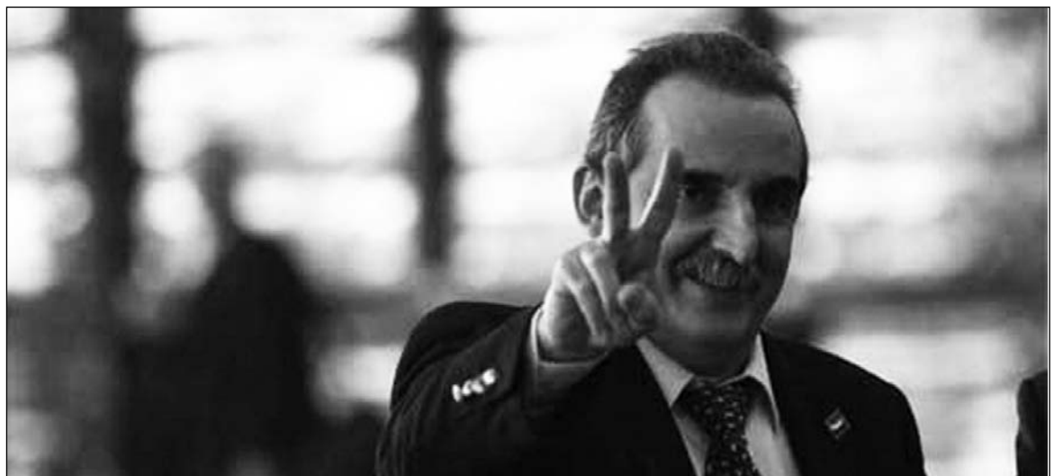
Guillermo Moreno, secretario de Comercio. Los especuladores tienen ganancias fabulosas gracias a los dibujos del Indec, mientras el gobierno fortalece el tarifazo más brutal desde 2002.

“Lo sorprendente es que aun en caso de que la empresa (es decir, el gobierno) gane menos, los tenedores del cupón PBI cobran más y más cada año... (que supere) el piso del 3,2%” ( Ambito Financiero , 29/8).