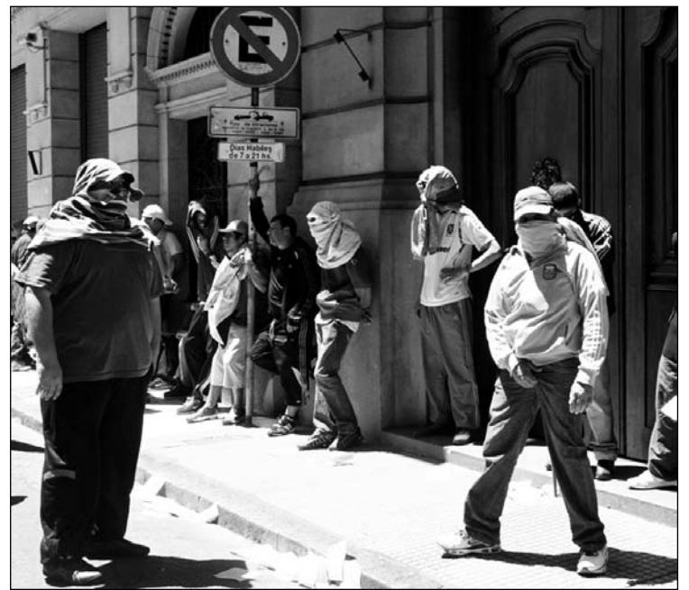
Para aprobar la ley fue necesario el ataque a los docentes con doscientos patoteros. La movilización dejó planteada la necesidad de la lucha por una nueva dirección sindical.