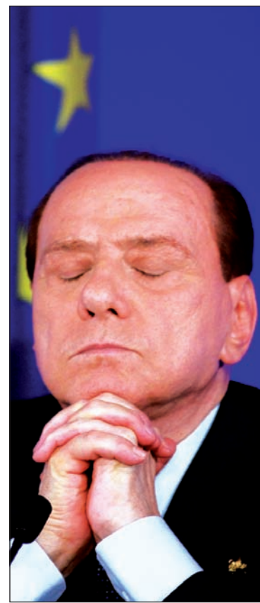
Berlusconi, una renuncia a plazo fijo.

La descalificación de las llamadas deudas soberanas (del Estado) ha quebrado la última ancla de referencia de valor para el movimiento de capitales, una vez que las monedas han dejado de referenciarse en el oro. Se trata de la ruptura de una relación económica clave en un sistema de mercado. “Esto puede obligar a los bancos centrales (...) -explica Gillian Tett, del Financial Times - a imponer quitas más duras, no ya a las deudas averiadas de Grecia, sino también a los títulos con riesgos potenciales” (3/11), en