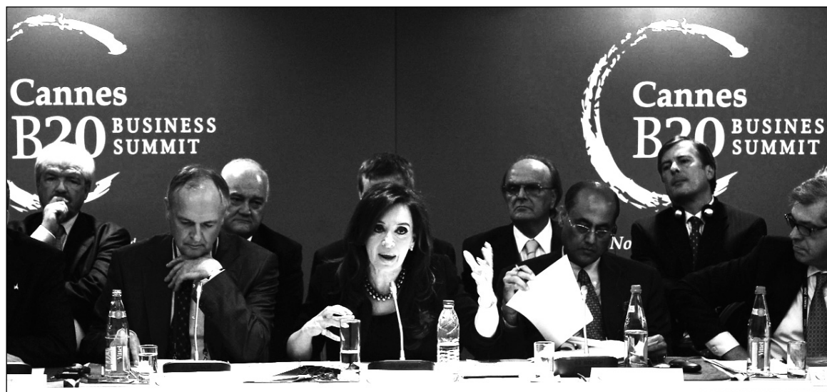
En Cannes, contra el "anarcocapitalismo" . La nueva etapa se llama 'anarcokirchnerismo': acuerdo con el Club de París; nuevo endeudamiento internacional; 'tarifazo'; ataque a los aumentos de salarios; mayor criminalización de la protesta social.

En Cannes se produjo un hecho curioso: CFK rechazó la 'regulación' del mercado internacional de alimentos y también la aplicación de un impuesto a las transacciones financieras. ¡CFK reaccionó como la Presidenta de una Mesa de Enlace cuando los Merkozy le propusieron establecer una resolución 125 a nivel internacional! Para defender los ingresos por exportaciones agropecuarias de Argentina, CFK no tuvo reparo en coincidir en una alianza con el capital financiero que especula con materias primas. Parece una movida excelente, pero inviabiliza cualquier medida de 'regulación' en cualquier otro mercado internacional. No solamente esto: fomenta el negocio