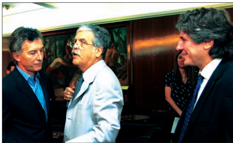
Macri, De Vido y Boudou. Las negociaciones se mantienen bajo absoluto secreto.

El primer reclamo, entonces, de los trabajadores, tanto de los que usan el servicio como de los