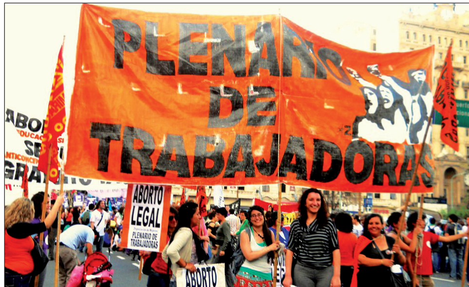
Todos los bloques se disciplinaron a la presión de la Iglesia.