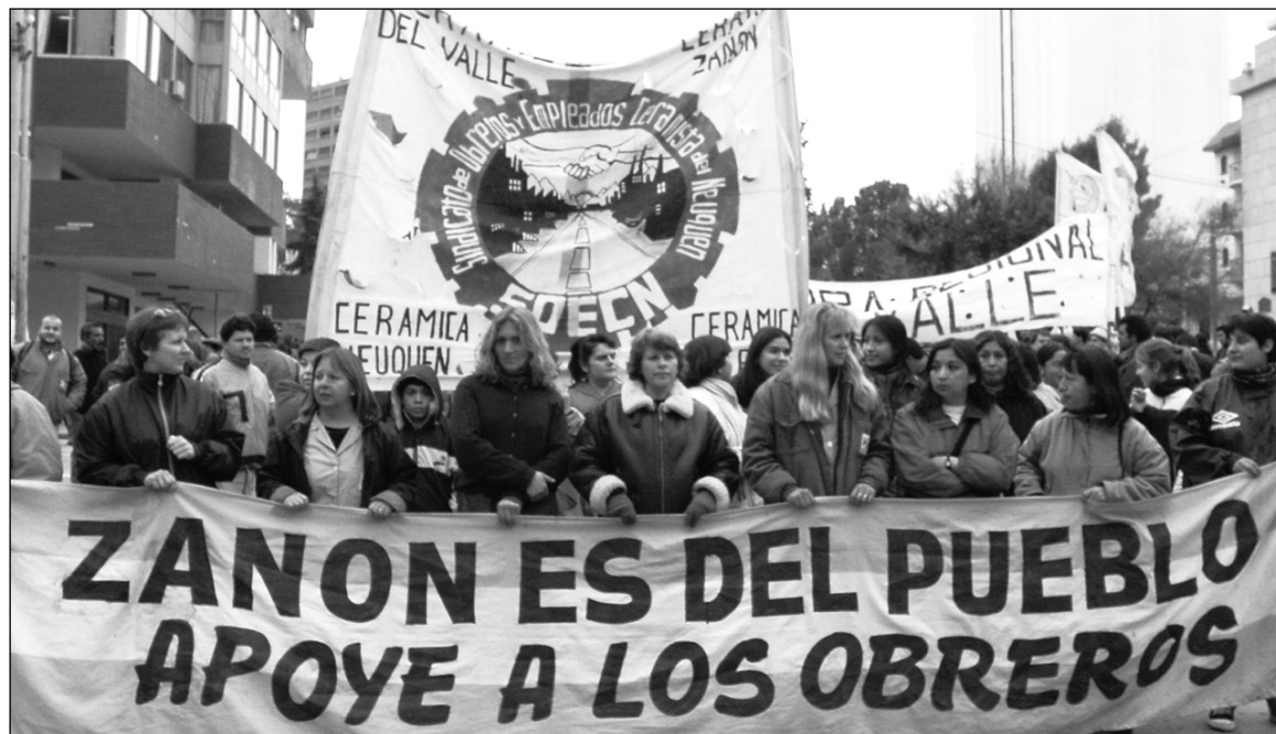
Los trabajadores de Fasinpat sufren un estrangulamiento político, económico y legal. Librems la batalla por la victoria decisiva de la gestión obrera.

Aunque Fasinpat acaba de concretar una operación de venta al Estado por un millón de pesos, es una proporción modesta del volumen de facturación; casi nada si lo comparamos con lo que gasta la provincia en materiales, o con las necesidades habitacionales insatisfechas -50.000 viviendas. La dificultad de ventas vuelve a Zanón