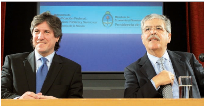
Boudou y De Vido anuncian el fin de los subsidios. Como en el verano de 2009, tenemos que movilizarnos y desenvolver una intensa acción política.

Asambleas para combatir el 'ajuste' y desarrollar el Frente de Izquierda