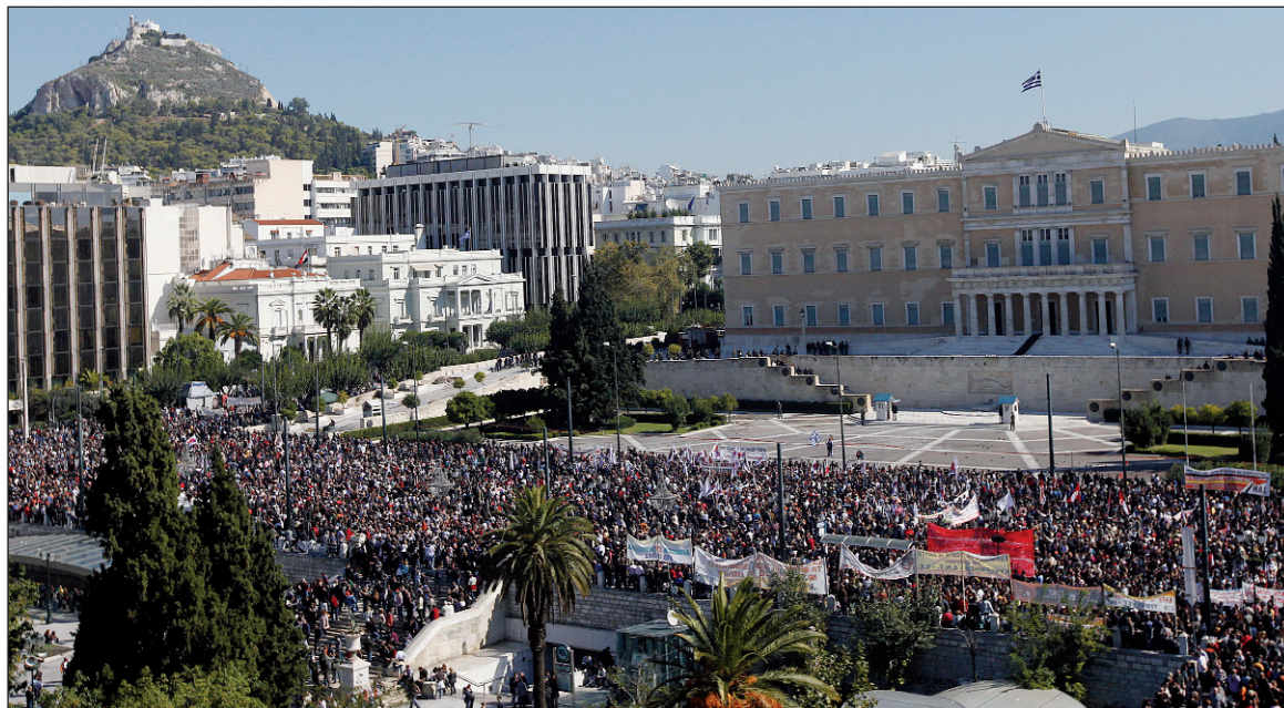
Grecia viene coqueteando desde hace tiempo con una crisis revolucionaria. La tendencia a la declaración de bancarrota del capital continúa, por otra parte, implacable.

El nuevo paquete que debía aprobar Grecia estaba varias veces envenenado, pues le exigía despedir a treinta mil empleados del Estado, privatizar industrias y servicios, y para colmo hacerse cargo de 'nacionalizar' la banca griega, la cual se encuentra quebrada (o sea: se deben hacer cargo de la pérdida). El canje ofrecido por la 'troika' para esta dosis de 'austeridad' era igual a cero, porque la prometida reducción de un 50% no pasa de un proyecto vago -el cual no pone remedio a la situación de quiebra de las finanzas públicas- y porque la creación de un Fondo de Rescate de hasta un billón de euros no ha salido de la fase imaginativa. Políticamente, la exigencia de la 'troika' tenía un solo y único significado: despachar al gobierno que encabeza Papandreu, disolver el Parlamento y transferir el gobierno a la derecha por medio de nuevas elecciones. Papandreu respondió a esta iniciativa golpista con la convocatoria a referendo, pero sin ponerle fecha. Con este planteo, ha pedido un "voto de confianza" al Parlamento. El viernes podría pasar a mejor vida si pierde la votación. Lo único que ataja el temor a destituirlo, luego del llamado al referendo, es que detone una rebelión popular. Grecia viene coqueteando desde hace tiempo con una crisis revolucionaria -quizá logre su propósito.