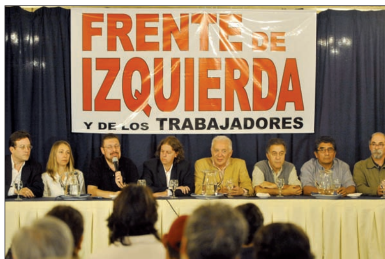
Candidatos del Frente de Izquierda. Se bloquea la representación política de los explotados con un sistema parido por la dictadura militar y convalidado por los gobiernos de la democracia.

En segundo lugar, el régimen de la "década infame" impuso en 1934 -bajo el gobierno de un Martínez de Hoz- la división de la provincia en ocho secciones electorales, una reforma política nada ingenua. La división permite que los distritos menos poblados o domi-