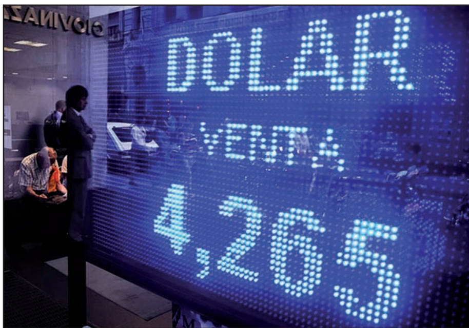
"Corralito" cambiario contra los trabajadores y pequeños ahorristas. La capitulación ante los banqueros y capitalistas, una confiscación contra los que trabajan y un hundimiento en el pantano de la bancarrota capitalista.

Tuvieron que fugarse del país 7.000 millones de dólares en menos de noventa días para que el gobierno admitiera la existencia de un "golpe especulativo" y dispusiera de medidas intervencionistas en el mercado de cambios. Mucho antes de que eso ocurriera, el Frente de Izquierda denunció esta sangría en el curso de la campaña electoral y planteó la apertura de los libros de las grandes corporaciones y bancos, así como el control obrero de sus operaciones. El intervencionismo oficial sólo apunta a arrancarle una tregua a los especuladores para preparar la devaluación. En los hechos, ha establecido un 'corralito' para los pequeños ahorristas.