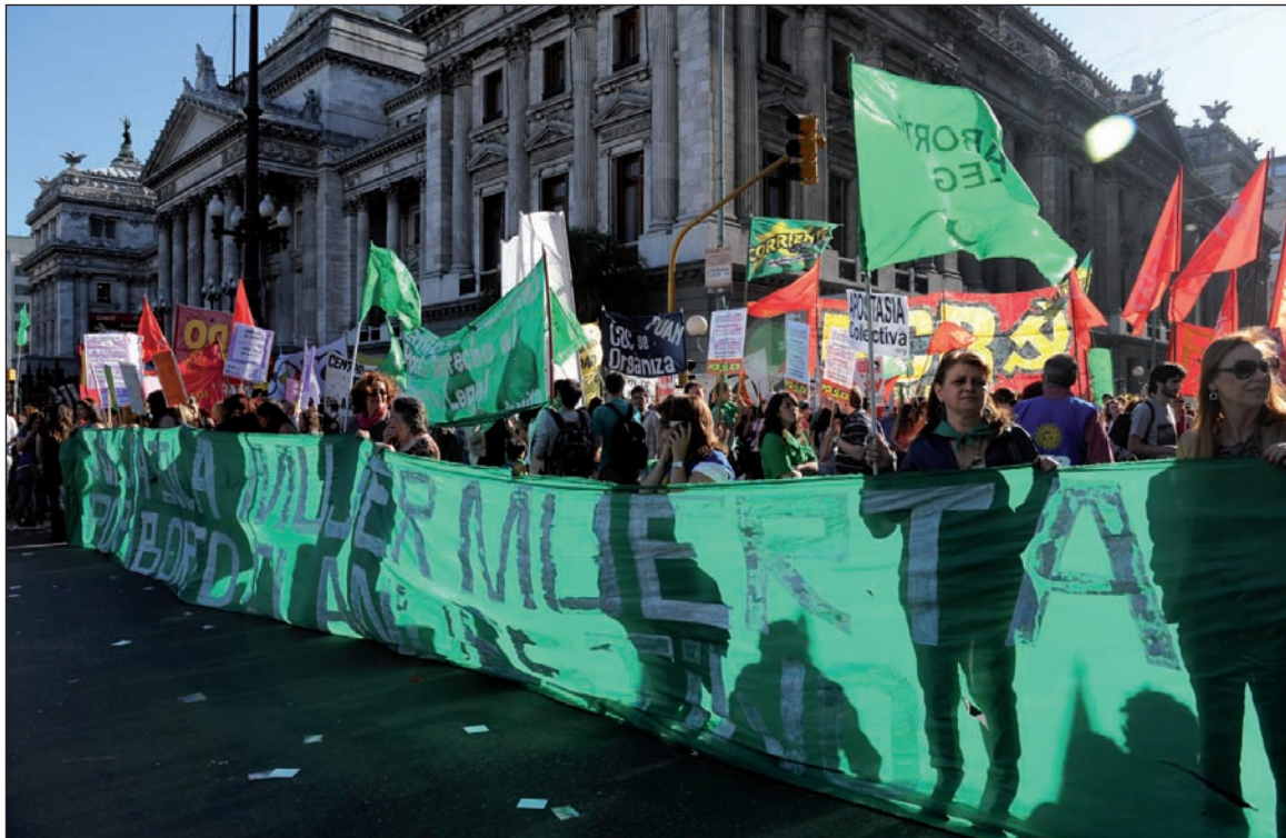
Movilización por la aprobación de la ley. No dejaremos que la lucha por el aborto legal quede en un saludo a la bandera en el Parlamento.

Mientras esto ocurría adentro, afuera se desarrollaba una movilización a favor del aborto legal, que contó con la presencia de los partidos del Frente de Izquierda, la Fuba, la Compa, la CTA, el PCR y el MST, junto a integrantes de la Campaña por el Derecho