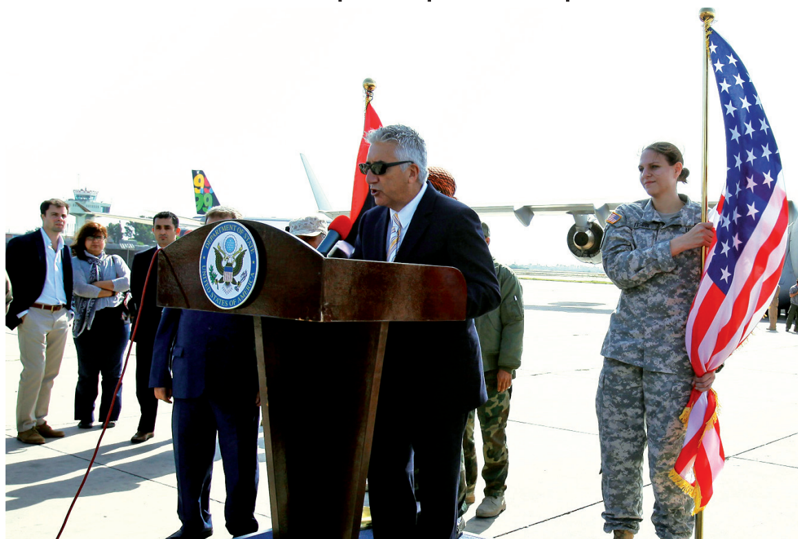
El embajador norteamericano en Libia, Jum Kredz, anuncia la llegada de 'ayuda humanitaria'. La restauración del "orden" reclamado por el imperialismo exige, en primer término, el desarme de la población y la reorganización de un ejército centralizado.

La ejecución sumaria de Gaddafi, cuando ya había sido detenido, obedece no sólo al temor de que el prisionero se convirtiera en un factor de reagrupamiento de la oposición al nuevo régimen, sino también a las consecuencias imprevisibles que podrían haber tenido las revelaciones del dictador, en un eventual juicio, sobre sus más que estrechos vínculos con las potencias imperialistas que ahora impulsaron su derrocamiento. A ocho meses de iniciado el levantamiento contra Gaddafi en la ciudad de Bengasi, la rebelión ha sido virtualmente copada por las fuerzas imperialistas y sus personeros locales al mando del Consejo Nacional de Transición, actual gobierno interino del país.