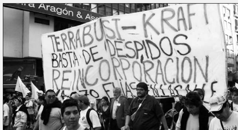
Movilización durante la huelga de 2009. La victoria en Kraft refuerza la lucha por la construcción de una corriente clasista en el movimiento obrero argentino.

J: Existe un profundo desprecio por parte de la empresa hacia los trabajadores; a muchos compañeros que están con problemas de salud los hacen trabajar igual. Hay muchísima sobrecarga en los puestos de trabajo; esto está apañado por el gobierno: quedó claro cuando la Presidenta desmereció las tendinitis, esto es en beneficio de la empresa. También están dejando afuera de las líneas a muchos trabajadores, en aquellas donde antes trabajaban 15 ó 20 trabajadores ahora las están haciendo funcionar con cinco o seis. No les importa la salud de los compañeros; ahora sortean una moto para aumentar el presentismo. Están haciendo to-