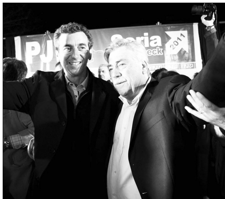
El ministro del Interior, Florencio Randazzo, junto al gobernador electo (y ex jefe de la Side, que preparó la represión en Puente Pueyrredón), Carlos Soria.

El Partido y el Frente de Izquierda (en Viedma y Bariloche) desarrollaron una intensa campaña (continuidad de las elecciones "primarias abiertas"). Nuevas relaciones, un padrón en pleno desarrollo y la