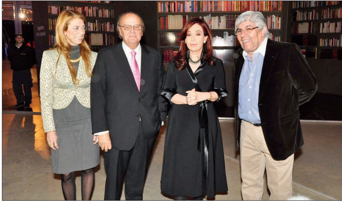
Cristina Kirchner, junto a la secretaria de Industria, el titular de la Unión Industrial Argentina y el líder de la CGT. La capacidad de arbitraje bajo las condiciones de la crisis mundial es muy estrecha.

libertad de prensa y Napoleón”. Viau alude a la posición sobre el bonapartismo que Altamira expuso en el programa de TN, “Código Político”, del jueves precedente.