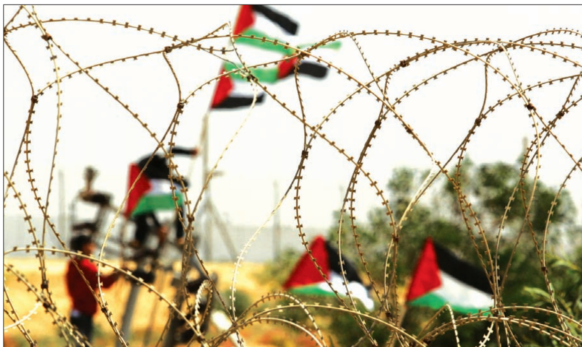
Frontera de Gaza. La declaración votada por la ONU -no ratificada por el Consejo de Seguridad- no plantea la expulsión de los colonos israelíes de los territorios ocupados, convirtiéndolo al planteo en inocuo y a la 'independencia' en una burla, pero necesarios para procurar contener el proceso revolucionario de Medio Oriente.

Lo más interesante, sin embargo, es que la iniciativa de llevar a la ONU la propuesta de una declaración de independencia para Palestina ha sido impulsada por el propio imperialismo; de otro modo nunca hubiera llegado a la Asamblea General. Tampoco podría haber sido de otro modo, toda vez que la Autoridad Palestina es una agencia política de la CIA, que entrena y dirige a sus fuerzas de seguridad, junto al Mossad sionista. Esa misma Autoridad carece de legitimidad, toda vez que el mandato del gobierno ha vencido