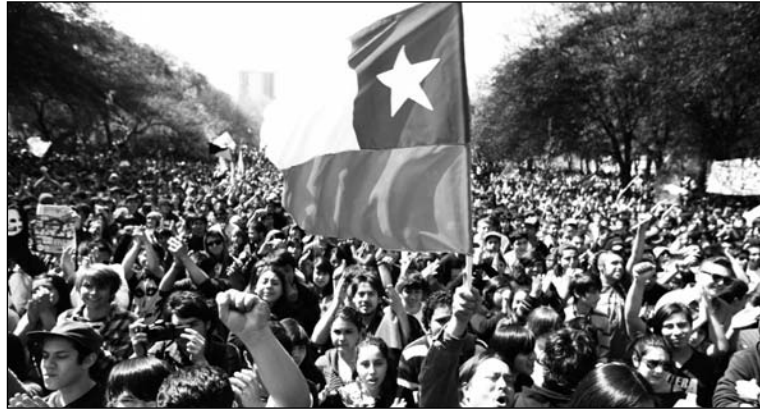
150.000 ocupan las calles. Colapso del modelo educativo, rebelión estudiantil y repudio popular, crisis mundial; los elementos para una posible disolución del régimen político.