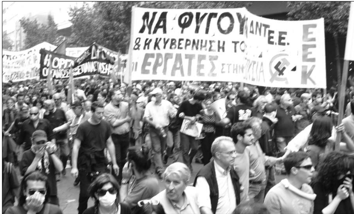
"Hay una salida obrera y popular frente a la bancarrota y la catástrofe". Movilización de nuestros compañeros de Grecia.