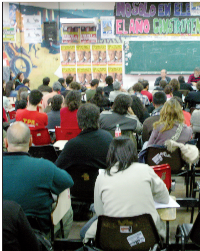
Jornadas de debate. La asamblea ha logrado atraer a un importante número de intelectuales y docentes universitarios en oposición a los kirchneristas del estilo de Carta Abierta.

Es en el marco de la unidad político-electoral del Frente de Izquierda, y de la lucha por desarrollar nuestras ideas en amplios sectores de las masas, el Partido Obrero ha desafiado a que una clarificación de las diferencias políticas sobre la base de la independencia de clase, la revolución permanente y la refundación inmediata de la IV Internacional.