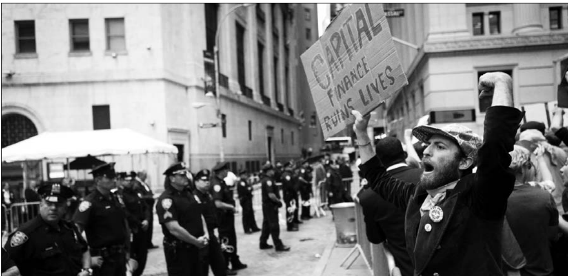
"Las finanzas del capital destruyen vidas". Movilización de 'indignados' en Wall Street.

La 'solución argentina' no tuvo, sin embargo, nada de argentina: fue una 'solución china', pues a partir de abril de 2002 el ingreso de China al mercado mundial resucitó el mercado agroexportador de Argentina y habilitó la salida de aquel derrumbe. Ninguna devaluación podría devolver a Grecia al mercado mundial (salvo en el turismo), cuando la sobreproducción mundial es mayor que nunca, hay