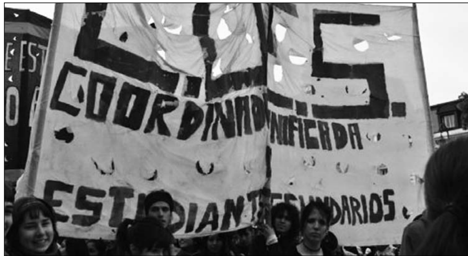
Movilización de estudiantes secundarios. La tarea es continuar con la lucha por las reivindicaciones pendientes.

hoy es continuar con la lucha que dimos en el primer cuatrimestre por la totalidad de las reivindicaciones pendientes: el boleto estudiantil gratuito y para todos, con credencial única emitida desde cada establecimiento educativo las 24 horas del día los 365 días del año; la derogación del decreto 330; el cumplimiento de los planes de obra entregados en 2010, que en general se encuentran incumplidos; la entrega in-