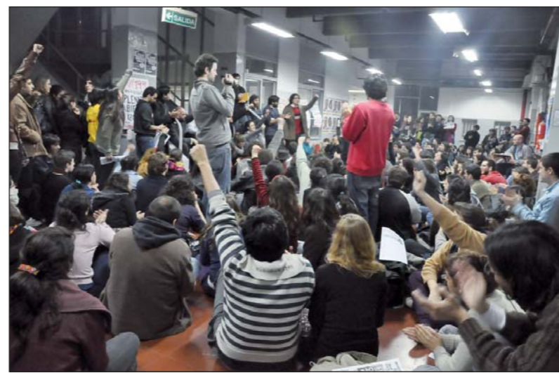
Plenario de Izquierda en Filosof a y Letras. Los luchadores de la UBA se reagrupan con la izquierda.

Dentro de este espacio pol tico, la UJS-PO es la fuerza con m s presidencias (cinco) y consejeros directivos. No se trata solamente de una continuidad con la performance que conseguimos desde 2002. En estas elecciones se desarroll  una pelea estrat gica con el kirchnerismo, luego de la elecci n plebiscitaria obtenida en las 'primarias', y nosotros concurrimos en el marco de los resultados electorales del Frente de Izquierda. Una caracterizaci n peor a n es decir que "no hubo cambios", como si el gobierno fuera la oposici n pol tica y la izquierda el oficialismo. La C mpora fue acicateada por la plana mayor del gobierno y las autoridades de la UBA para presentarse, con recursos cuantiosos, en casi todas las facultades; sin embargo, se quedaron con las manos vac as, no ganaron ning n centro. Los K no tuvieron empacho en aliarse con la "derecha