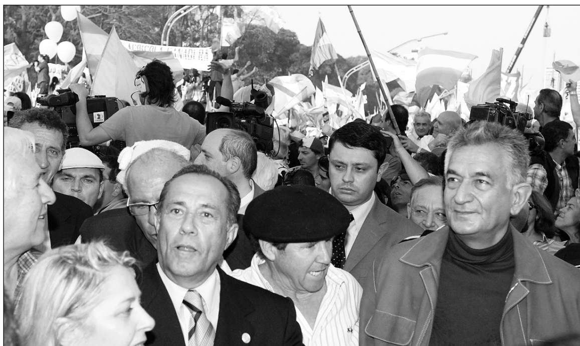
Adolfo y Alberto Rodríguez Saá. En San Luis no se garantiza ni la vivienda, ni el empleo pleno, ni jubilaciones dignas, ni la salud y la educación.

El área municipal que se encarga de los espacios verdes también terceriza las tareas en varias empresas. Alberto Rodríguez Saá