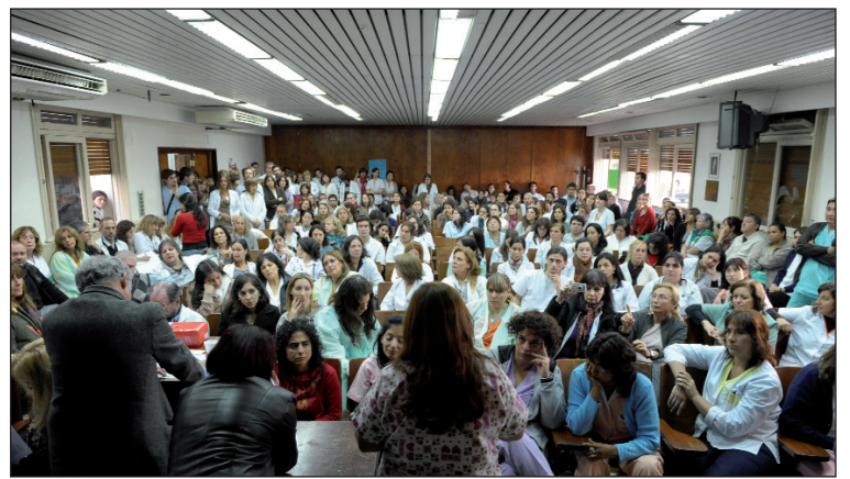
Asamblea en el hospital Gutiérrez. Se viene la interhospitalaria.

Esta sucesión de jornadas de lucha tuvo un avance con la incorporación (al menos en las dos convocatorias) de los hospitales Garrahan y Posadas, lo que sumó a los otros reclamos la reapertura de las paritarias; el pase a planta de becarios, contratados y trabajadores sometidos a la tercerización; la anulación de la "carrera hospitalaria" en el Garrahan -que lesiona la situación salarial y de trabajo de la mayoría- y la efectividad de 650 profesionales precarizados del Posadas. Las organizaciones en lucha de los tres hospitales llamaron a una acción común "en defen-