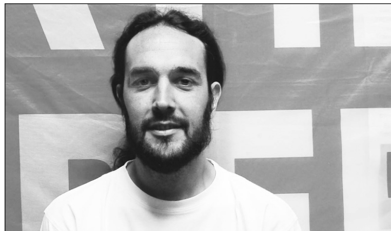
Pablo López, candidato a diputado nacional por el Frente de Izquierda.

Voto ideológico, voto castigo, voto del hastío, cada cual lo justifica a su manera pero entre las opciones cabe preguntar ¿por qué no Pablo?, indudablemente una alternativa que brinda la democracia ante el manoseo borocotizado de candidatos de dudoso pelaje, para