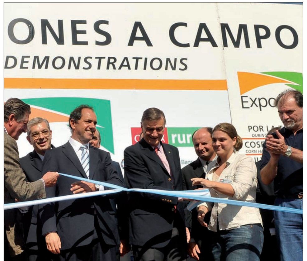
Binner y Scioli, en la inauguración de Expoagro. Progresistas y peronistas preservan la contaminación sojera.

"Mientras los casos de malformaciones, abortos espontáneos, leucemias y otras enfermedades terminales se multiplican y el