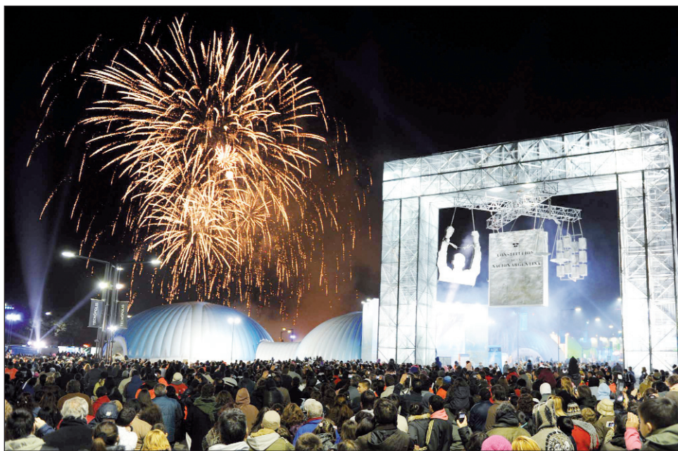
Tecnópolis es una caricatura del viejo cientificismo. Preñada de un neoliberalismo 'tardío', mantiene las privatizaciones de los noventa, la tercerización y precarización del trabajo, la sojización agraria y las políticas sociales 'recomendadas' por el Banco Mundial.

A la ideología "cientificista", en los '70, se la presentó como una ciencia "rebelde" nativa, según la denominación de Oscar Varsavsky, o como la posibilidad de una práctica tecnológica "autónoma" en los planteos de Jorge Sábato o Amíl-