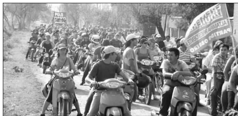
Caravana de cierre de campaña del PO.

los 9.008 obtenidos anteriormente), pero un incremento frente a la última de gobernador (2007), cuando sacamos 2.000 votos. Los números finales esconden una campaña intensa y masiva. Cientos de compañeros recorrieron los barrios casa a casa, las fábricas y los edificios públicos; ganamos las paredes con las pintadas y las pegatinas; recorrimos los medios de comunicación. Hicimos actos masivos, como el acto de cierre con 700 compañeros y 200 motos. En Resistencia sacamos el 2,38%. En el centro obrero de Puerto Tirol