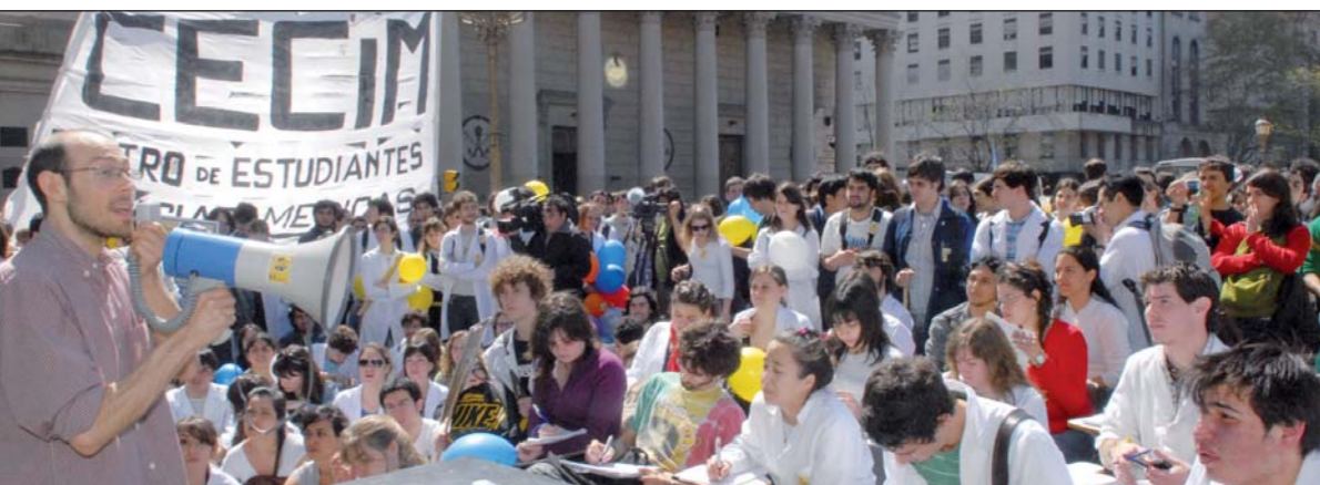
Protesta de estudiantes de Medicina. Los resultados electorales son un contundente aval a la continuidad de una Fuba de izquierda, independiente y de lucha.