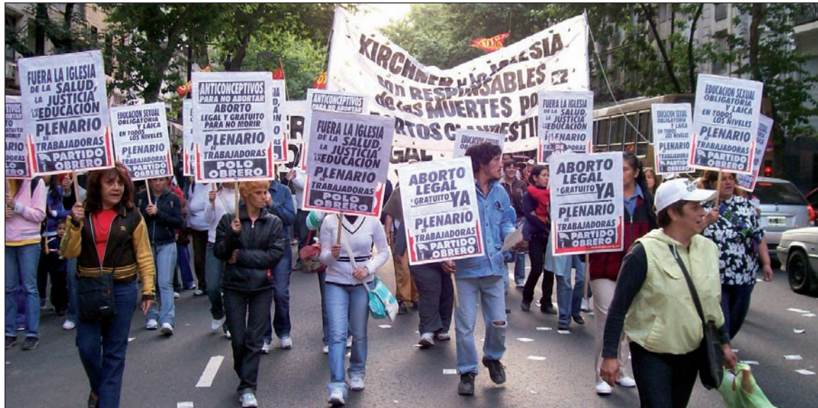
Movilización por el derecho al aborto. El Frente de Izquierda es el único bloque político comprometido con los derechos de la mujer.

-Que no existe un tratamiento del tema del aborto legal en el Congreso ni ahora ni antes, cuando no había elecciones.