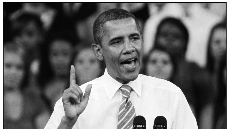
Barak Obama. La exacción impositiva contra la clase obrera y las capas medias explotadas se inscribe en la agenda de la bancarrota capitalista.

En Europa, la iniciativa de "gravar a los ricos" sería, si se aplicara, una "propuesta estética", porque, "al final, si, por ejemplo, hay una subida en el impuesto a la renta de las personas físicas, probablemente iría para todos y perjudicaría más a las rentas medias" ( Público.es ). En España, la bandera de guerra del Partido Popular español es "una gran reforma fiscal" que apunte, justamente, a "ampliar las bases imponibles", para "repartir los costos de salida de la crisis" ( El País , 7/9). Para el PP, la aplicación de mayores impuestos a los ingresos personales (o incluso al