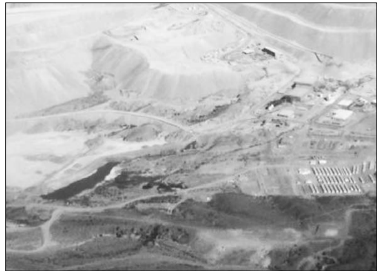
La Alumbreira, en Catamarca, también de los capitales extranjeros. El 'modelo' K es un proyecto entreguista, que reserva para la 'burguesía nacional' las migajas del festín.

También los canadienses están creciendo en la industria nuclear argentina. Hace diez días, Julio de Vido anunció las tareas de remodelación y prolongación de la vida de la central nuclear de Embalse, que incluye contratos con firmas canadienses por más de 400 millones de dólares, las dos Atuchas se hicieron con tecnología alemana