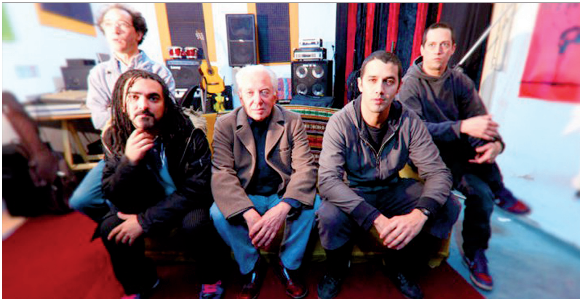
Altamira, durante la campaña, con rockeros del Frente de Izquierda. Los artistas lanzan ahora un reagrupamiento independiente.