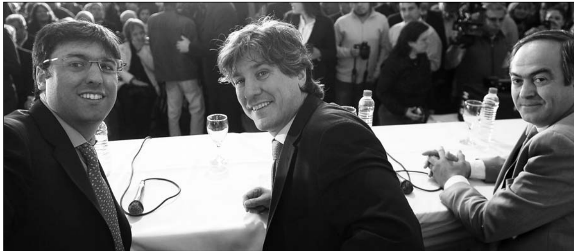
Amado Boudou y Diego Bossio, el titular de la Anses. Entre salario familiar y Fondo de Desempleo, se confiscarán a los trabajadores 6.200 millones de pesos sólo este año.

Se trata de una confiscación deliberada de un componente del