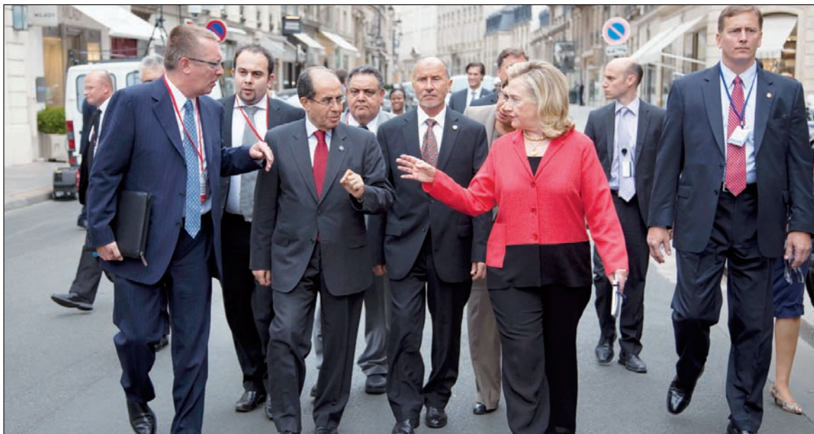
Hillary Clinton junto a miembros del gobierno provisional libio. El imperialismo intenta operar sobre el proceso de la revolución árabe para reforzar sus posiciones en el norte de África y condicionar las rebeliones populares en toda la región.

Con la caída de Trípoli y el derrumbe final de las fuerzas leales a Gaddafi, se ha desatado una auténtica carrera entre las potencias imperialistas, sus cancillerías y sus principales empresas, para asegurarse un lugar privilegiado en la "nueva Libia". Sarkozy organizó hace algunos días, en París, una cumbre de países "Amigos de Libia", la que contó con la presencia de los principales dirigentes del CNT. Al mismo tiempo que se realizaba la cumbre, el diario Liberation difundió una carta, fechada en abril, donde la disidencia acordaba entregar a los franceses el 35% del crudo del país a cambio de su apoyo en la guerra civil en curso. El canciller de Sarkozy "consideró lógico que los países que apoyaron a los rebeldes sean privilegiados a la hora de la reconstrucción" ( Ambito , 2/9). Franco Frattini, ministro del exterior de Italia (país con histórica influencia en Libia), tuvo que salir a aclarar que su país "no disputa una carrera colonialista contra Francia para ver quién llega primero a Libia". El Departamento de Estado norteamericano, por su parte, consideró necesario "salir al paso de la impresión creada de que Francia y Reino Unido han sido los auténticos artífices" de la operación en Libia. China ha quedado mal parada en el nuevo realineamiento de las potencias, particularmente luego de que trascendiera que inició negociaciones para vender armas a Gaddafi en julio pasado -es decir en plena guerra civil: Beijing mantiene frena-