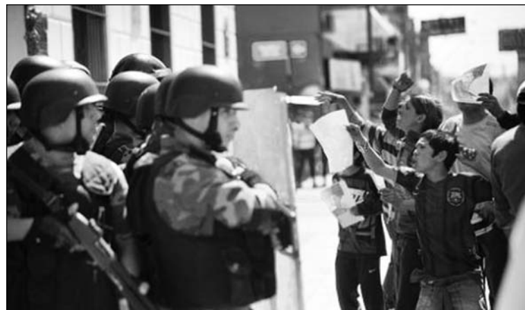
Protesta frente a la Alcaldía. La persecución policial contra los jóvenes es moneda corriente.

Los funcionarios del Frente Cívico y sus "opositores" K han ofrecido asistencia a los familiares. Quieren cooptarlos con dinero para silenciarlos. Unos y otros sostienen un régimen carcelario que, como ocurre en la Alcaldía, no tiene un sistema de seguridad contra incendio que se active por la presencia de humo. Tampoco sabían que