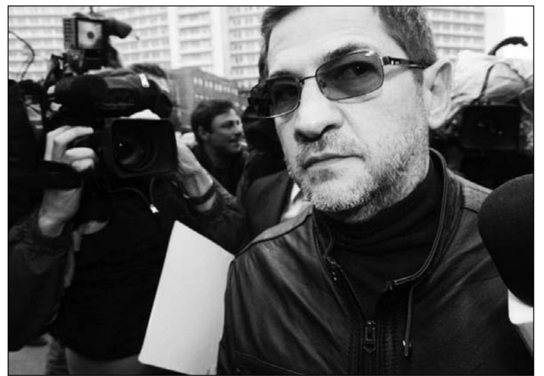
Schoklender. La cooptación del Estado transformó a Madres en una empresa corrompida.

Las denuncias de Schoklender, sin embargo, sólo remueven porquerías conocidas. La primera, que el gobierno nacional envió 765 millones de dólares a las Madres de Plaza de Mayo para construir viviendas y centros de salud. Ese dinero, en gran parte, fue desviado, malversado, robado, sin que el Ministerio de Planificación -responsable