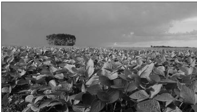
Campo de soja en la pampa húmeda. La presidenta ahora es una impulsora directa del "poroto"...

Esas tierras, en general, están pagadas a precios de remate y en zonas reclamadas por comunidades originarias y campesinas. Se estima -aunque los cálculos difieren significativamente- que la cantidad de tierras en manos extranjeras es del 10% del territorio -la mitad de lo que autoriza la propuesta que llegó al Congreso. El proyecto, por otro lado, excluye de la norma a los extranjeros que se asocien a capitales nacionales hasta un 49% del capital. Se trata apenas de una formalidad, pues bastaría que el capital extranjero financie con créditos el desarrollo del