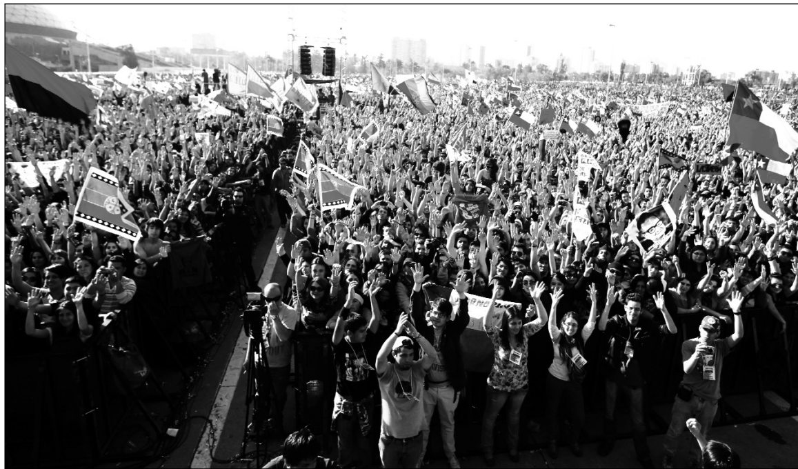
Por la educación pública y gratuita. Un proceso de movilización extraordinario, que ha desatado una enorme crisis.

Como resultado del levantamiento estudiantil en épocas de Bachelet, se amplió el acceso a préstamos bancarios por medio del