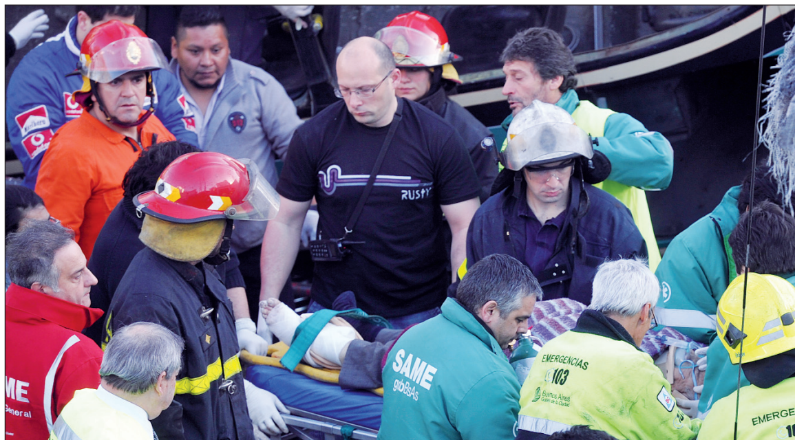
La concesionaria y el gobierno, responsables. Los Kirchner y Macri han privilegiado en la Ciudad las obras con fines inmobiliarios y expulsivos, y postergado indefinidamente las obras necesarias para evitar la tragedia.

No está de más recordar que la gestión del ferrocarril, pero principalmente los órganos estatales a cargo de "seguir" las obras de mantenimiento y las inversiones, continúan en manos de agentes directos de José Pedraza. O sea, la burocracia sindical que hace negocios con los privatizadores ferroviarios.