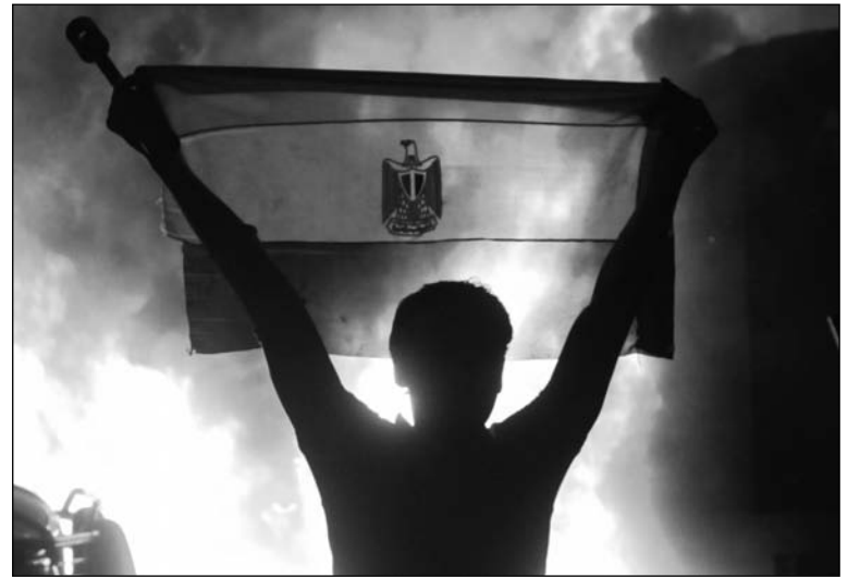
Otra pueblada. El colapso del gobierno marca el fracaso de la "transición ordenada".

Los militares egipcios decidieron restablecer el estado de excepción, lo que habilita el regreso "legal" de las detenciones arbitrarias, los juicios militares a civiles, etc. De cualquier manera, este siste-