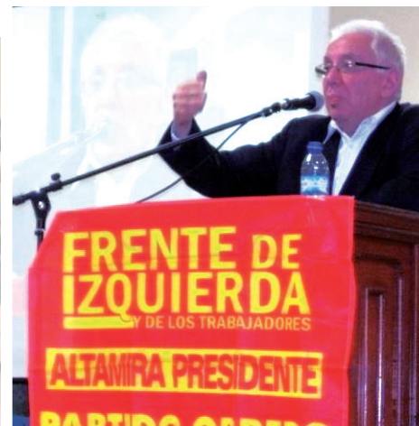
Altamira en el salón de conferencias de ATE. El voto debe desarrollar una oposición de izquierda y cambiar el mapa político del país.

La gira de Jorge se manifestó en numerosas entrevistas ra-