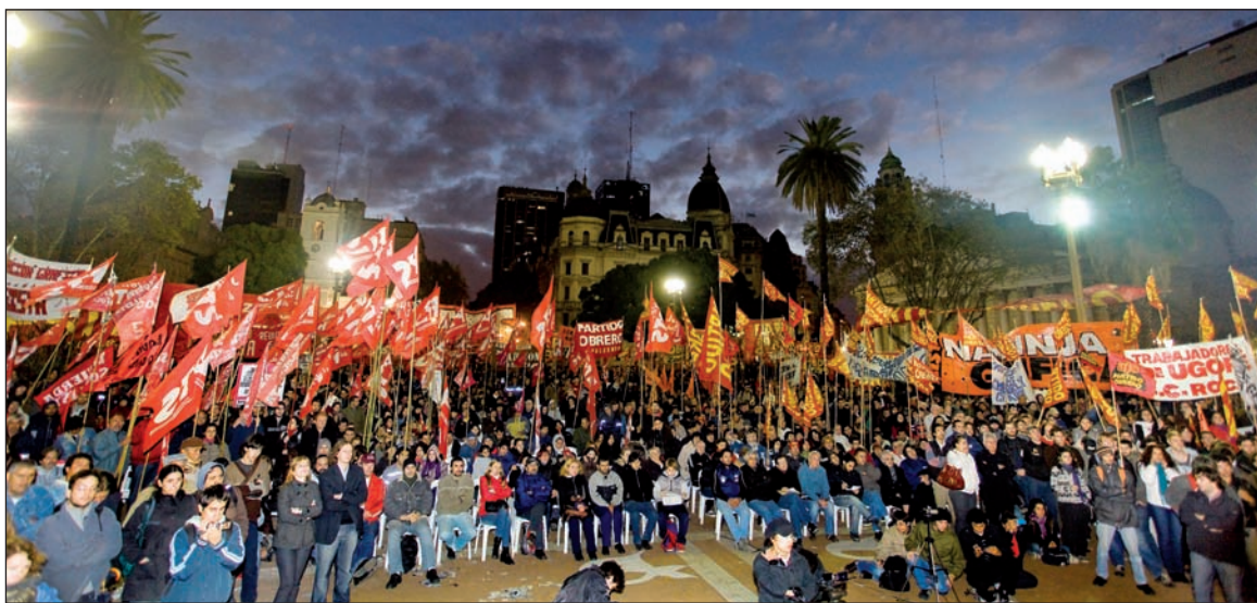
Acto del Frente de Izquierda, el Primero de Mayo.

En la Argentina donde la plata de jubilados y trabajadores sostiene a especuladores y hasta multinacionales, el Frente de Izquierda plantea que la Anses sea colocada bajo control de trabajadores y jubilados, para asegurar el pago del 82% móvil.