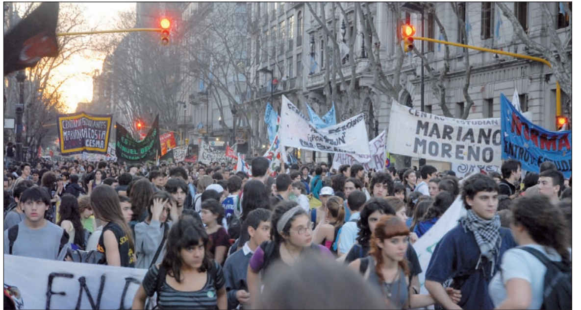
Movilización de los secundarios durante las tomas de colegios del año pasado.

Entre las resoluciones más importantes del Congreso, se