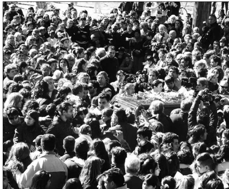
La carátula de la causa es un campo de batalla político. Nadie está interesado en resolver el caso sino en salvar la propia ropa, por una Comisión investigadora independiente.