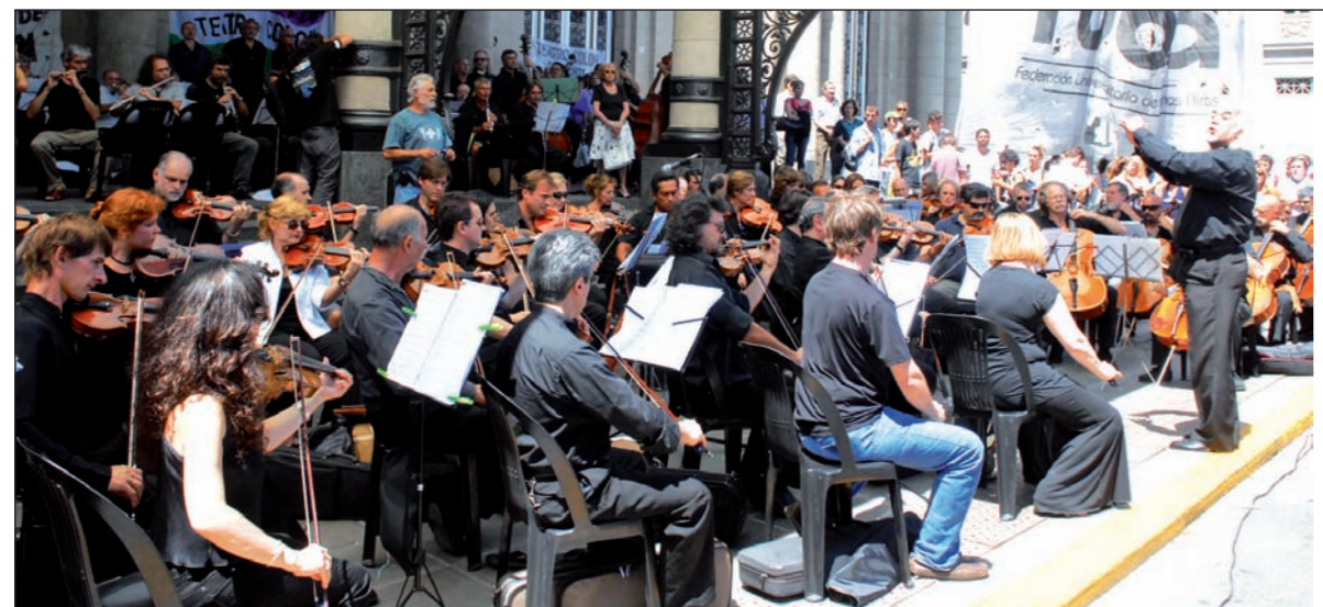
Protesta de trabajadores del Teatro Colón. El inicio de una gran campaña contra el ataque a los derechos sindicales.

Más de 1.000 compañeros se movilizaron frente al teatro