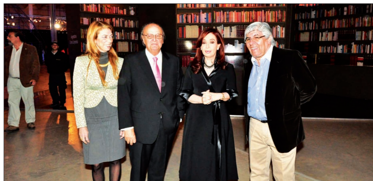
Cristina Kirchner, la secretaria de Industria Débora Giorgi, el presidente de la UIA Ignacio de Mendiguren y Hugo Moyano.

Otra fábrica que está en lucha, en este caso por reincorporación de delegados y activistas, es Sertech, tercerizada de limpieza en Siderar. Allí, los compañeros también comenzaron con el reclamo de terminar con la tercerización. La patronal de Techint aprovechó el fin del contrato de la tercerizada para despedir a todos los trabajadores. Lo llamativo del caso es que Sertech opera como tercerizada en todas las Siderar y en la única que no renovó el contrato es en Haedo, donde los delegados son opositores a la comisión directiva del gremio. La nueva empresa tomó a once de los trabajadores despedidos, pero dejó afuera a los delegados y activistas. El gremio y la burocracia de la interna de Siderar se encargaron de prove-