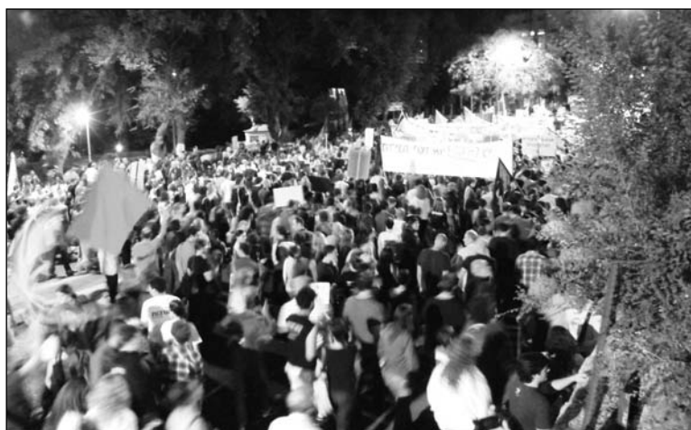
"Indignados" israelíes, una movilización callejera sin precedentes.

Por abajo, sin embargo, el fuego no hacía más que avivarse. Por un lado, el acuerdo que el gobierno 'festejó' con la burocracia de la Asociación de los médicos fue agitado por éstos: esa burocracia levantó una larga huelga arrancando concesiones para ciertos sectores. Pero la masa de los residentes no recibió nada, por lo que entonces relanzó la huelga con más fuerza: el sistema de salud está paralizado desde antes del inicio de la ola de las carpas juveniles diseminadas por todo el país.