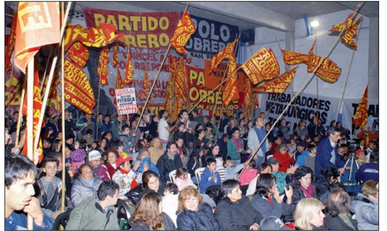
Acto en la zona norte del Gran Buenos Aires.