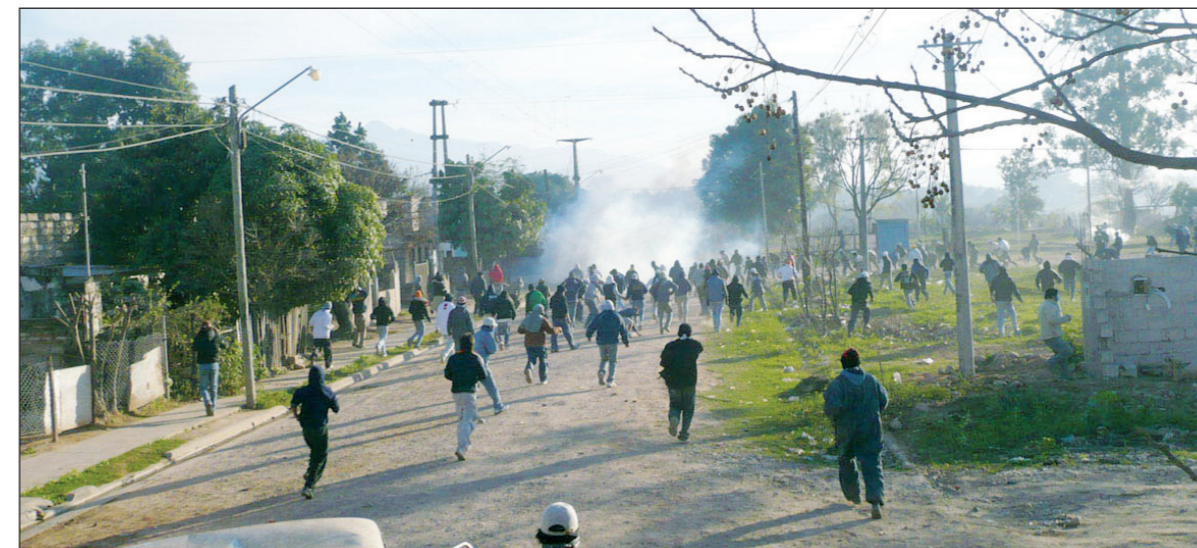
Escenas de la represión. La acción contra el pueblo de Jujuy, para proteger los intereses de Blaquier, lleva agua al reclamo de 'orden' de la derecha y opera como un factor poderoso de desmoralización de los sectores populares que han confiado en la demagogia oficial.

La renuncia del ministro La Villa, acatada por orden de CFK para restar costo político, expresa la crisis de un gobierno adicto a las políticas que, como en Santa Cruz, defienden a muerte al poder económico. El recambio de funcionarios no representa ni el principio de justicia que merecen tantas víc-