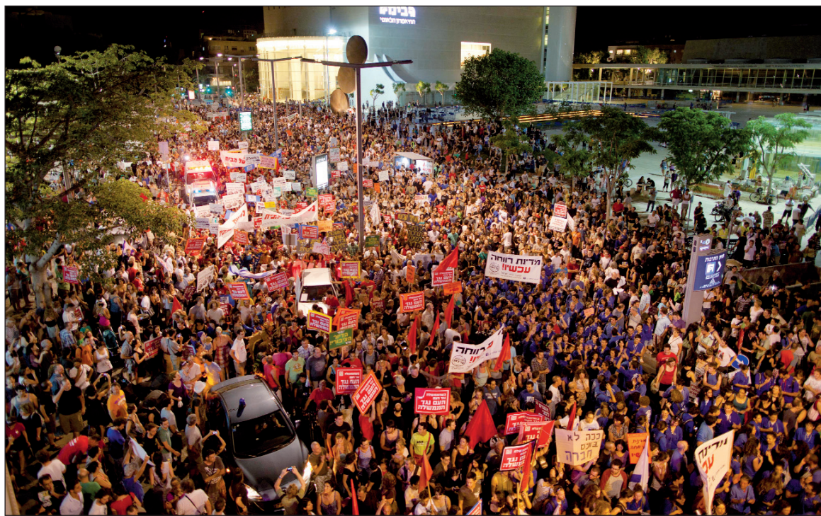
Indignados israelíes. Un levantamiento antigubernamental sin precedentes.

Este movimiento se inició escasos veinte días atrás, con la instalación de un campamento juvenil en Tel Aviv contra los altos alquileres y la imposibilidad de acceso a la vivienda. En pocos días, los "acampes" se expandieron por todas las ciudades de Israel. Una vasta movilización popular en todo el país acompañó a los jóvenes y sumó los reclamos de otras capas oprimidas, con eje en el deterioro salarial y los altos costos de vida. Es claro que en el activismo del movimiento no se advierte ilusión alguna en los partidos del régimen; pero incluso el derechista Kadima, de la ex premier Litvi y otros como el religioso Shas -con raíces en sectores muy humildes, se han visto obligados a coquetear con las demandas populares. Por esto, "en algunas localidades las autoridades municipales apoyaron la protesta de los acampantes, incluso contribuyeron con la provisión de agua corriente y electri-