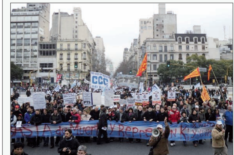
Movilización en Buenos Aires, en repudio a la represión. Los K, ausentes.

seguir la misma política que se aplicó en el conflicto del Parque Indoamericano, cuando -diciendo "en un trabajo conjunto, el Ministerio de Desarrollo Social y el de Seguridad, trabajaron mancomunadamente para resolver la situación de precariedad en que vivían las familias que ocuparon esos terrenos". No hace falta ser "Funes el memorioso" para concluir que se trata de un verso grande como una casa. En el Parque Indoamericano la Policía Federal, que responde al gobierno nacional, y la Metropolitana, a Macri, reprimieron salvajemente produciendo muertos y heridos. Cuando la represión no arrojó los resultados buscados, las fuerzas represivas armaron una zona liberada para que los ocupantes fueran hostigados por grupos de vecinos movilizados por punteros de derecha. Finalmente, el gobierno nacional y el de la Ciudad amenazaron a las familias que ocupaban las tierras del parque con ser sancionados con la quita de cualquier plan social. El plan de viviendas prometido, que debía "resolver la situación de precariedad que vivían las familias que ocupaba esos terrenos", nunca pasó de los papeles. Ahora sabemos que el presupuesto de viviendas se invertía en aviones y barcos de la banda K de Shocklender. La política que adoptó el kirchnerismo en el Indoamericano fortaleció especialmente al macrismo, que se ganó