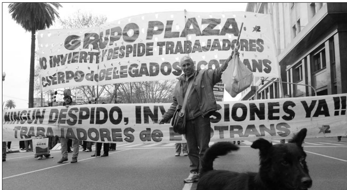
Movilización del cuerpo de delegados de Ecotrans (grupo Plaza), en 2008. La concentración empresaria del transporte público se sostiene con un festival de subsidios y la precariedad laboral.