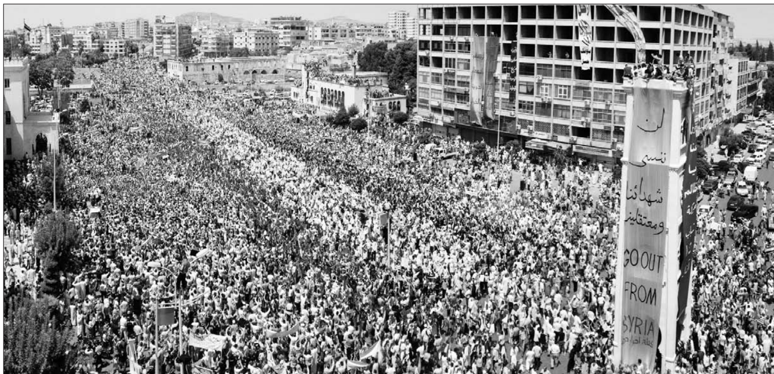
La llave de todo el proceso. La magnitud de las movilizaciones, al igual que su extensión, se han ido acrecentado con el correr de los meses.

La última oleada represiva produjo la condena del imperialismo yanqui y europeo, los que mantienen una presión creciente sobre el régimen sirio mediante la aplicación de sanciones económicas al gobierno, con el reclamo de un período de apertura y reformas políticas. En este cuadro, el imperialismo impulsó la reunión de algunas figuras opositoras a Al Assad en Estambul, que abrieron la puerta a "un diálogo nacional". A pesar de coquetear con esta idea desde el inicio del levantamiento popular, Al Assad