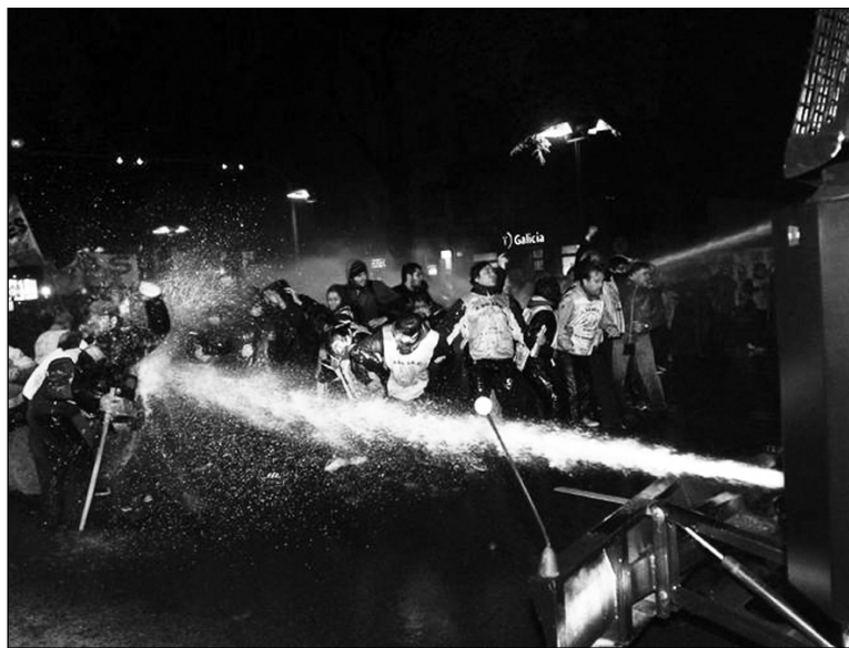
Represión a los docentes de Santa Cruz, frente al ministerio de Trabajo de la Nación. Tomada siguió la orden presidencial de atacar las huelgas, frente al escenario de incorformismo y belicoidad obrera.

Es decir que a pesar de exceder los topes de Moyano y Cristina (24% entre puntas, pero 20% promedio) -en más de 1,5 millón de