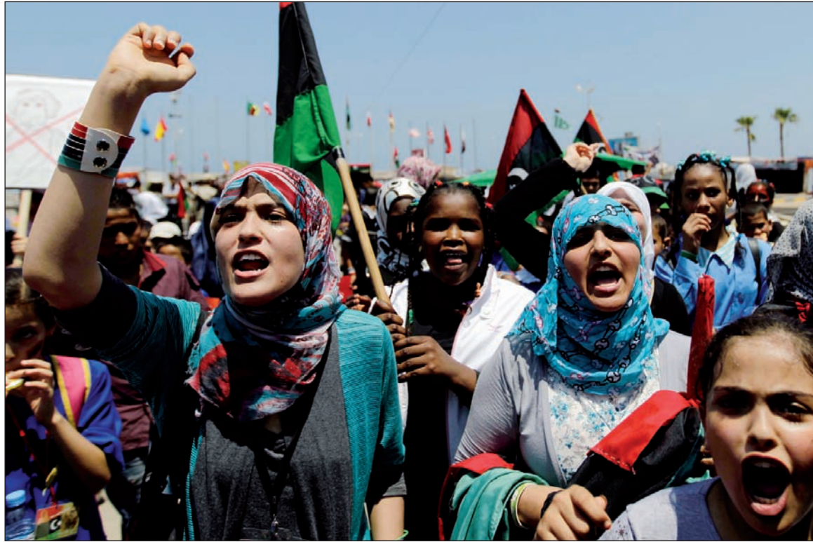
Movilizaciones en Libia. La crisis de la agresión militar se ha convertido en un factor revulsivo de la crisis política en las metrópolis y revela con crudeza que vivimos en un tiempo de bancarrotas, revoluciones y guerras imperialistas

La crisis de la agresión militar se ha convertido en un factor revulsivo de la crisis política en las metrópolis. El caso más destacado es el italiano, ex poten-