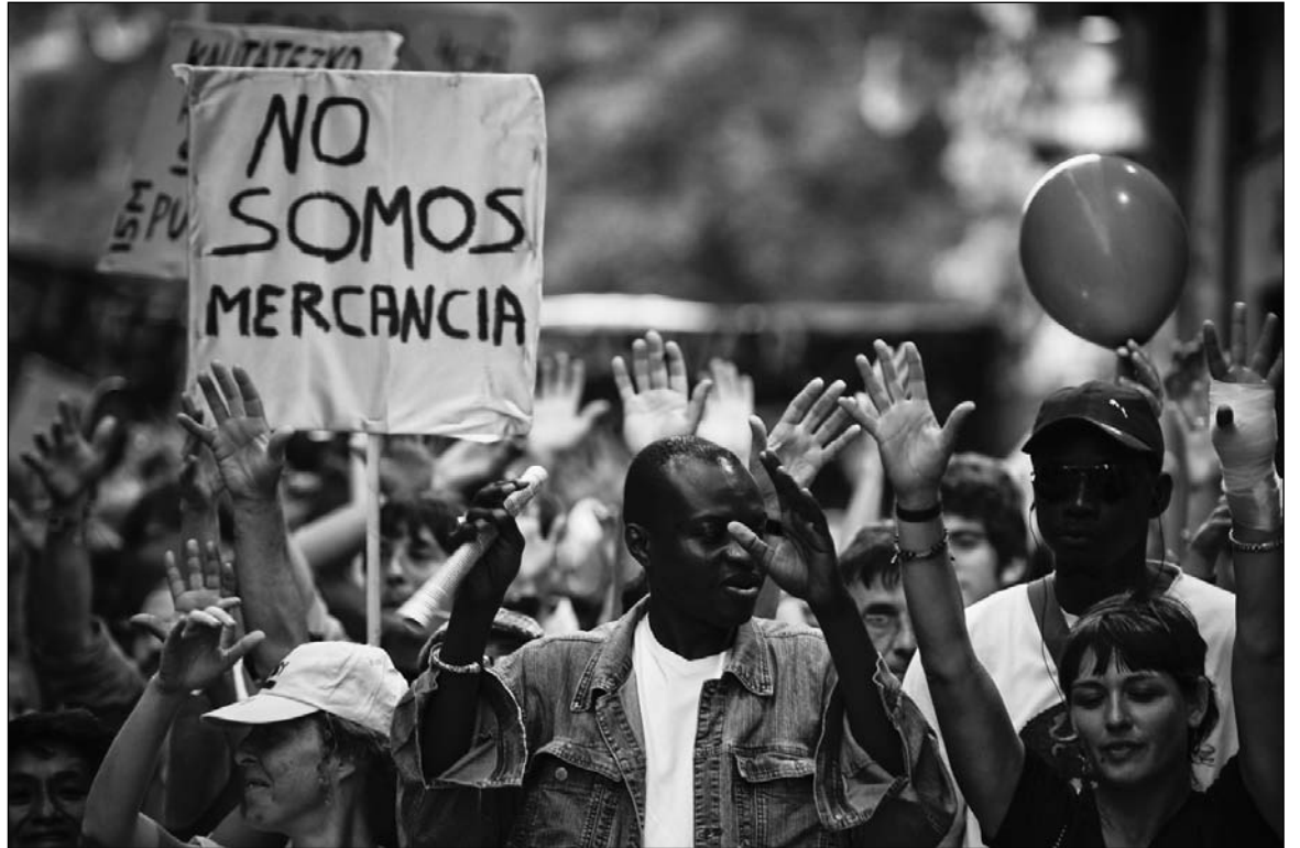
Movilización de “indignados”. Con todos sus errores e ingenuidades, el mensaje del movimiento del 15M ataca la esencia de una democracia formal cada vez más desprestigiada y que hace agua por todas partes.

La respuesta formal no tiene nada que ver con la real. Los trabajadores y las clases populares no son masoquistas. Los medios de comunicación, al servicio del gran capital, nos machacan diariamente con el mensaje de que lo que se está haciendo es el único camino que existe, mientras silencian o marginan a las voces discrepantes. El miedo al “yo o el diluvio” es el mensaje subliminal que subordina y vuelve dóciles las conciencias. La mayoría de los que votaron a los partidos del sistema desconocían sus programas y, lo que es más grave, desconocían sus programas reales. Muchos votaron a unos para castigar a los otros, sin darse cuenta de que su voto iba a parar al mismo sitio: legitimar los intereses del capital. Otros, asqueados, se sumaron a la abstención, al voto en blanco o al voto nulo, opciones que no parecen importarle a nadie. El sistema nos ha acostumbrado a que parezca normal que la mitad de la población no vote o que no sepa las consecuencias de lo que vota. Una vez depositado el voto en la urna sólo resta esperar,