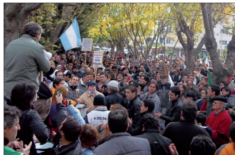
Una imagen de la heroica lucha de los santacruceños. Aunque la huelga no logró quebrar los toques salariales del gobierno, desató la energía de lucha y desarrolló una experiencia política pocas veces vista en miles de maestros y profesores.

El gobierno nacional presionaba a Peralta en ese mismo sentido y su hostilidad a los maestros de Santa Cruz se reveló brutalmente en la represión a la carpa montada frente al Ministerio de Trabajo, el 23 de junio. La interna justicialista competía en verificar cuál de los bandos aparecía como el más "bravo" contra la huelga.