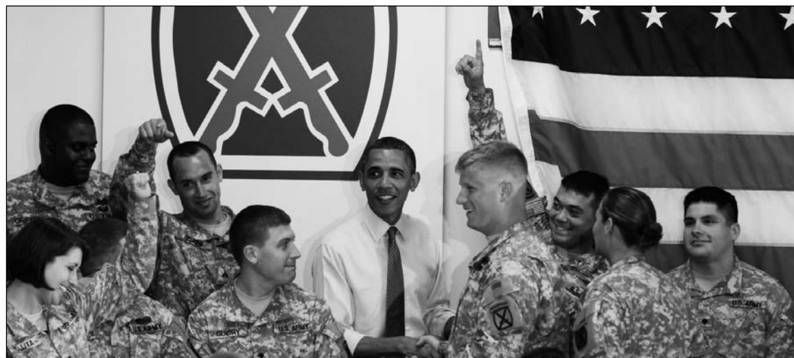
Una medida vinculada con la crisis económica. El vacío de poder amenaza a toda la región.

El anuncio de parte de Barack Obama de que retirará decenas de miles de soldados norteamericanos de Afganistán en los próximos dos años, fue caracterizado por parte de la prensa internacional como el 'fin de la guerra contra el terror' e incluso como el cierre de 'las guerras de Bush'. Una mirada atenta, no obstante, permite advertir que el repliegue de tropas consistirá en retirar a unas diez mil este año, a las que se sumarán 23 mil en 2012, pero que permanecerán en Afganistán más de 60 mil soldados norteamericanos al menos hasta 2014. La realidad es que la de Obama es una medida de crisis, que todos los analistas vinculan con la crisis económica, la principal inquietud del electorado norteamericano con vistas a las elecciones presidenciales del próximo año. Un solo dato es ilustrativo: por primera vez desde la guerra de Vietnam, una reunión de alcaldes de todo el país se pronunció acerca de cuestiones de política internacional cuando reclamó que se deben utilizar los recursos que el Pentágono gasta en Medio Oriente y Asia Central para la reconstrucción económica de un país atravesado por la bancarrota capitalista.