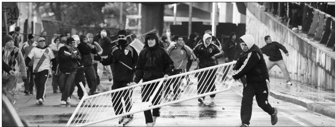
Una caída anunciada, pero no sólo de River. Las estafas de los dirigentes, la descomposición y violencia de las barras creadas por ellos y el manejo del fútbol como instrumento político patronal han derrumbado a un equipo centenario y a todo el fútbol local.

Los 28 millones de pesos que River recibía de la televisión en directo de sus partidos pasarán a ser cuatro. Posiblemente obtenga algo adicional, pues el gobierno ya sacó la cuenta de que podrá, desde agosto, profundizar su propaganda política en TV, aplicando el mismo sistema que en la primera división. Tendremos, entonces,