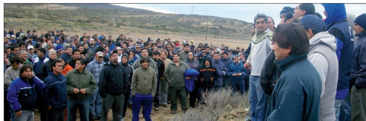
Asamblea petrolera. La huelga de los petroleros de las Heras lleva más de quince días.

La huelga general de los petroleros de las Heras lleva más de 15 días. Los trabajadores de Transporte Figueroa siguen sin cobrar, al igual que decenas de trabajadores de Oil, Oleosur, Romero, San Antonio y otras diez. Algunos trabajadores llevan tres meses sin cobrar su salario y todavía hay empresas que deben el reactivio, la vianda y siguen sin dar respuesta a la continuidad del trabajo, como Huinoil y Quintana Wellpro. En la última semana, la situación de los trabajadores de las empresas en conflicto se agravó, porque las patronales empezaron a enviar telegramas de suspensión y despidos, así como intimaciones para presentarse a trabajar.