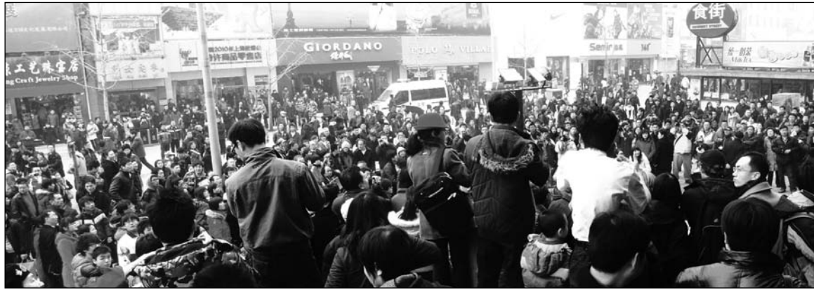
Manifestación callejera en China. Los estallidos incluyen la reacción contra la explotación laboral, la represión, las expulsiones de los campesinos y la contaminación descomunal; es decir, contra las consecuencias de la restauración del capital vista como la única posibilidad de salida a la crisis mundial.

La golpiza policial a una vendedora ambulante embarazada, de sólo 20 años de edad, en la región de Zengcheng, desató una rebelión popular en China. Las manifestaciones callejeras, que chocaron duramente con las fuerzas policiales, en algunos casos llegaron a controlar barrios enteros durante días. El Ejército debió ingresar con tanquetas y miles de agentes antidisturbios para controlar la situación. La joven golpeada es un caso testigo de los millones de campesinos migrantes que van a las ciudades en busca de trabajo. La "fábrica del mundo" ha creado un cuadro de descontento social de intensa magnitud. "Los trabajadores rurales migrantes son marginalizados en las ciudades, tratados meramente como mano de obra barata, no son absorbidos por las ciudades sino que, peor aún, son discriminados y atacados", señaló un estudio del Consejo Estatal del Centro de Desarrollo e Investigación. "Si no es manejada correctamente, la situación creará una mayor amenaza de desestabilización", agregó el informe.