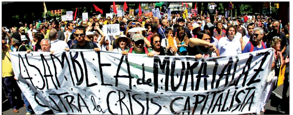
Una de las tantas movilizaciones en el Estado español. Los primeros síntomas de la revolución son las huelgas, las manifestaciones, las luchas desesperadas y la aparición en masa de los Indignados.