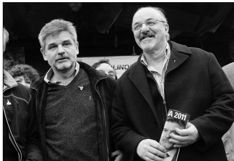
Más que una carta, los intelectos K han parido otro buzón. El “derecho a la Ciudad” exige una orientación social transformadora y no el plato recalentado de Filmus-Tomada.

Mientras la nueva “Carta Abierta” abogaba “contra la privatización de la costa del río”, su gobierno reprimía a quienes manifestaban contra el Vial Costero -la expresión más burda de esa priva-