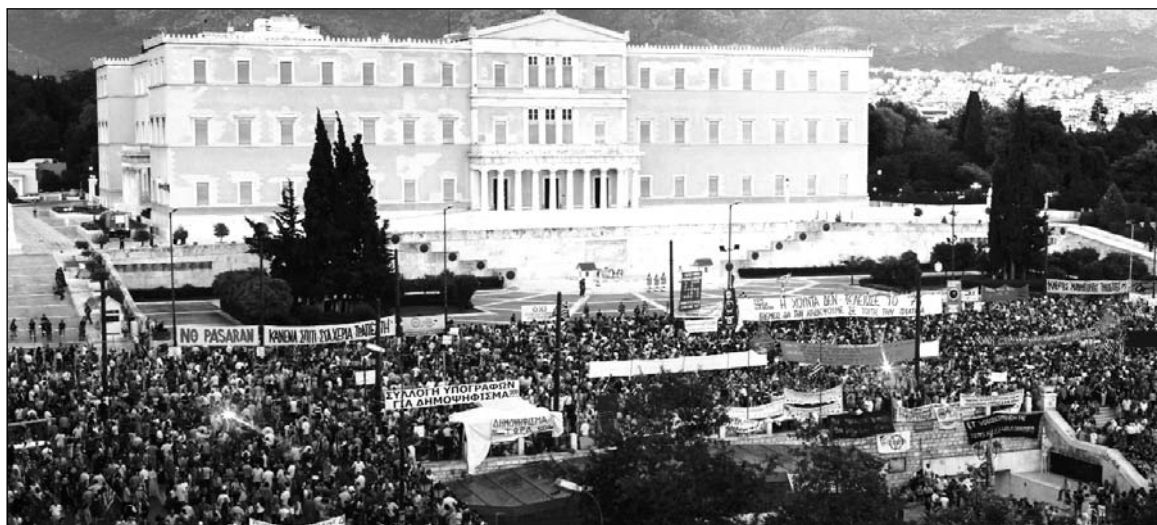
Trabajadores griegos protestan contra los "planes de austeridad". El 'default' virtual de Grecia es la expresión de una bancarrota que se encuentra más allá de sus fronteras, y ésta la expresión de un límite histórico del conjunto del capital mundial.

La deuda pública de Grecia, Irlanda y Portugal en poder de los bancos alemanes apenas supera los 25 mil millones de euros, una migaja para un sistema con activos por 25 billones de esa moneda; los bancos franceses tienen en cartera unos 30 mil millones; el resto de Europa y Estados Unidos, muy poco. El asunto cambia de aspecto cuando se observa que esos bancos alemanes tienen acreencias por 140 mil millones de euros sobre bancos y compañías privadas de esos países, y nada menos que otros 100 mil millones de dólares en títulos y bonos que protegen las inversiones realizadas (derivados). O sea que la deuda pública de esos tres países no afecta, al menos directamente, a los bancos acreedores, pues representa apenas el 8% del total de lo que les de-