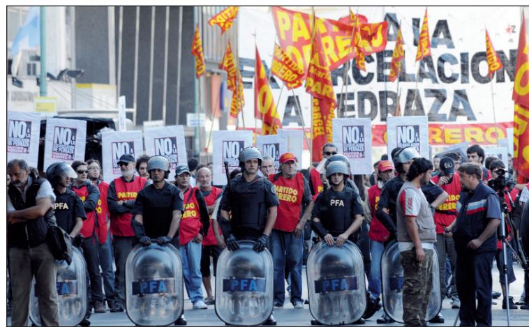
La Policía Federal no está en el banquillo de los acusados. Quieren encubrir la responsabilidad política del gobierno K.

La experiencia histórica es que el desmembramiento de las responsabilidades termina con la impunidad. Así lo fue en la