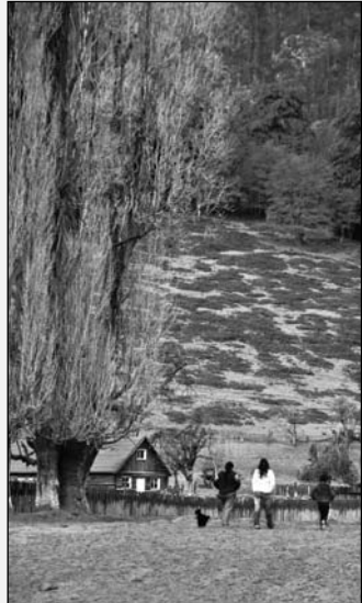
Lluvia de cenizas. La acción solidaria de la población, realizando colectas y ofreciendo su ayuda a los más necesitados, contrasta con la escasa o nula acción social del Estado.

Sapag anuncia con bombos y platillos que ha enviado un millón de pesos y Nación ha comprometido 5 millones, para lim-