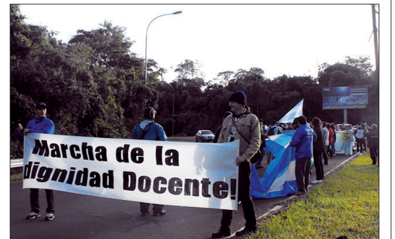
Misiones es Santa Cruz. Continúa la lucha de la docencia.