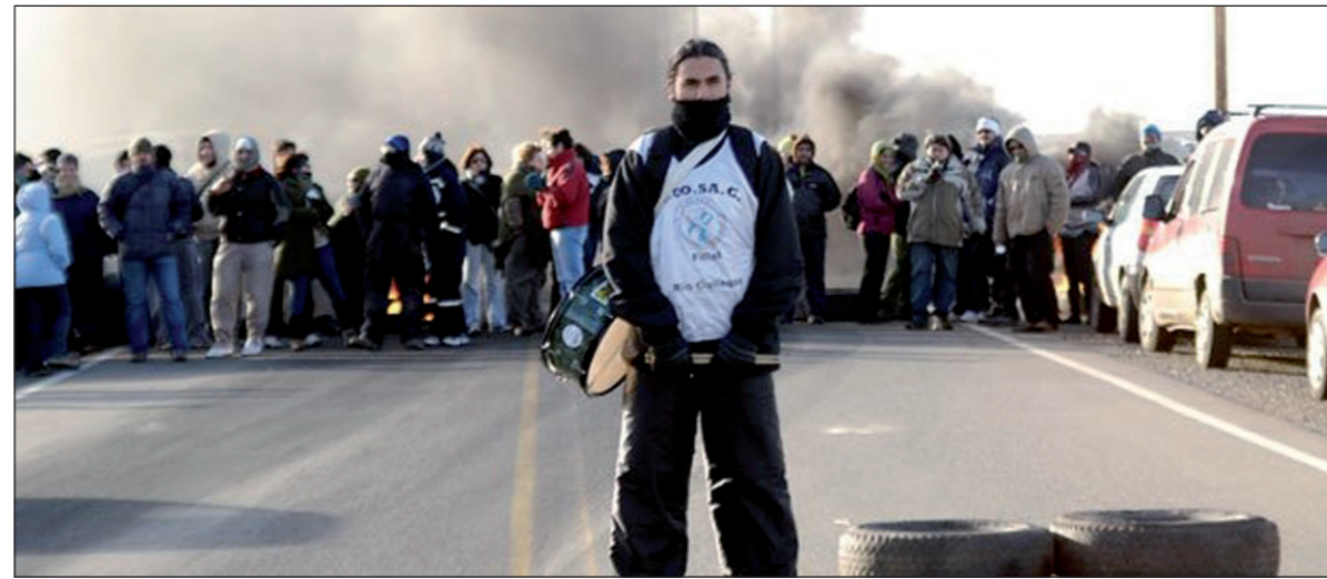
Piquete docente, el gobernador Peralta sigue atizando el fuego. Se trata de avanzar en medidas de lucha conjuntas, basadas en la organización de cada sector y en la mayor comprensión de que es una lucha común contra un gobierno enemigo de los intereses populares.

Se amplía el movimiento popular a favor de los huelguistas