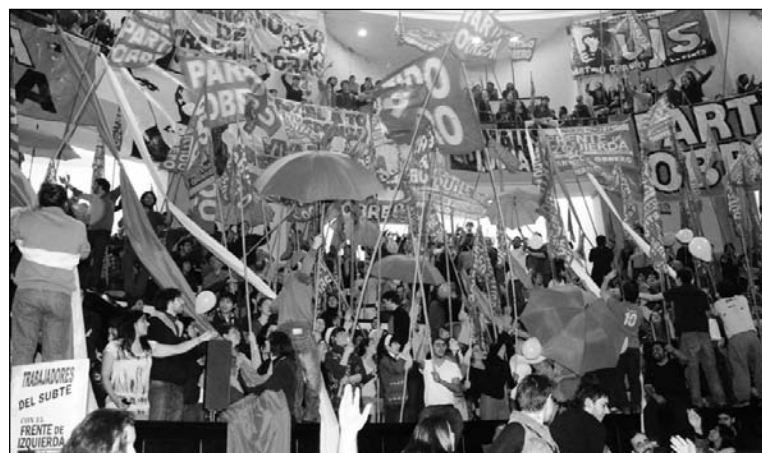
Masivo acto de la juventud militante. El frente único formado por la izquierda revolucionaria es un instrumento y un método para la conquista paciente, tenaz y sistemática de los luchadores y de las masas, las únicas capaces de llevar adelante una transformación social.

Los discursos del acto pueden verse en po.org.ar/po-multimedia