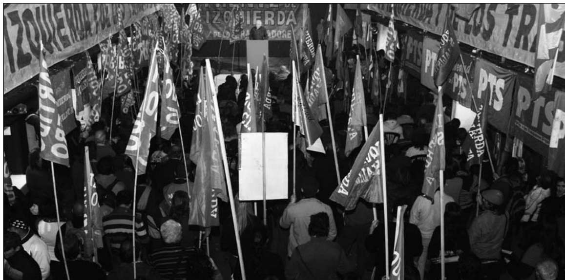
Más de mil personas en el acto cordobés. La lucha electoral es una oportunidad para una confrontación programática de conjunto con los partidos de la burguesía y de la pequeña burguesía, y para elevar a los trabajadores a una conciencia de clase por medio de la propaganda.

Hubo importantes delegaciones obreras: de la UTA, de municipales, de docentes, de trabajadores de la salud, de metalmeccánicos, de docentes universitarios, de los calls centers (en medio de la lucha contra los despidos), de empleados públicos, etcétera. En