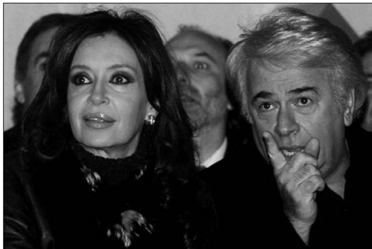
Cristina Kirchner y el candidato peronista Juan Manuel De la Sota, ahora peleados. La pelea entre los K y el PJ cordobés va más allá de la lucha por los cargos.

Los intendentes de Villa María y de Leones, ultra K que sonaban para la vicegubernación, decidieron ir por la reelección en sus municipios y negaron la posibilidad de presentar una lista K propia (la llamada 4ª lista). Tampoco retiraron a sus punteros de las listas de Unión por Córdoba. El 18 de junio, cuando debían presentarse las candidaturas, se verá si el Partido de la Victoria presenta sus propios candidatos contra De la Sota. Por su lado, los "kirchneristas no peronistas" también terminaron partiéndose: el PC armó un frente con el partido de Heller y el sabbatellismo local, y el PH una alianza con un parti-