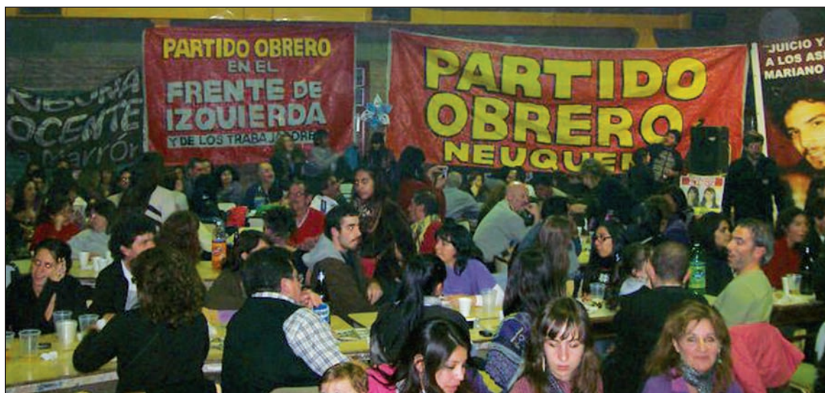
Peña docente durante la campaña electoral. Los resultados reflejan la evolución política de los trabajadores de Neuquén.

En el curso de los últimos cuatro años, la izquierda revolucionaria progresó sistemáticamente. Los resultados de las legislativas nacionales de 2009, que se produjeron en el punto más alto de la crisis mundial en el país (500 mil despidos, miles de suspensiones) fueron un anticipo de esta gran elección. En aquella oportunidad, el Partido Obrero obtuvo 6.920 votos (2,59%) y el Frente PTS-IS-MAS, 5.148 (1,93%) -sumados, 12.068 votos (4,52%).