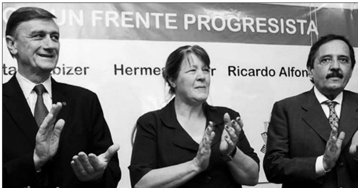
Binner, Stolbizer y Alfonsín. La ruptura de los opositores y la formación de un 'frente progresista' obligará al Frente de Izquierda a enfrentar una nueva polarización política y la necesidad de un mayor rigor en la campaña electoral para explotar todos los esquinazos de la crisis.

Si la nueva alianza es funcional a los intereses electorales del gobierno, como insinúa Clarín , estaría expresando una división del trabajo entre 'progres', por un lado, y 'nacionales y populares', por el otro -los primeros en el gobierno de dos provincias y aventurando en la Ciudad, quienes colaborarían con el gobierno nacional. El proceso electoral sería el prólogo de una nueva maniobra del kirchnerismo (otra más), cuya consecuencia sería acentuar la crisis en el pejetismo y con la burocracia sindical. Si la crisis interna del oficialismo erosiona el potencial electoral de CFK, el nuevo frente de Binner debería pactar un acuerdo con el por ahora repudiado Alfonsín. Las opciones están abiertas en el caso de que el PS y Juez avancen en sus distritos y De Narváez se quede con la provincia de Buenos Aires y Macri con la Ciudad. Gobernar desde la Rosada con los cuatro principales distritos bajo la batuta de una oposición, por dividida que esté, sería como recorrer el último tramo de la aventura que comenzó en 2003. Adónde irán a parar, en