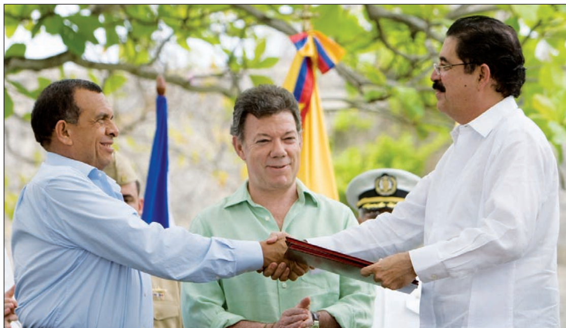
El depuesto Manuel Zelaya saluda al presidente de Honduras Porfirio Lobo, ante la mirada del colombiano Santos.

La vuelta de Zelaya satisface además la necesidad de Honduras de adquirir petróleo más barato por medio de la chavista Petrocaribe. "Como diputados nos sentimos ale-