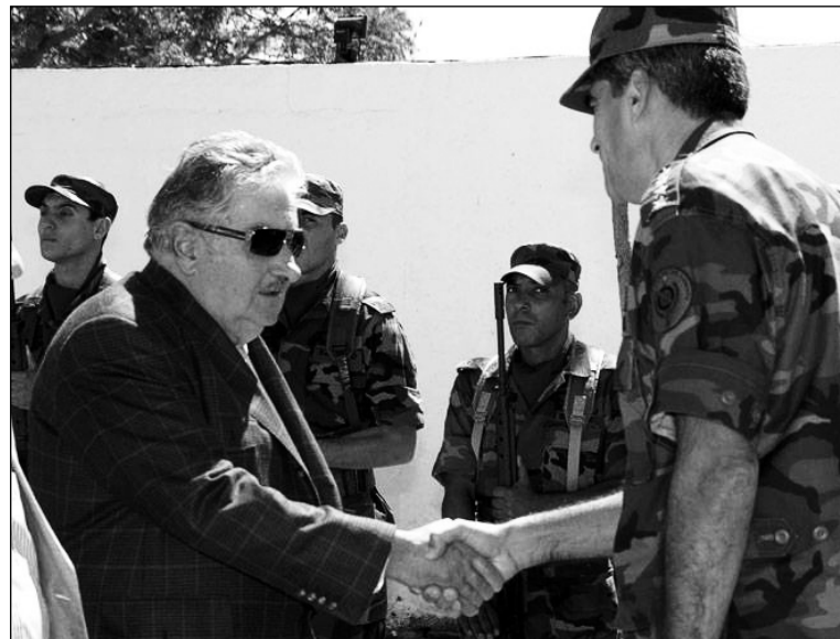
José Mujica, presidente uruguayo. Quedaron en evidencia los pactos políticos que el gobierno tiene con los militares.

Quiere decir que la unidad no está limitada por el programa, sino el programa por la 'unidad', o