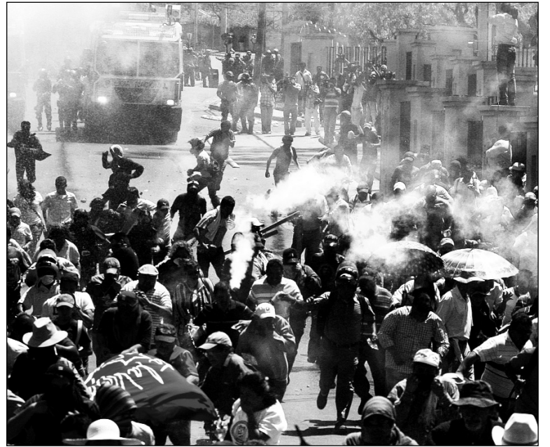
Movilización hondureña reprimida. hace dos meses.

ro ¿bajo qué democracia? Hay que tener mucho cuidado.