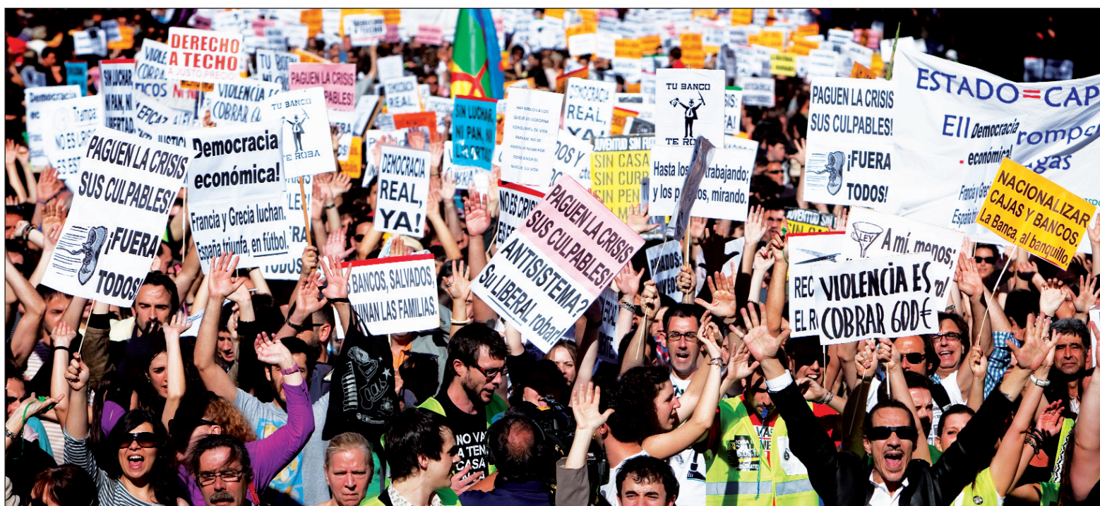
"Paguén la crisis sus culpables". Las manifestaciones son la primera respuesta masiva a la bancarrota capitalista, la iniciativa política ha pasado a los explotados.

Lo que viene ocurriendo, sin embargo, no es una novedad, sino una reposición. En 2004, también