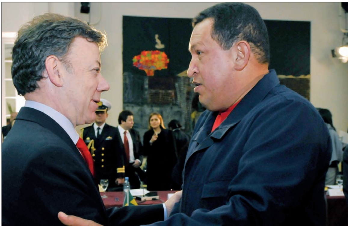
Juan Manuel Santos y Hugo Chávez. El venezolano convirtió a la "unidad" de América Latina en un acuerdo con la oligarquía y el paramilitarismo.

Radio Nacional de Venezuela, bajo la órbita del Ministerio del Poder Popular para la Comunicación