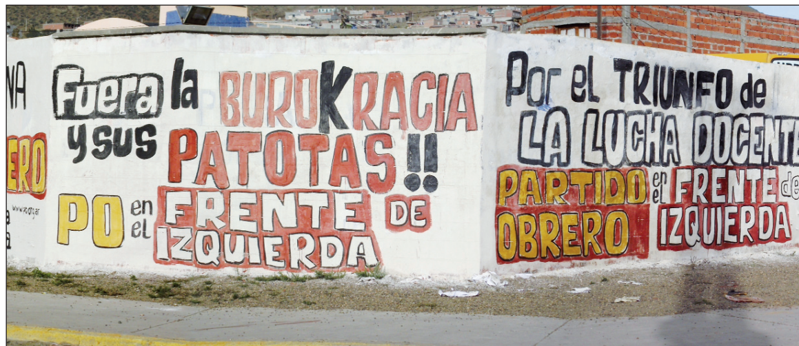
Campaña en Caleta Olivia, Santa Cruz. El Frente de Izquierda es la expresión de los explotados que se movilizan en oposición constante a la burocracia sindical, al Estado y a sus partidos.

Todo frente es, por definición, "práctico", a diferencia de la concepción de conjunto que une a los miembros de un partido. Pero ningún frente, por práctico que sea, puede confinarse a su propio instante: abre una ruta, o sea que encierra un alcance que va más allá del primer momento, ¡al menos para las fracciones más conscientes del frente! No existe un muro infranqueable entre el frentismo y los objetivos estratégicos, lo que puede ser superado a través de la experiencia y por medio de una