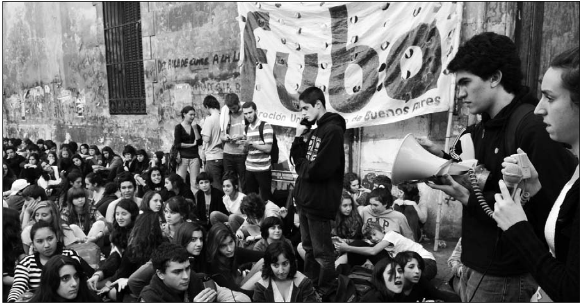
Sentada estudiantil frente al rectorado. Aunque el 95% de las fuerzas políticas nacionales se colocó en el campo de las autoridades, es el movimiento de lucha el que tiene la iniciativa.