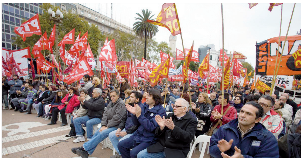
Altamira, en el acto del Primero de Mayo y en el Congreso del Partido Obrero. La rápida formación del Frente de Izquierda se explica por el avance previo de la izquierda en las luchas y en la organización de la clase obrera y de la juventud.

-La inflación es un fenómeno internacional en los países emergentes en especial, como consecuencia de la devaluación deliberada del dólar para rescatar al capital norteamericano. Este proceso especulativo solamente puede ser frenado en sus efectos por medio de un control público del proceso financiero, o sea la nacionalización de los bancos, cuyas ganancias se originan en la especulación y no en el crédito a la producción y el fortalecimiento de la industrialización. El gobierno actual alimenta la infla-