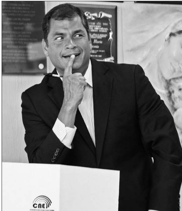
Rafael Correa, presidente de Ecuador. Los gobiernos bonapartistas refuerzan su arbitraje a través de procesos electorales en los que reafirman su carácter de "imprescindibles".

El otro tema, de mayor polémica, ha sido el de formar un co-