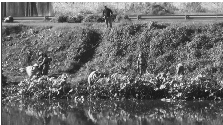
Cuadrillas del programa Argentina Trabaja, en el Riachuelo y sin protección.

De esto tampoco habla la llamada oposición.