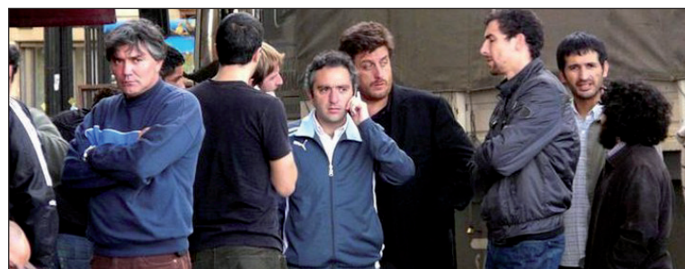
Lloroque y compañía. 'Despejan' a los Qom de la avenida 9 de Julio, pero no a los sojeros formoseños del gobernador Isfrán.

Primero intervinieron como el 'policía bueno' para forzar un levantamiento y luego ellos mismos se encargaron de hacer de 'policía malo'. También participó de las 'apretadas' al acampe la Policía Federal de la "seguridad democrática" de Garré. El acuerdo arrancado al final a las trompadas, carece de cualquier garantía de cumplimiento - algo que no debería asombrar en un gobierno que ha presidido la mayor expansión del latifundio (sojero) desde comienzos del 900. El acuerdo lleva la garantía simbólica de los organismos de derechos