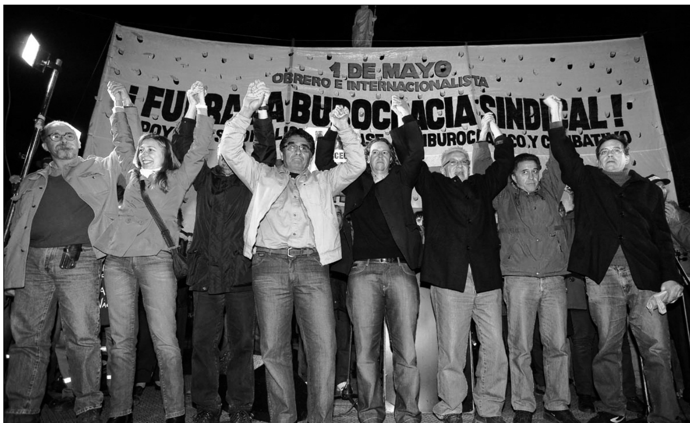
Los principales candidatos del Frente de Izquierda y los Trabajadores, en el acto del 1 de Mayo.

Los partidos del régimen están en harapos: por eso, ofi-