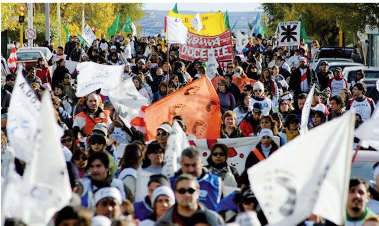
Masiva movilización docente en Río Gallegos, Santa Cruz.

La política argentina se ha convertido en un ridículo sube y baja.