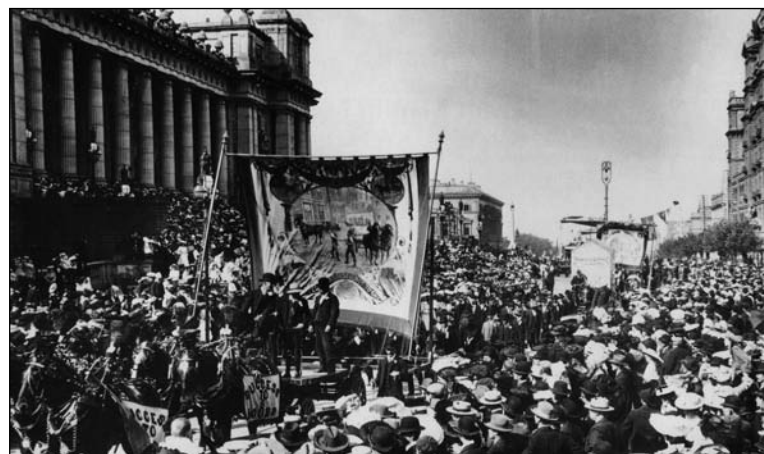
Melbourne, hacia 1900: marcha en el Día internacional de los trabajadores.

El 1° de mayo significaba establecer la jornada de ocho horas.