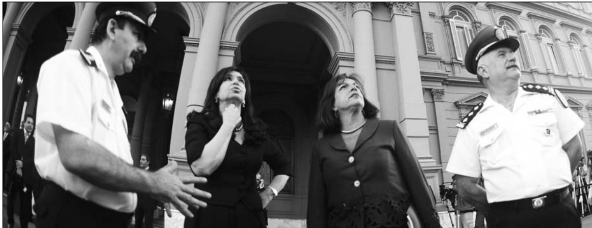
Cristina Kirchner, Nilda Garré y los jefes de la Federal. La seguridad del pueblo está en manos de mafiosos, corruptos e incompetentes.