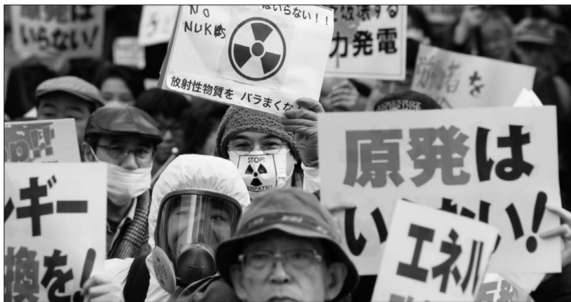
Un desastre potencialmente mayor que el ocurrido en Chernobyl. Japón está al borde del colapso y de la completa desorganización social.

Por otro lado, las fugas —que se repiten sin ningún registro real— han producido elevados niveles de radiactividad en varias regiones. En los alrededores de Fukushima, los niveles han superado largamente los 500 microsiervets (unidad de medida de la radiactividad), considerada la dosis máxima de radiaciones inocua para la salud. En las cercanías de la central se llegó a detectar picos de radiactividad de 1.200 microsiervets. Para las personas expuestas a esa dosis, se espera en 30 días una mortalidad de 10%. También fue detectada una alta radiactividad en el mar. En el agua, a 330 metros de