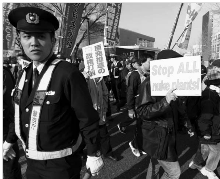
La catástrofe nuclear pone de relieve la descomposición capitalista.

Volviendo a Japón, lo que está sucediendo en esta etapa de descomposición del sistema capitalista es, en gran escala, un ciclo: ca-