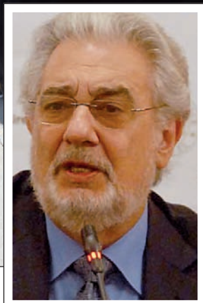
Plácido Domingo y los trabajadores del Colón, contra las sanciones de Macri y la privatización del Teatro.