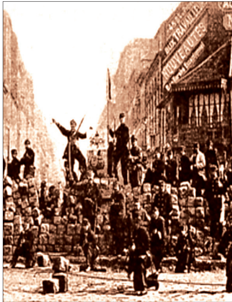
Barricada de los comuneros en París.

Cuando Thiers abandonó París a las apuradas el 18 de marzo, el Comité Central desistió de marchar sobre Versailles, que entonces carecía de la más mínima defensa. La vacilación en este punto fue decisiva para su corta vida. Algunos historiadores plantean que inclusive una parte de los comuneros suponían que la “defensa nacional” abriría la posibilidad de un acuerdo con el líder de la Francia burguesa. “La combinación de estas tareas contradictorias –el patriotismo y el socialismo– fue el error fatal de los socialistas franceses” resumió Lenin en 1908, recordando que ya la Internacional había alertado en 1870 contra el peligro de que el proletariado francés se dejara llevar por una flase idea nacional. Si en los tiempos de la Gran Revolución (1789) la lucha contra toda la reacción europea unía a toda la nación revolucionaria, ahora el proletariado ya no podía fundir sus intereses con los de otras clases hostiles a él; que sea la burguesía quien cargue con la