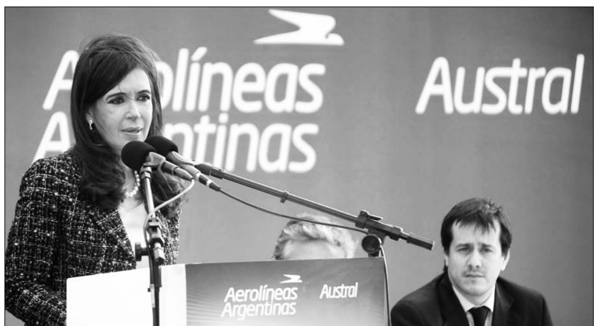
La representación K, un nuevo desfalco.

nueva reprivatización, con su secuela de despidos y pérdidas de conquistas laborales, sería presentada como una salida inevitable al desfalco actual, donde la camarilla ligada a La Cámpora emplea dos millones de dólares diarios sin control. La reprivatización significa un nuevo desfalco: la estatización de la deuda de Marsans y la contraída por la gestión K.