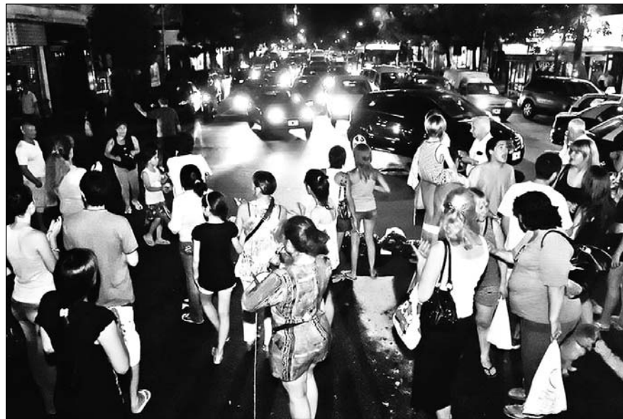
Un piquete vecinal, durante los cortes de luz de fin de año. La crisis eléctrica y energética desnuda el fracaso de la política oficial; puede y debe hacerse un rescate del sistema energético sin tarifazos ni derrumbe del servicio.

Aunque los cortes de luz han afectado a usuarios de todas las distribuidoras de la Capital y el conur-