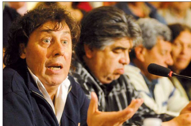
Pablo Micheli y Hugo Yasky, encabezando a "sus" CTA. Asistimos a una crisis de conjunto de la burocracia sindical; ella no se confina en la CTA, que es solamente su expresión más mediática.

Las fracciones que han llevado al derrumbe a la CTA no tienen siquiera la capacidad de separarse; como un matrimonio desgastado, han tomado la posición cobarde de la cohabitación edilicia. En el proceso, disputarán la recaudación de los aportes de los afiliados y el pago del personal de la sede. El desguace continuará, de todos modos, por otros senderos y promete llevarse consigo a algunos sindicatos -por lo menos a ATE, donde los yaskianos están dispuestos a pelear la dirección a Micheli. La convención edilicia encubre la intención de llevar la crisis de la CTA hasta el desguace. La falta de una delimitación política neta y de una ruptura clara llevan a un completo liquidacionismo. Unos y otros buscan amparo en el aparato político de la burguesía -Yasky en el gobierno y Micheli en el conjunto de la oposición patronal. Las energías de