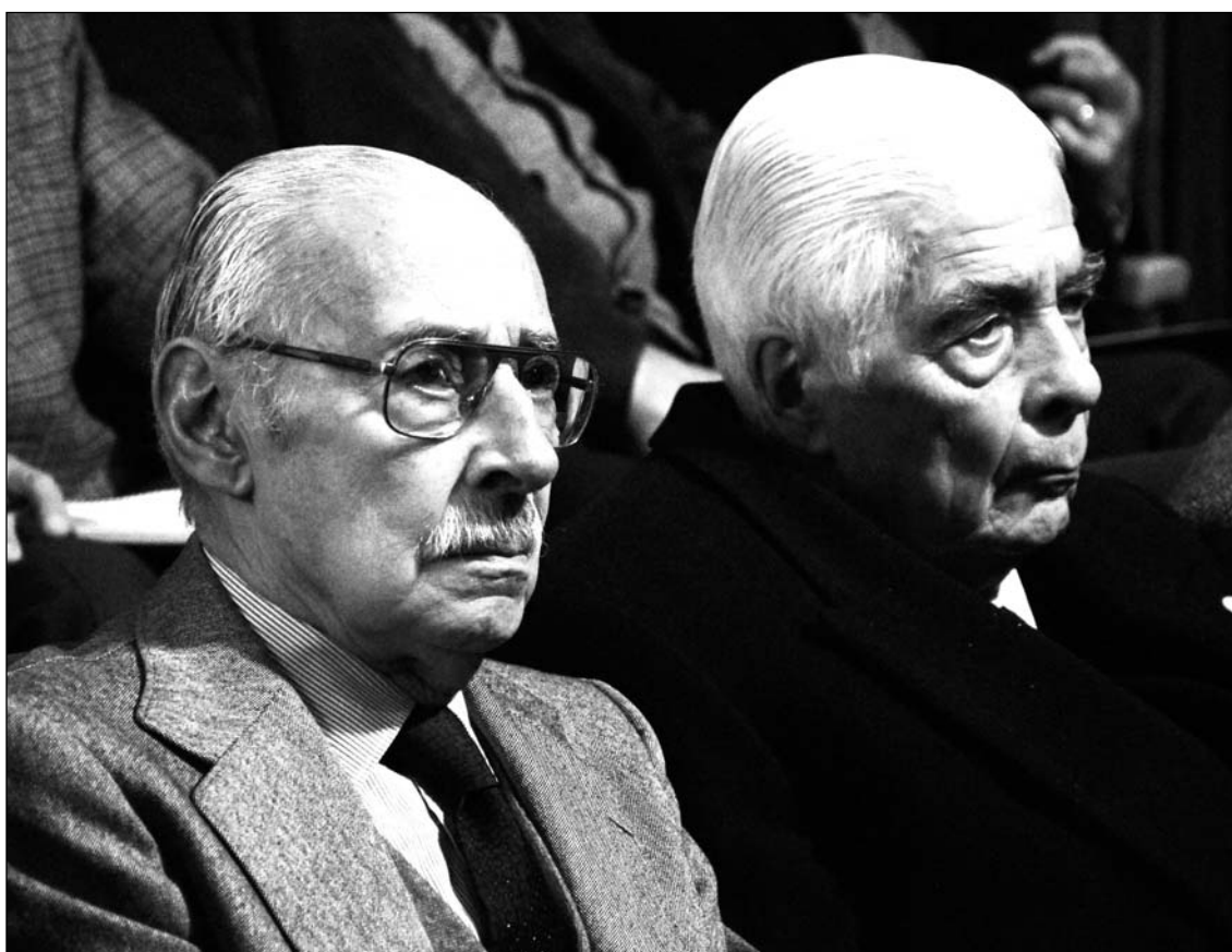
Jorge Rafael Videla y Benjamín Menéndez. Su condena opera como una absolución de los que colaboraron con su régimen y luego con la obediencia debida y el indulto, incluidos los K.