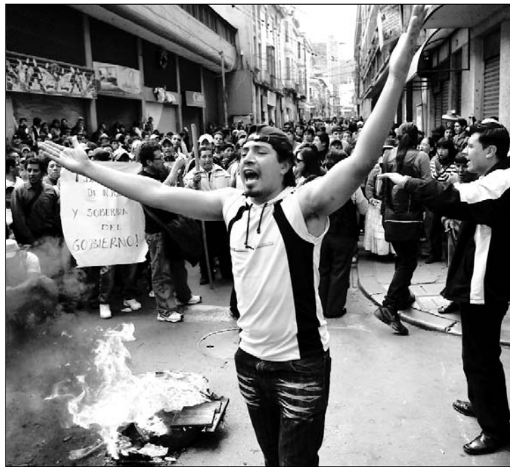
El gasolinazo encendió la rebelión popular. La centralización de recursos y capitales que requiere el desarrollo de Bolivia, sólo puede ser establecida por un gobierno obrero y campesino.

"El pueblo no estaba preparado para enfrentar las consecuencias de la medida". Así explicó Evo Mo-