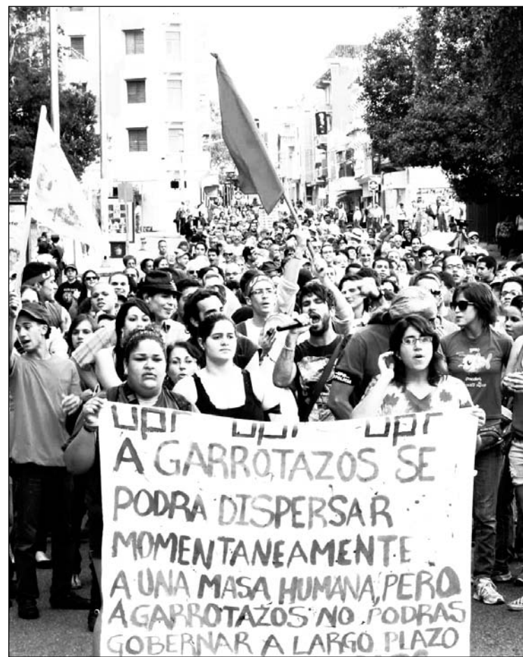
Las promesas incumplidas han dado lugar a una nueva rebelión estudiantil.

A pesar de que los estudiantes han presentado infinidad de propuestas para reemplazar el aumento de la matrícula, el gobernador colonial no ha cedido. Puerto Rico tiene una economía que se encuentra a punto de cumplir 60 meses de recesión, con un déficit de 3.300 millones de dólares. Luis Fortuño y el Banco Gubernamen-