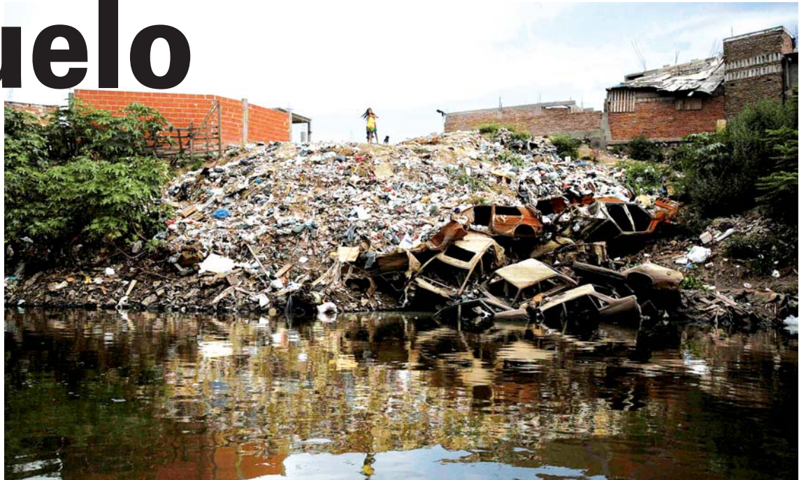
Riachuelo: el gallinero sigue en manos de los zorros. Se arranca con un ataque no a los contaminadores industriales, sino contra los pobladores