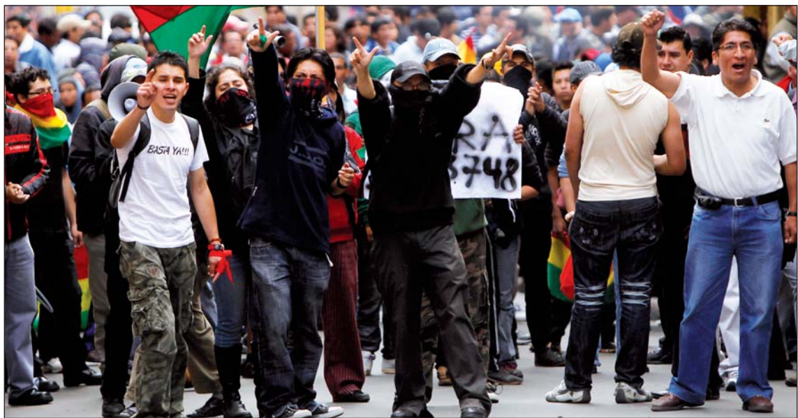
Manifestaciones en Bolivia contra el "gasolinazo". Lo ocurrido encierra elementos de la próxima etapa de la crisis: las economías nacionales están siendo sacudidas por una guerra económica mundial.

En resumen, toda América Latina, con la excepción de México, está tomando medidas para evitar la apreciación de sus monedas y convertirse en tacho de basura de las exportaciones sin salida de los países centrales. Se trata de una política devaluatoria que alimenta la inflación, o sea la carestía; liquida los planes y subsidios sociales y desarrolla las condiciones de una rebelión popular. La primera manifestación de este proceso que se da en América Latina nació en