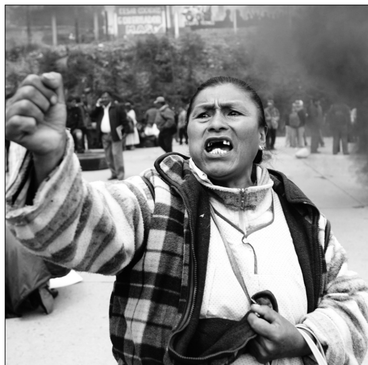
Protesta contra el gasolinazo.

YA APARECIO Adquiéralo en los locales del PO y en las mejores librerías