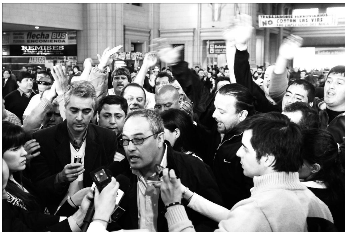
La patota en acción en vísperas del asesinato de Mariano.

López imputó a los siete detenidos como "coautores" por