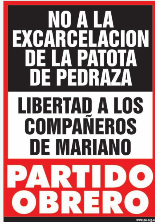
Afiche difundido el 27 de diciembre.