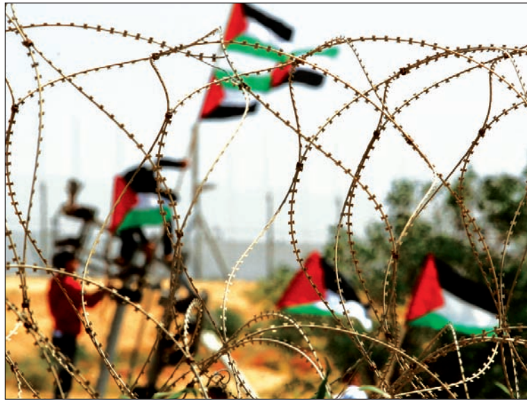
Palestina sigue anexada a Israel. Lo que parece ser un reconocimiento a su independencia es un reconocimiento a la ocupación.

Cuarto. ¿Por qué hacen, entonces, algo que no implica nada? Ocurre que, desde hace aproximadamente un año, un ala de la Unión Europea (cuyo vocero es el diario Le Monde ) está alentando la decisión del primer ministro de la AP de declarar en forma unilateral la soberanía de la Autoridad Palestina sobre la jurisdicción que ejerce en Cisjordania. Salam Fayad ha sido funcionario de los organismos internacionales de crédito y hombre de paja del Departamento de Estado norteamericano. Su tesis es que la soberanía sobre un Estado mutilado se alcanzará como consecuencia del desarrollo económico de su zona -para lo cual ha obtenido créditos de los emiratos árabes, Arabia Saudita,