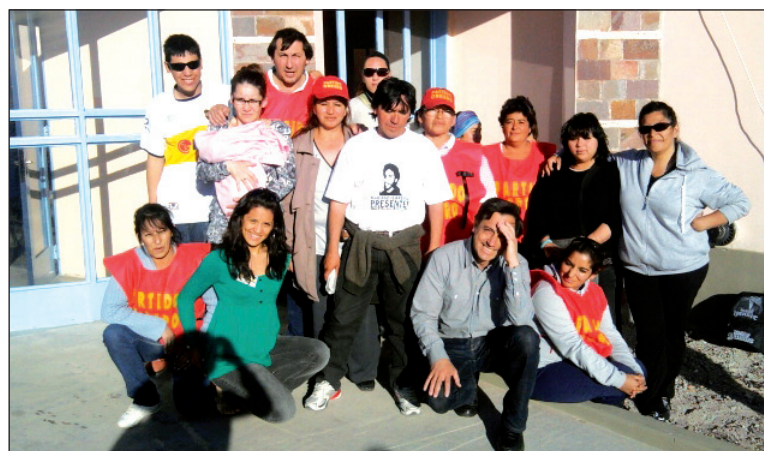
Delegación del FUT-PO Santa Cruz, en su visita a Guineo