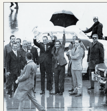
Perón, acompañado por Rucci, el día del retorno.

Podría decirse que el GAN tiene la autoría intelectual del propio Perón. En 1970 va a constituir con radicales, demócratas pro-