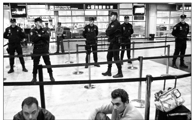
Represión en los aeropuertos del Estado Español.

aéreo español estaba clausurado. Durante la tarde, la policía irrumpió en un hotel cercano al aeropuerto de Barajas, donde los controladores realizaban una asamblea, y los obligó a disolverse. Antes de la medianoche, el gobierno anunció la militarización de las torres de control y envió a patrullas del Ejército y la Guardia Civil a ocupar los aeropuertos. Notablemente, a pesar de las amenazas y de que la propia directiva del sindicato llamaba "encarecidamente" a toda la plantilla a volver al trabajo, durante la madrugada del sábado sólo un sector de los controladores del turno noche se presentó a trabajar, por lo que la paralización aérea continuó siendo prácticamente total. El sábado, a primera hora de la mañana, el gobierno dio un paso más y decretó el "estado de alerta" -por primera vez en la historia de la España post-franquista- que implica la militarización de todo el plantel de controladores; cualquier desobe-