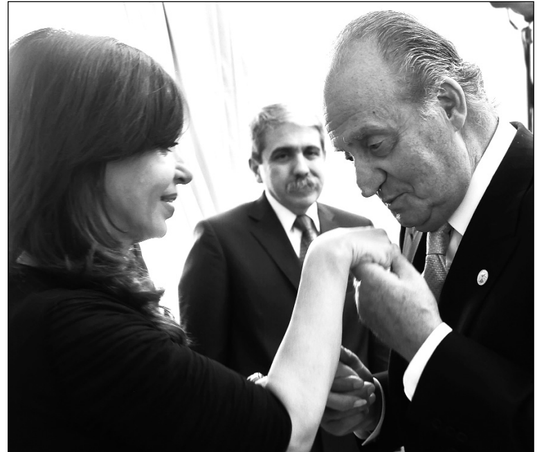
Cristina y el rey Juan Carlos, en la Cumbre Iberoamericana.

La prensa destituyente de Argentina celebró la compostura de