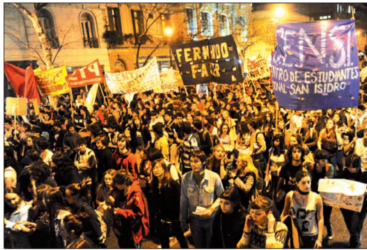
Movilización de los secundarios durante el Estudiantazo.

Resultados en mano, los "herederos" se olvidaron de sus "padres" y en el Buenos Aires, la elección siguiente, optaron por dar un 'volantazo'. La Jauretche (UES) inventó de la noche a la mañana un frente con dos individuos (2) sabbatellistas, para un giro de 180 grados en el tenor de la campaña. La consigna, "por un Cenba más plural y democrático", sonaba a descripción –más acorde con la labia de Sanz o Cobos. La plataforma no mencionaba ni una vez la palabra Kirchner, una verdadera blasfemia, e incluso incluía varias críticas al gobierno nacional, al que de todos modos habrá de acompañar. El líder de fogoso andar era convertido en un seguidista de la vanguardia personificada en la Jauretche. Don Arturo, el primer nombre del apellido rebautizado, jamás habría vendido