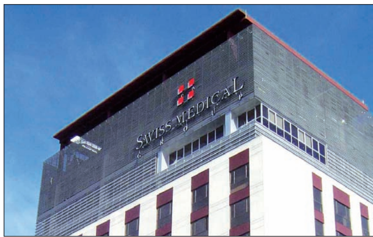
Edificio de Swiss Medical. Las obras sociales se van transformando paulatinamente en comisionistas de las prepagas.

La semana pasada, la Cámara de Senadores votó un proyecto de ley que tenía cajoneado desde agosto de 2008, el cual buscaba poner ciertos límites a la actividad de las prepagas. Es notable que una regulación legal que no decía nada sobre el incremento de las tarifas (que quedaba para cuando se reglamentara la ley) o las prestaciones más allá del PMO haya sido combatida por las prepagas con el argumento de que "hará quebrar la actividad". Según dice el sector, sus ganancias son del 2% o el 3% de la facturación. Se trataría, entonces, de un negocio inviable, que es rentable en tanto no se lo regule. "El esquema de negocio funciona sobre la base de una población sana que paga su cuota y subsidia a los que se enferman", dice un experto ( La Nación , ídem). Pero para que funcione ese "esquema" no hacen falta la salud privada ni sus negociados, porque ése es el mecanismo de funcionamiento de las obras so-