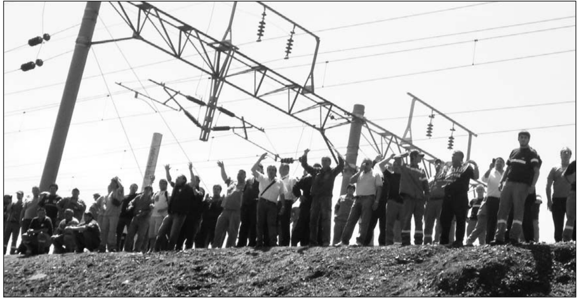
La patota de la Unión Ferroviaria en las vías.