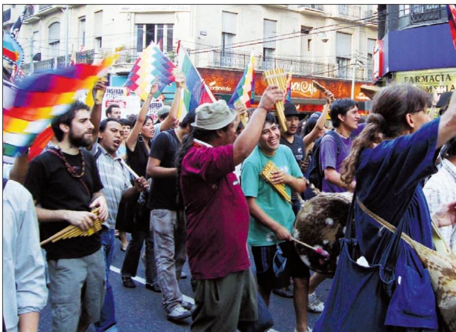
Mobilización de las organizaciones de Pueblos Originarios en Buenos Aires.

De la mano de Insfrán, Formosa se ha convertido en un paraíso para terratenientes, ganaderos y 'pools' sojeros, que vienen expulsando en forma sistemática a los pequeños campesinos de las colonias y a los pueblos originarios. En los últimos años, un millón de hectáreas fueron acaparadas por sojeros, a costa del desalojo de 35.000 tobas y wichis. Recientemente, Insfrán hizo aprobar una "ley de reordenamiento territorial" que habilita el despojo de todo aquél que no tenga un título propietario. A partir de ese sistema, se ha construido un régimen de atropellos contra