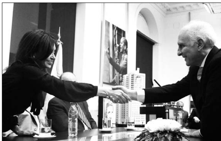
Cristina Kirchner, reunida con los empresarios petroleros y la burocracia sindical

El 'pacto social' petrolero es una demarcación de cancha de De Vido y la Presidenta para que Moyano y compañía lo vendan o impongan en los sindicatos de la CGT y, en el caso de Yasky, en la CTA. Esto ocurre cuando la intención de aumentar el precio de los combustibles se encuentra en marcha, como viene ocurriendo