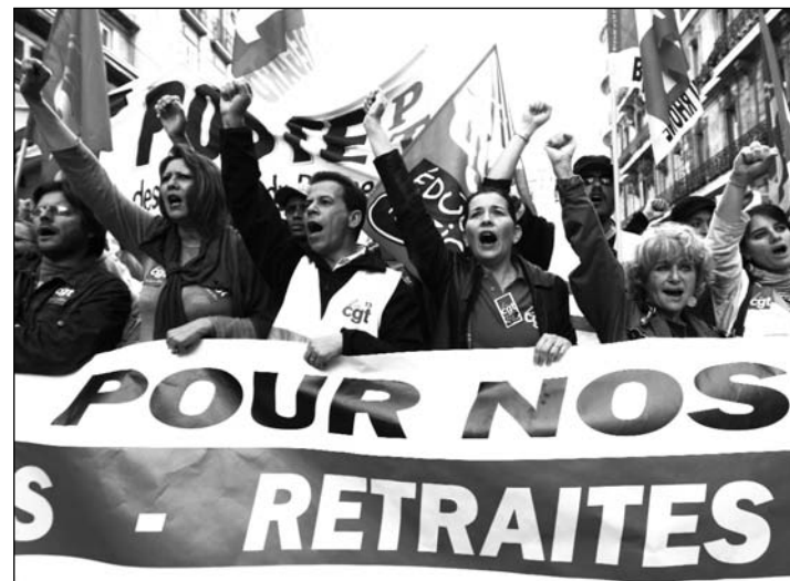
Tras las masivas movilizaciones la izquierda y el gobierno quieren volver a los negocios habituales. La crisis y la maduración de la rebelión obrera y popular no lo permitirán.

Este movimiento se caracterizó por la intervención de