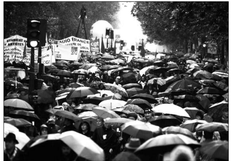
El movimiento se caracterizó por la intervención de una capa militante que se esforzó por llevar adelante una orientación opuesta a la del diálogo y la paz social de las direcciones. Estamos en presencia de las premisas de una nueva etapa de lucha para el movimiento obrero.

Reagrupamiento obrero y militante contra plataformas antiliberales y unidades de aparato: ésta es la disyuntiva para el período, habida cuenta que el reagrupamiento va a operar sobre la base del balance, pero también de nuevos enfrentamientos, movilizaciones y luchas. Nada indica que la paz social y el diálogo van a reinar hasta 2012. Es todo lo contrario. Hay que desarrollar una intervención en la crisis capitalista, sobre la base de una orientación progra-