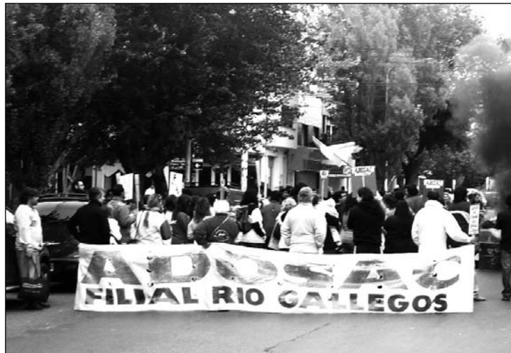
Los docentes santacruceños salen a luchar por las jubilaciones.