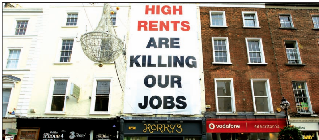
Cartel en zona comercial de Dublín: “los altos alquileres están matando nuestros trabajos”

de cuentas externas del 12% del PBI, mientras que los bancos portugueses dependen del financiamiento interno para el 40% de sus activos. En todo caso, los especuladores internacionales han llevado la sobretasa de interés que paga Portugal a los 800 puntos. Un retiro de Portugal del euro se llevaría puesta a España —su principal acreedor. Italia, a su vez, que se ufana de su política de rigor fiscal, no tiene condiciones de suscribir un rescate a Irlanda —la gota de agua que acabaría con las aventuras de Berlusconi, que es acusado por la gran industria por falta de socorro estatal. Irlanda, la víctima en esta ocasión, no podría de ninguna manera rescatar a sus grandes bancos, en los cuales ya metió 60 mil millones de euros, incurriendo, para 2010, en un déficit fiscal del 32% de su producto —un porcentaje jamás visto, salvo en guerras mundiales, y una deuda pública del 150%. El Tesoro irlandés se encuentra, por lo tanto, quebrado, precisamente en el momento en que debe honrar las garantías totales que estableció, a fines de aquel mismo 2008, para los grandes bancos locales; por eso la sobre-