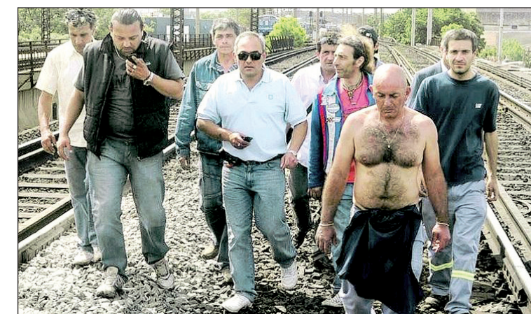
Los matones en la vía. Se empieza a expresar el repudio de la base ferroviaria.

En el Mitre, un frente integrado por la Bordó-Violeta obtuvo 515 votos contra 804 de la Verde. La Verde había desplazado a la Bordó del cuerpo de delegados del Mitre en las anteriores elecciones en forma contundente ante la división de la oposición. Lo significativo de la elección del Mitre es que, a pesar de perder, la oposición duplicó la anterior elección y hubo un abierto boicot a la votación por parte de especialidades enteras, como la Diesel de San Martín de ese ferrocarril que en masa no fue a votar, lo que significa simplemente un repudio a la política de la Verde que no supo o no alcanzó a capitalizar la oposición antiburocrática. Uno de los datos políticos más importantes de las elecciones de cuerpos de delegados se produjo en el Belgrano