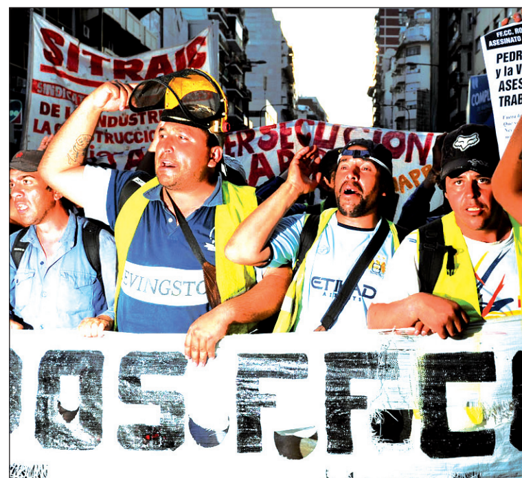
Tercerizados se movilizan. La lucha entró en una fase decisiva.

El planteo de la mayoría de las que tienen trabajo permanente sobre el mantenimiento de vías, limpieza y desmalezamiento es la