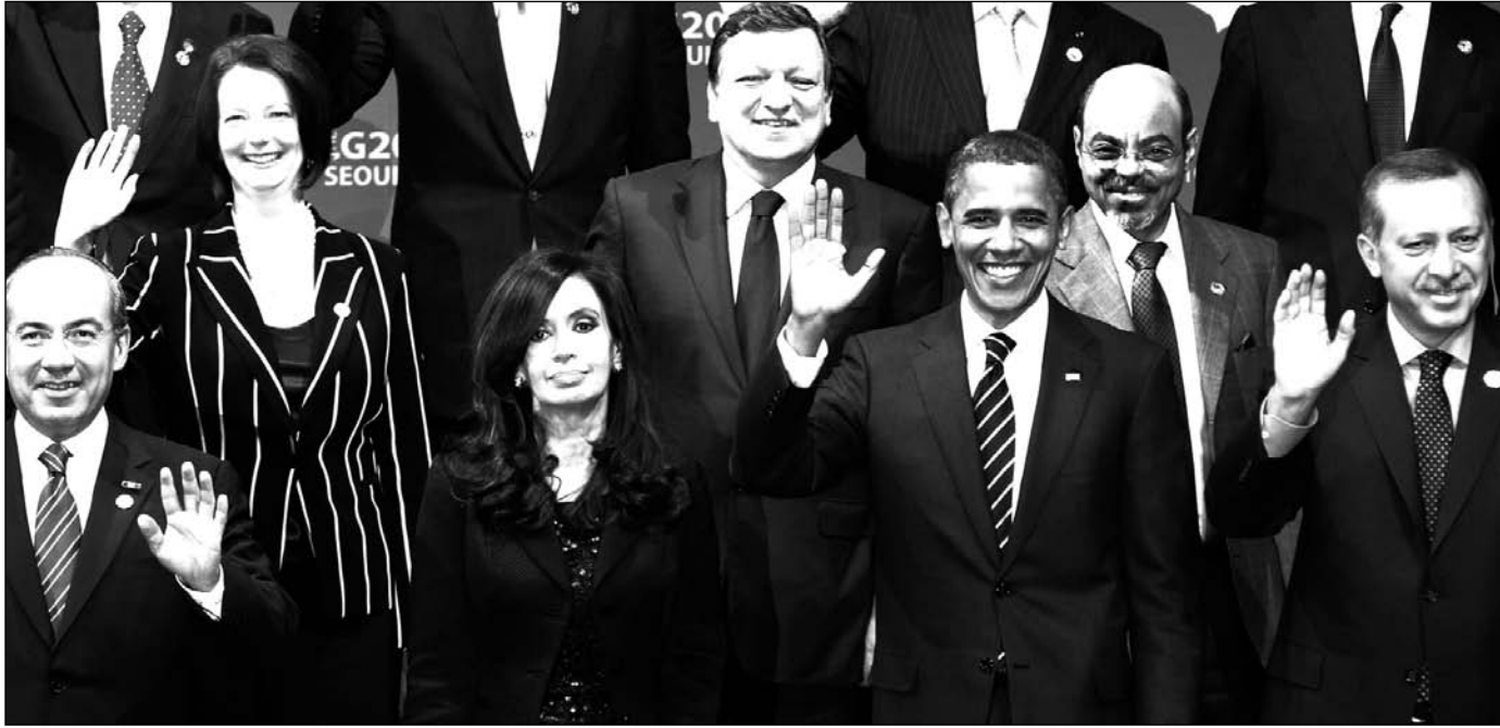
Cristina Kirchner en la reunión del G20. El destino del Presupuesto ha quedado en manos del Club de París.

mentario y puede implicar, por lo tanto, la renuncia del funcionario a cargo de la Presidencia. Superar este impasse mediante una negociación en el Congreso es azaroso, porque teniendo el recurso del veto, el oficialismo buscará imponer su proyecto. El fracaso de todas estas variantes conduce a la prórroga del Presupuesto precedente y a ajustarlo por medio de decretos. Naturalmente, no son las formas políticas o institucionales la causa de esta crisis, sino apenas sus vehículos o víctimas. La causa es la crisis capitalista mundial y las presiones que, en este marco, ejerce el capital financiero, como está ocurriendo ahora con la llamada 'guerra de monedas' —o sea la desestabilización del peso y la inflación, y las fluctuaciones violentas de los precios de las exportaciones de Argentina.