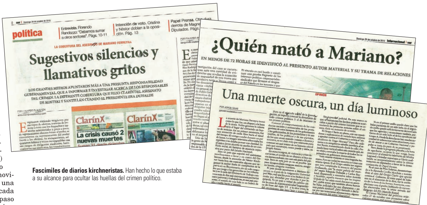
Fascimiles de diarios kirchneristas. Han hecho lo que estaba a su alcance para ocultar las huellas del crimen político.

Otra faena de los medios oficiales consistió en caracterizar como un ‘aprovechamiento’ o ‘instrumentalización’ del crimen contra nuestro compañero al pedido de audiencia a la Presidenta. No opinan lo mismo cuando la Presidenta inaugura un casino al lado de un capitalista del juego o de una firma capitalista internacional que viene a explotar a los trabajadores argentinos, con tercerización incluida. En la inauguración