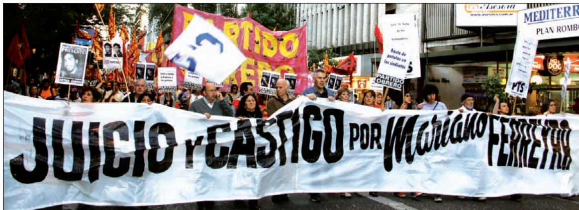
Córdoba. Otra masiva marcha.

La movilización nacional fue un paso adelante en la lucha por el castigo a los responsables intelectuales del crimen y para terminar con el encubrimiento que quiere cerrar la causa con la detención de un grupo de pe-rejiles mandados por otros. Se trata de redoblar la movilización y la organización para meter a la cárcel a todos los culpables.