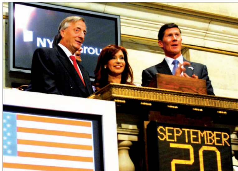
Néstor y Cristina Kirchner, en la bolsa de Nueva York.

Un segundo acto “consistió en preparar el megacanje (junio/2001), un canje de bonos que serviría para aliviar al Estado del peso de la deuda. En realidad, estaba recargándolo aún más, con un incremento de la deuda de 55.000 millones de dólares —preparando así el futuro ‘descuento’