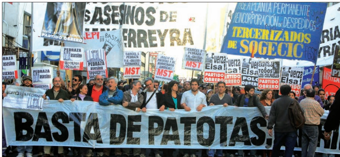
Buenos Aires. Cabecera de la imponente movilización.

Más de 2.000 manifestantes marcharon por las calles del centro de Córdoba. Participaron la Interestudiantil —que está a la cabeza de la lucha estudiantil—, trabajadores telefónicos, docentes, delegados del gremio de los municipales, así como docentes universitarios, entre otros y la totalidad de los partidos de izquierda.