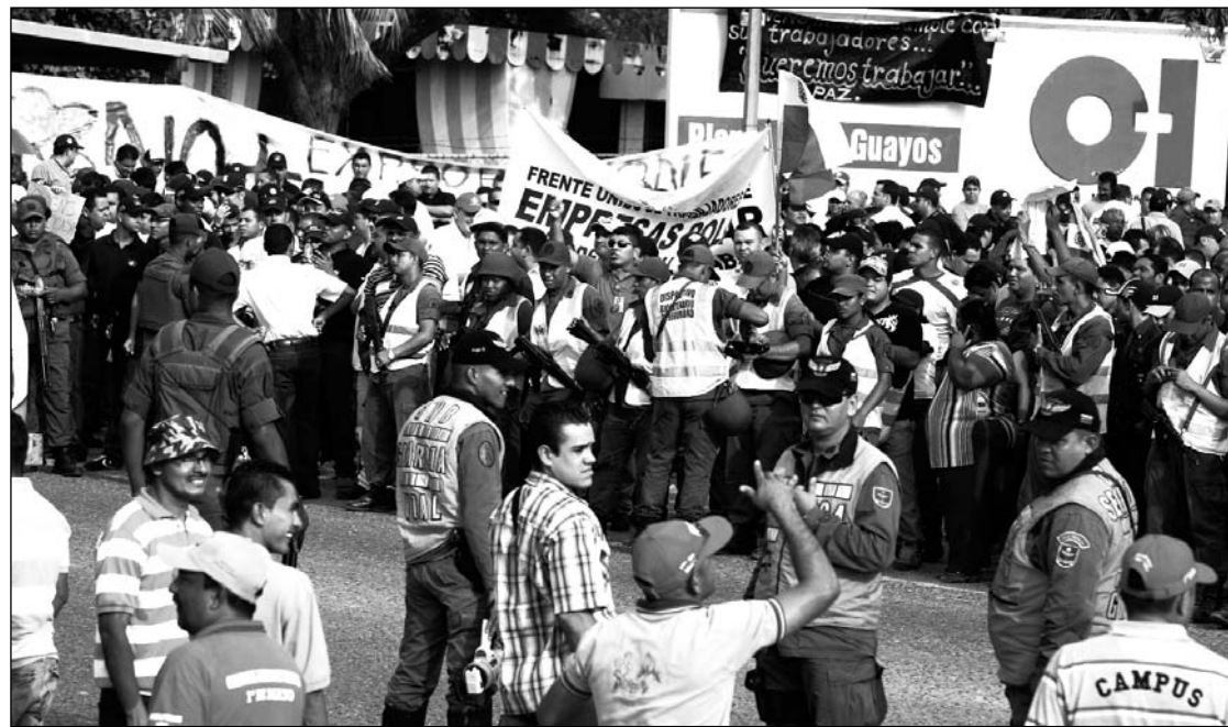
Venezuela, movilización de obreros contra las estatizaciones. El despilfarro de recursos en indemnizaciones y la sustitución de la patronal por una casta de funcionarios incapaces —y muchas veces corruptos— descalifican aquellas que puedan ser revolucionarias.

Frente a este panorama, el gobierno ha lanzado un nuevo plan de estatizaciones, que son generosamente compensadas como todas las anteriores. Se estima que las indemnizaciones en concepto de estatizaciones han consumido unos 30 mil millones de dólares —un formidable derroche de recursos. Ahora, tienen por blanco a los monopolios de la alimentación, que son responsabilizados por el alza de precios de la canasta básica. Amparadas en la tesis de “una profundización de la revolución”, estas medidas ignoran el fracaso del sistema de comercio de productos alimentarios (Mercial, PDVAL), establecido hace cuatro años, y la creación de la llamada “planilla” o lista con productos subsidiados. El gobierno corre el riesgo de que, si la carestía se incrementa, incluso en el marco de las nuevas estatizaciones, quede al desnudo una irrevocable incapacidad política. De hecho, ya han tenido que desmentir que se proponga estatizar almacenes, tiendas o supermercados. Las estatizaciones en sí mismas no determinan su carácter, el cual depende de la finalidad que persiguen, de la clase que las ejecuta y de su método. El despilfarro de recursos en indemnizaciones y la sustitución de la patronal por una casta de funcionarios incapaces —y muchas veces corrup-