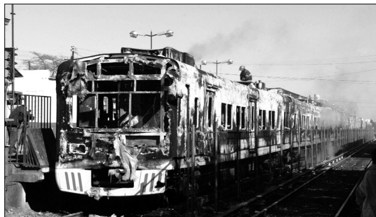
Quema de trenes del Sarmiento, en 2008. Fernández, junto a Feinmann, imputaron al PO para encubrir a los vaciadores.

Finalmente, los funcionarios judiciales lograron notificarlo en su domicilio laboral. Pero el difamador se toma su tiempo: cuenta, legamente, con sesenta días hábiles para responder a la demanda —y es de prever que se los tomará todos, hasta el último día. La velocidad fantástica con la que el jefe de Gabinete organiza intrigas por Twitter no rige a la hora de rendir cuentas sobre sus mentiras contra el PO, que fueran propaladas a través de una verdadera cadena nacional. A la luz de lo que acaba de ocurrir con la patota de Pedraza que