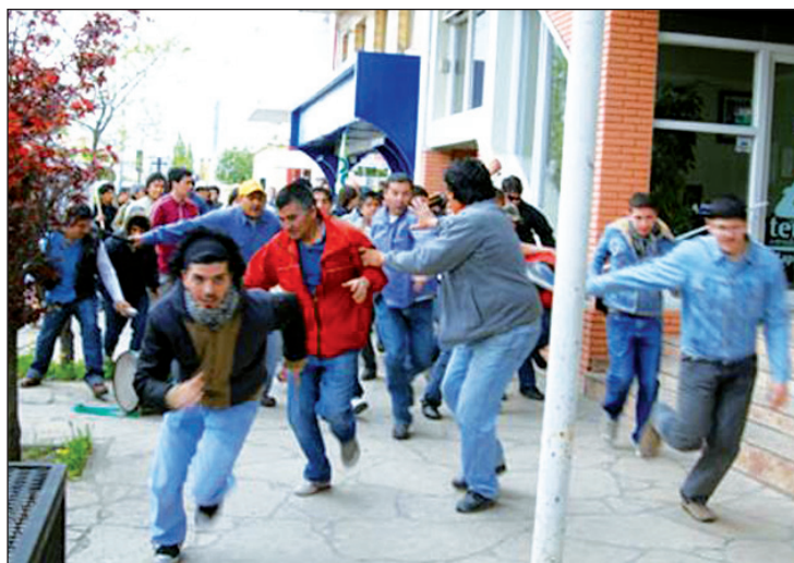
En Santa Cruz, también. La patota ataca al PO y a los activistas del gremio de Comercio

Todos los afectados de la Lista Verde de empleados de comercio y del PO llegamos enseguida