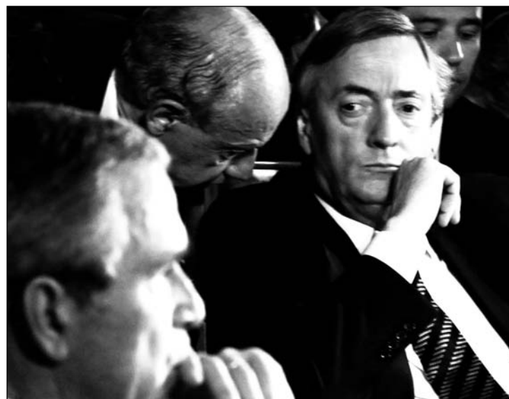
George Bush y Néstor Kirchner, durante la Cumbre de las Américas de 2005

A partir del nuevo siglo, sin necesidad del Alca, se produjo una penetración sin precedentes del capital financiero en América Latina. Los yanquis avanzaron, por su lado, con acuerdos bilaterales de “libre comercio” con varios países latinoamericanos. Brasil, el país clave, ya había decidido que el Alca no tenía viabilidad y que no era conveniente para su industria, ni para la expansión brasileña en el Mercosur. Por esto, decidió ir a convenios bilaterales con los yanquis, lo que comenzó a hacer al día siguiente de la clausura de la Cumbre marplatense, recibiendo a Bush en Brasilia. Lula nunca perdió de vista su interés en llegar al mercado norteamericano del etanol, para lo que debía llegar a un acuerdo de inversiones con Estados Unidos. En Mar del Plata, Chávez y Kirchner actuaron como instrumentos útiles de la diplomacia brasileña. de empresas nativas a cambio de permitir algunas inversiones yanquis en el mismo sector. La