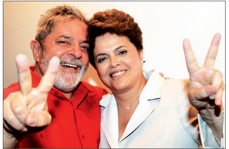
Lula y Dilma. Tienen un programa definido: ‘enfriar’ la economía, financiar a la patria contratista y reforzar la alianza con Estados Unidos.

La izquierda del PT tampoco podría sustituir el rol de Lula, dedicada como está a disputar