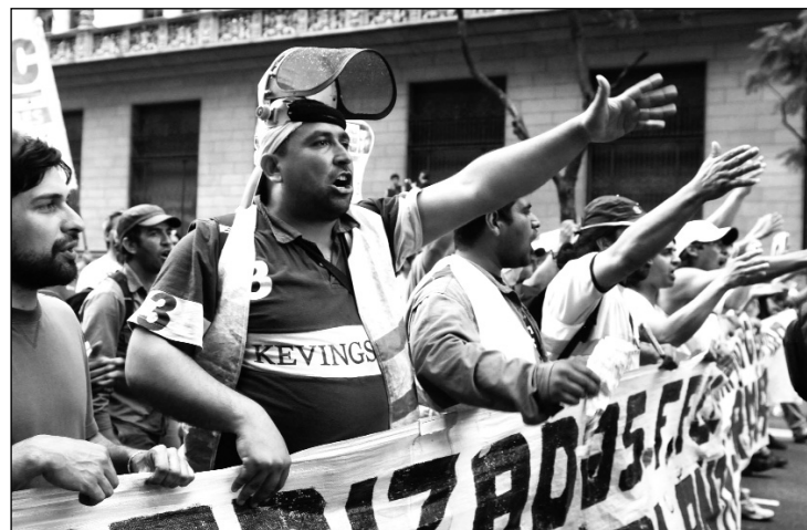
Los trabajadores tercerizados en lucha.