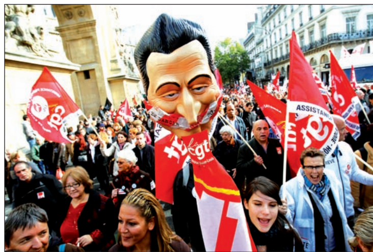
Los trabajadores franceses se siguen movilizando. Pero sus direcciones quieren enterrar la lucha.

Estas incógnitas resultan del carácter del movimiento actual, el cual combina la lucha centralizada contra el gobierno y las