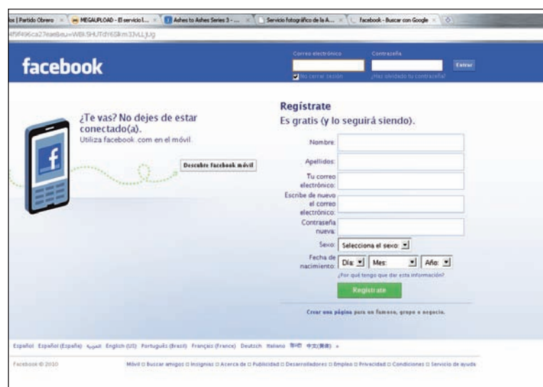
Facebook, un verdadero "Gran Hermano"

disfraza de "errores lamentables" por lo que los pulpos piden disculpas cuando el daño ya está hecho. En febrero de este año se efectuó una demanda colectiva contra Google alegando que ellos violaron la ley por los datos de los contactos de correo electrónico de usuarios que publicaron sin su consentimiento a través de Google Buzz, una especie de clon de Twitter. Google lo tuvo que desactivar y lamentó que "no había testeado Buzz lo suficiente antes de lanzarlo". También "Google admitió en mayo que 'por error' habían recogido datos personales de las redes wi-fi privadas no protegidas... en más de 30 países" al grabar imágenes de calles para Google Maps ( El País , 17/8).