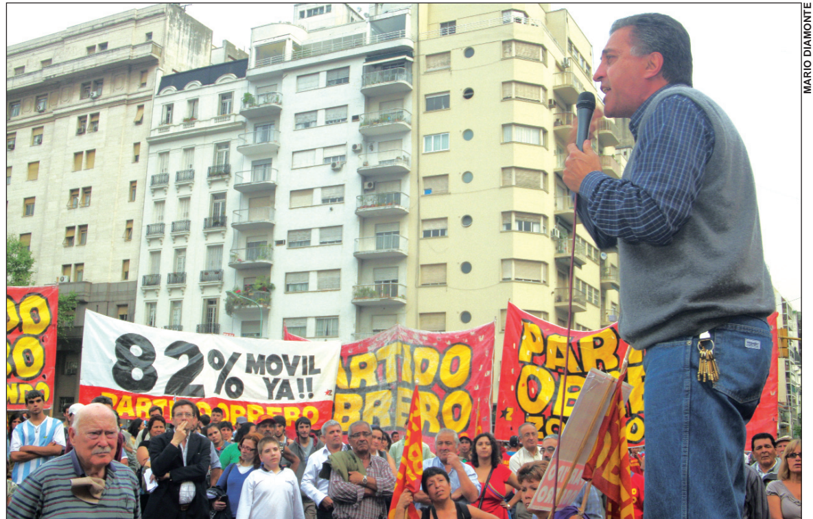
El Partido Obrero, movilizado por el 82% móvil.

nerales implicaría hacerlo con "los aportes de los futuros beneficiarios". Ni una cosa ni la otra. En primer lugar, porque una parte de rentas ya va hoy a la Anses y paga así las jubilaciones, pero esto ocurre porque los K no quieren volver a los aportes patronales que bajó Cavallo. Segundo, hay que aumentar estos aportes, los patronos tienen que financiar las jubilaciones, porque las jubilaciones son parte del salario e integran los costos de producción que determinan los precios respectivos. La patronal embolsa el importe de las jubilaciones a través de los precios, mucho antes de tener que pagarlas. Las "rentas generales" son una carga sobre los propios trabajadores, concebida para reducir la carga impositiva de la patronal y, peor, para contribuir a subsidiarla en nombre de la competitividad. Las dos terceras partes de los ingresos impositivos provienen de impuestos al consumo, comenzando por el IVA. La jubilación, como salario diferido, implica, naturalmente, que sea costeadada enteramente por el aporte patronal.