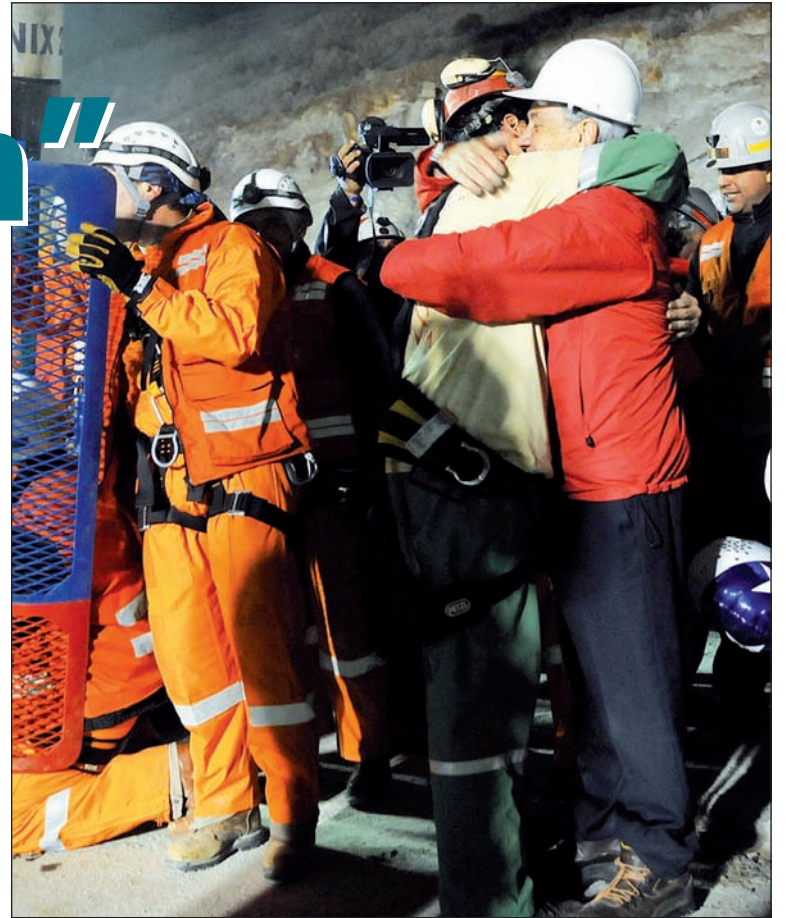
El presidente de Chile abraza a uno de los mineros rescatados. Un show mediático para ocultar la gran responsabilidad de su gobierno

Es cierto que son los mineros en gran parte responsables de su supervivencia por estar acostumbrados a sortear estos brutales niveles de explotación. La burguesía chilena ahora "descubre" y canta loas a la practicidad y el coraje de los mineros, que des-