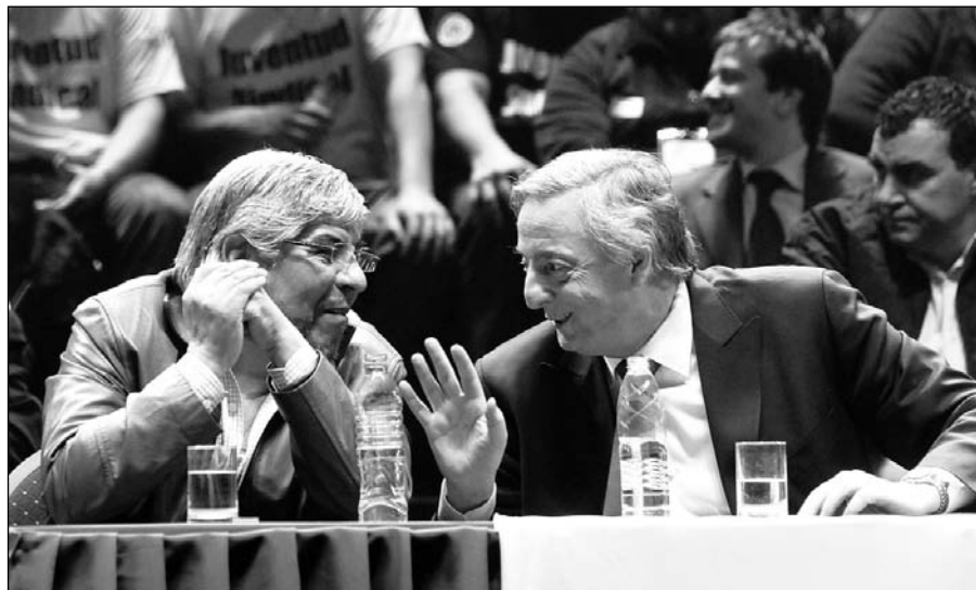
Con Kirchner, en el acto del Luna Park. Moyano dice que quiere pasar de factor de presión a factor de poder

Para las patronales, la "participación en las ganancias" debe formar