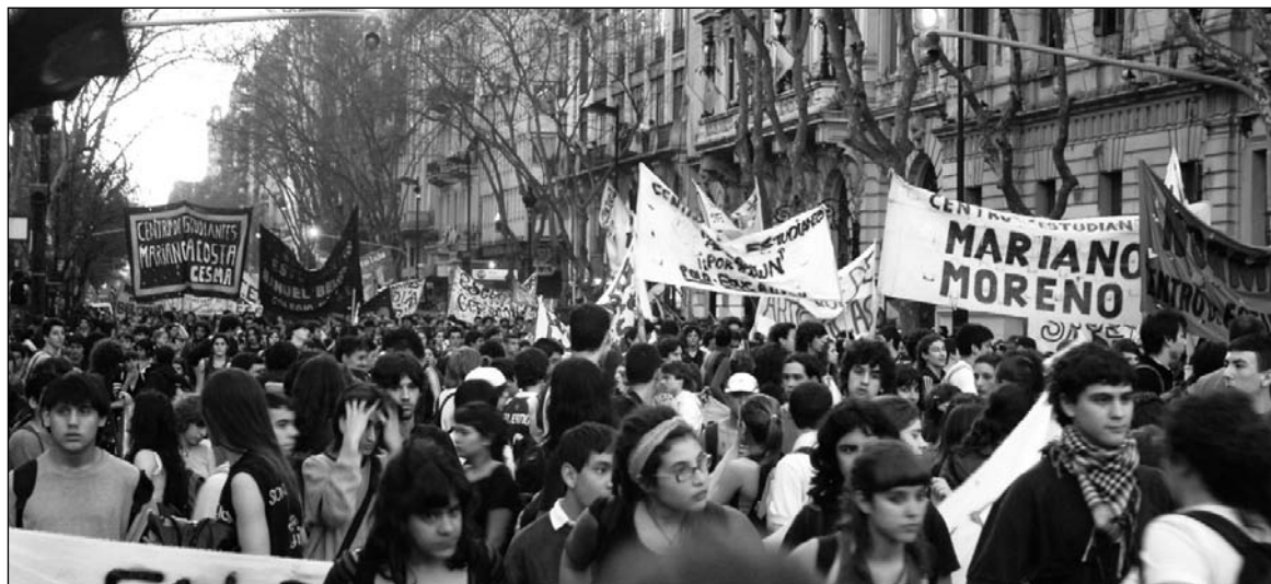
Un movimiento independiente. El "estudiantazo" es un proceso político de alcance nacional, contra el que se estrechan los intentos de corrupción y copiamiento del gobierno y de la oposición —incluidos los centroizquierdistas

Para llevar a la victoria al estudiantazo es necesaria la independencia política de la juventud del Estado y los bloques capitalistas. Las formaciones políticas ligadas al centroizquierdismo o al nacionalismo son un factor de freno y, en definitiva, de contención y co-