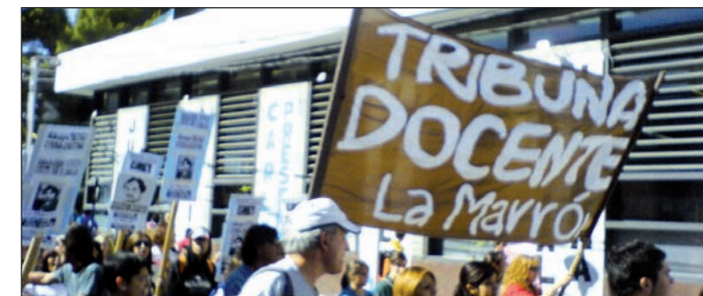
Para recuperar Aten. Tribuna Docente - Lista Marrón planteó la conformación de un gran frente de las corrientes y activistas combativos

Tribuna Docente y el Partido Obrero hicimos un planteo político cuando todavía se estaban contando los votos de Ctera. Que todas las corrientes y sectores de activistas combativos, y de izquierda, incluyera la minoría Rosa-Fucsia, formáramos una lista sobre tres bases: 1) el rechazo a la paz social y al levantamiento de la huelga que nos unió