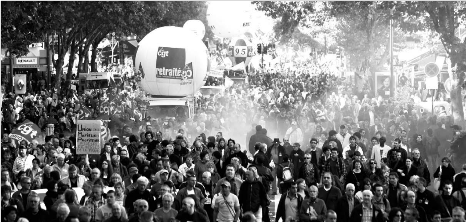
Los obreros frente a la crisis: tres millones de franceses movilizados. La crisis mundial ingresa en su fase decisiva, la desintegración del sistema monetario; no hay salida, en términos capitalistas, sin una declaración de bancarrota

valor real de las deudas. Una mayor suba del yen implica mayor deflación (baja de precios internos y de importación), pero con el agravante de que ya no hay margen para deflacionar (reducir en términos monetarios) los costos de la producción. La aventura especulativa del yen exponía el colapso de la economía japonesa. Lo mismo vuelve a ocurrir en Europa, pues la revalorización del euro aumenta los costos de producción y acentúa la dificultad de exportar su crisis. Para los países con una deuda privada y pública impagable, esto representa la posibilidad de un nuevo terremoto. Irlanda está virtualmente en quiebra, pues el rescate de uno solo de sus bancos le ha consumido el equivalente al 50% del PBI. Portugal, España y Grecia siguen bajo amenaza de default; la revalorización del euro es un tiro de gracia para la industria italiana y para Berlusconi-Tremonti.