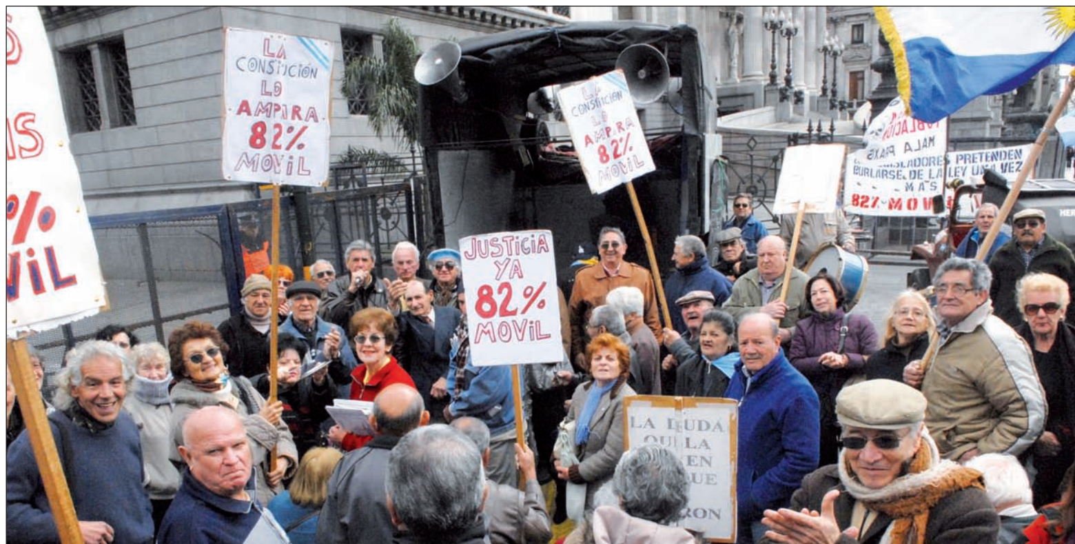
Los jubilados, por sus derechos. El Grupo Fénix, al igual que la oposición reaccionaria, pretende una jubilación asistencial un poquito más arriba que la actual

El documento de ustedes sobre el tema plantea que la jubilación mínima quede sujeta a la “afectación de las finanzas públicas”, no de las necesidades de los jubilados. Pero esas ‘finanzas públicas’ ya suponen el pago de la deuda pública y sus intereses usurarios, y los subsidios a los capitalistas