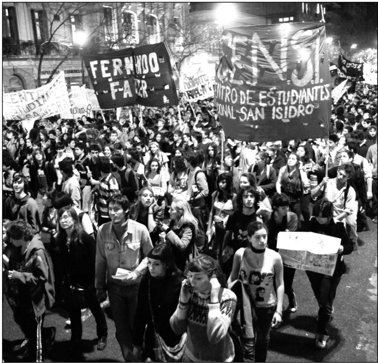
La masiva movilización del 16 de septiembre. El clima del estudiantato que recorre el país, se expresó en la gran votación de El Antídoto

En las elecciones para la renovación de las autoridades del Centro de Estudiantes de Farmacia y Bioquímica (Cefyb), desarrolladas la semana pasada, la agrupación Antídoto (Partido Obrero + Independientes) obtuvo un gran triunfo sobre La Alianza (Franja Morada), que dirigía el centro desde hace casi 20 años. Se trata de un triunfo de gran importancia debido a que la izquierda en la UBA desde el Argentinazo no lograba ganarle un centro a Franja Morada. Por este motivo, este resultado cambia la relación de fuerzas y sepulta las pretensiones de la Franja Morada y el rectorado de avanzar sobre la Fuba.