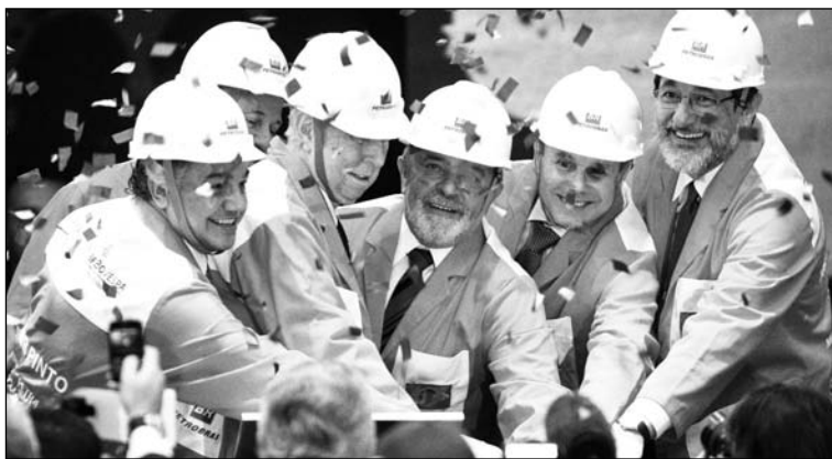
Lula en la ceremonia de emisión de acciones de Petrobras. La Bolsa de San Pablo ha pasado a ser una super-timba; una fuga de capitales arrastraría a la economía brasileña al abismo.

El costo de extracción de los nuevos pozos se ha estimado en