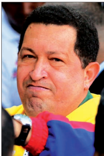
Hugo Chávez. Colaborar para que las masas organicen una alternativa de poder

Néstor Kirchner ofreció, durante su estadía en Nueva York, un balance de las elecciones en Venezuela, donde el elogio a la performance electoral del chavismo deja al descubierto una condena lapidaria al proceso bolivariano. Para el ex presidente argentino, la retención del 80% de su electorado por parte del gobierno constituye una formidable expresión de fortaleza, dadas las pésimas condiciones sociales que enmarcaron las elecciones. El chavis-