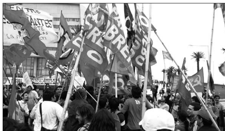
La gran lucha de los obreros. Es necesario impedir el desangre y las discusiones eternas en Buenos Aires y luchar por la nacionalización de la empresa.

Unos 70 compañeros de Paraná Metal encabezaron el piquete, que bloqueó el ingreso de autos a uno de los centros más grande de "plata fácil".