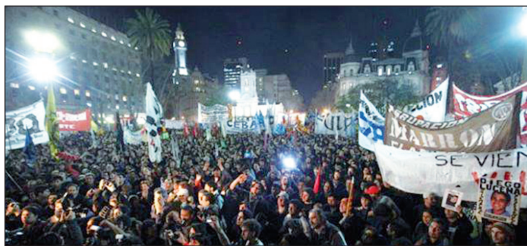
La masiva movilización que copó la Plaza de Mayo. La extensión del estudiantato pone de manifiesto el carácter del kirchnerismo y su intento de dividir y frenar el movimiento popular