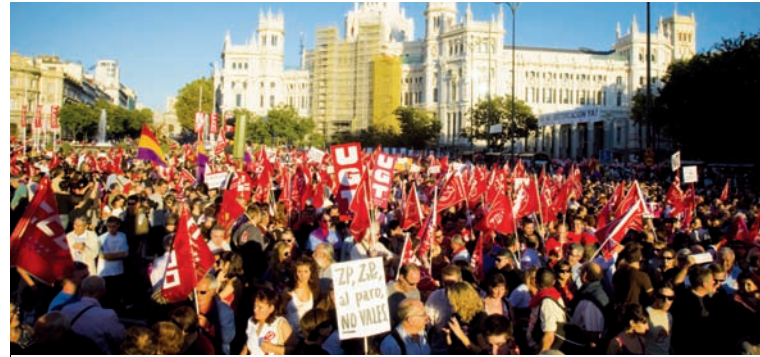
La huelga general del miércoles 29. La jornada puso de manifiesto la enorme fuerza de la clase obrera y, al mismo tiempo, la miseria de una dirección burocrática que organiza la derrota

La supervivencia de Zapatero se debe a sus acuerdos circunstanciales con los partidos derechistas de la burguesía catalana y al que ahora intenta cerrar también, unido por el espanto, con su equiva-