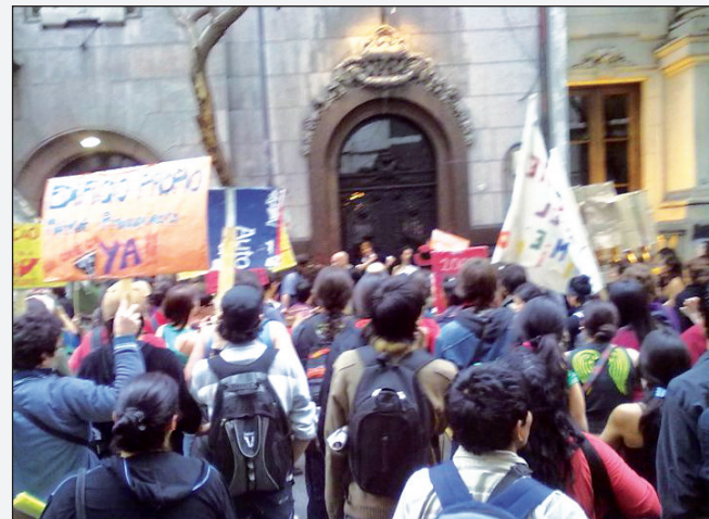
El IUNA en lucha. Cinco sedes tomadas, ahora se suma el rectorado.

Los estudiantes en lucha nos pronunciamos por la democratización de los órganos de cogobierno, en contra del vaciamiento del arte y la cultura. Decimos no a la privatización de la educación. No al cierre de las carreras y no a posgrados arancelados. No a las listas negras y basta de persecución de los estudiantes.