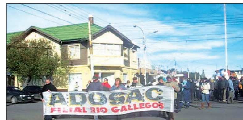
Una gran elección clasista en Santa Cruz. Ahora, la primer tarea de este reagrupamiento pasa por enfrentar la contrarreforma jubilatoria y lograr la reapertura de las paritarias.

En dos localidades (28 de Noviembre y Pico Truncado), los compañeros docentes de la Lista 3 se aprestan a disputar las elecciones