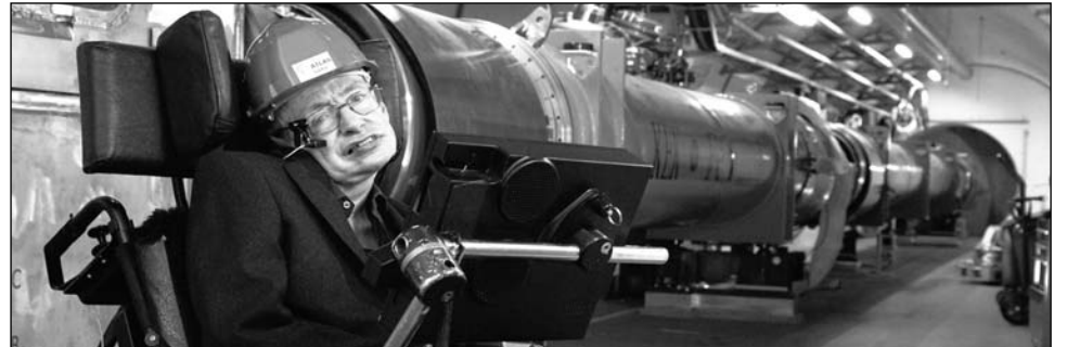
Stephen Hawking y la "máquina de Dios". La lucha contra la religión y a favor de la ciencia debe ser abordada como una lucha por la transformación social.

Stephen Hawking, el más prestigioso físico contemporáneo, acaba de plantear que la explicación del origen del universo "excluye a Dios": basta para esto con apelar a las leyes de su propia disciplina, la física. Lo hizo al lanzar su último libro, El Gran Diseño . El planteo no es novedoso. Dos siglos atrás, Napoleón interrogó a otro gran físico de su época -Pierre Laplace- sobre el lugar de Dios en el modelo cósmico que acababa de exponerle, basado en el descubrimiento de la ley de la gravedad. La respuesta fue: "Señor, no he necesitado de tal hipótesis". En aquel entonces, ninguna providencia celestial era necesaria para explicar el movimiento del Universo, aunque el propio Newton reservaba a Dios un lugar único en el diseño original del cosmos.