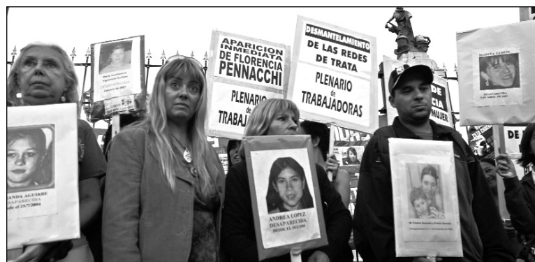
Movilización por el desmatelamiento de las redes de trata. El comercio sexual es impulsado por capitalistas, con la complicidad del gobierno y la Policía.

La Justicia —tanto de los fueros como de competencias federal y provincial— no toma ningún tipo de recaudo para prevenir estos deli-