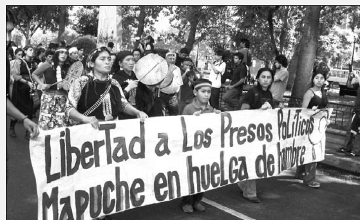
Movilización por la libertad de los huelguistas de hambre. Exigimos también la derogación de la ley antiterrorista y la desmilitarización de todas las zonas mapuches

Luego del fracaso de la reunión, se realizó una masiva manifestación de más de 3.000 personas en apoyo a los comuneros indígenas. Además, se multiplican los "ayunos solidarios" por parte de activistas, personalidades y políticos en apoyo a los comuneros. También hubo manifestaciones de solidaridad en varios países, entre ellos el nuestro, particular-