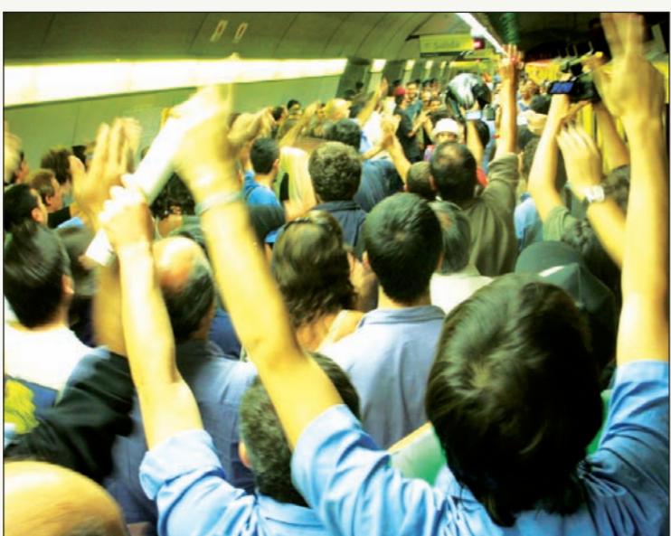
Subte: "Asi no". El fracaso del sector yaskista plantea la continuidad de la democracia obrera asamblearia y la independencia política de los trabajadores

hizo contra la burocracia de Yasky-Micheli.