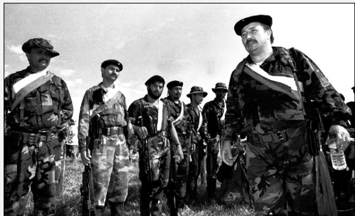
El jefe guerrillero "Mono Jojoy". Su ejecución forma parte de un plan de mayor violencia política contra los luchadores y que busca revertir el ascenso de los movimientos populares