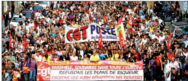
Tres millones movilizados contra el proyecto de jubilaciones de Sarkozy

Las decisiones tomadas el día 8 en la cumbre confederal van a ensanchar la brecha. El gobierno introdujo algunos cambios, ya previstos y sin importancia, para “responder a la movilización”. La Cámara de Diputados votará el proyecto del gobierno el 15 de septiembre y luego pasa al Senado para su discusión en octubre. La fecha elegida para una nueva jornada se propone influir en el voto en el Senado. Se insiste clara y explícitamente en la línea de la negociación y de la presión al Parlamento, para no cor-