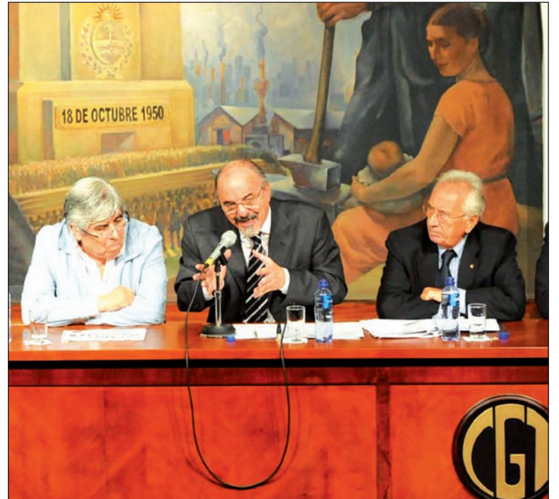
Moyano, Tomada y Recalde. Un proyecto que, además, es una cortina de humo para desviar la presión por la reapertura de las paritarias.