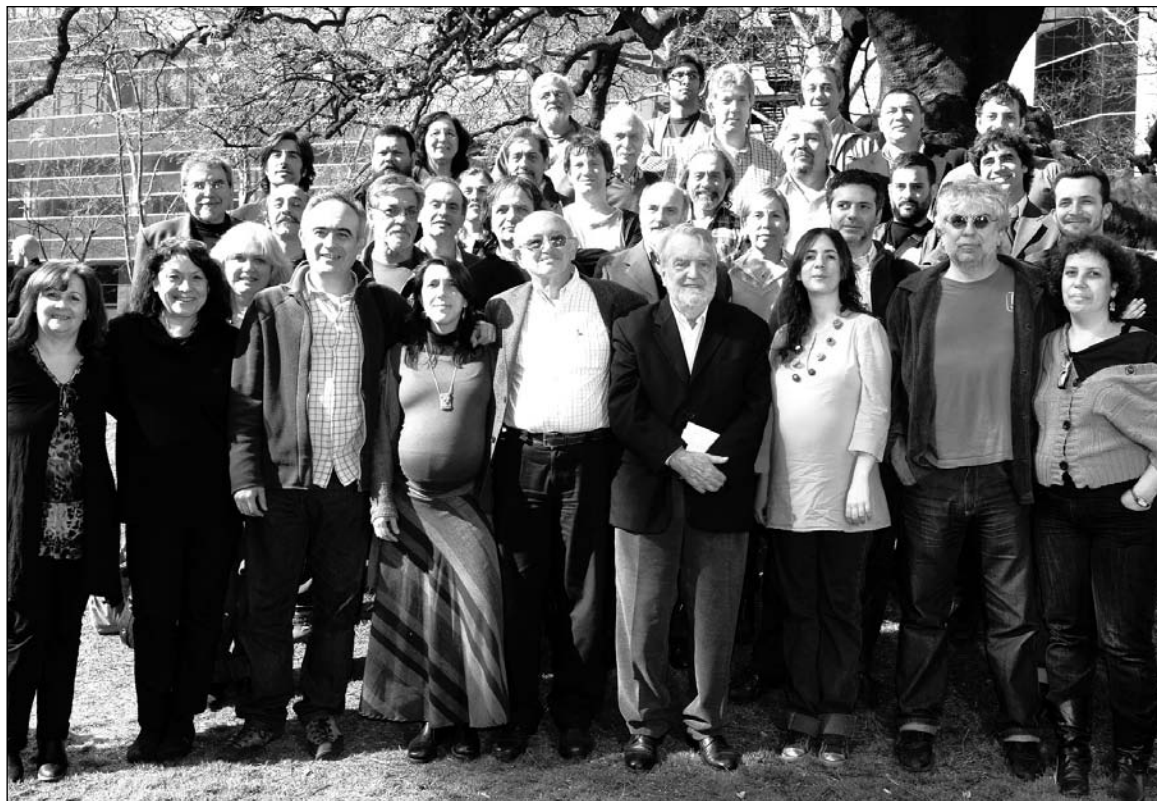
El Frente de Unidad agrupa a todas las agrupaciones opositoras y a 50 delegados de las principales empresas periodísticas.

Por su composición, el frente refleja una contradicción no superada. Conviven en su seno tanto la Naranja de Prensa como