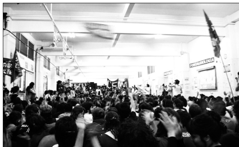
Asamblea interestudiantil del viernes 10. Más de 2.000 estudiantes votaron copar la Plaza de Mayo contra Kirchner y Macri.

La maniobra fracasó. Tanto en Filo como Sociales, masivas asambleas rechazaron las provocaciones de las autoridades, que llegaron al extremo de movilizar a funcionarios muy bien pagos y a la camarilla profesoral adicta con la intención declarada de "votar". Su derrota fue total: las tomas se ratificaron por aplastante mayoría y las facultades siguen bajo control estudiantil. Las agrupaciones estudiantiles que les responden (UES, Evita, PCCE, Cámpora, PC-Insurrexit, y sigue la lista) debieron irse con la cabeza gacha.