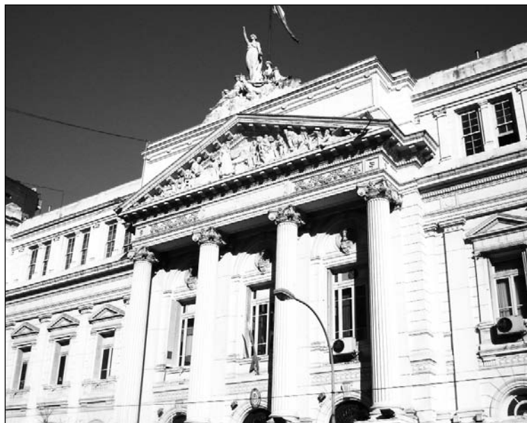
Facultad de Ciencias Económicas de la UBA. Los suscriptores del Plan Fénix, justificadores del robo a los jubilados, deberían devolver sus diplomas y volver a las aulas.

Los suscriptores del Plan Fénix deberían, además, devolver sus diplomas y volver a las aulas. Ocurre que el capital ya recaudó el dinero que deben cobrar los jubilados cuando estos eran trabajadores activos. En efecto, la jubilación no es más que un salario que se cobra en forma diferida. Si no hubiera sistema previsional, esas jubilaciones se deberían pagar dentro del salario corriente, para que el trabajador las ahorre con vistas a su sostenimiento luego de finalizar su vida laboral. El patrón retuvo ese dinero en su momento, lo depositó en una Caja y ahora la Caja no quiere pagar. Es lo que ocurre también con los impuestos al consumo, que el capitalista recauda pero luego no deposita. O sea que, cuando no se reconoce el 82% se está produciendo una confiscación directa de los salarios acumulados.