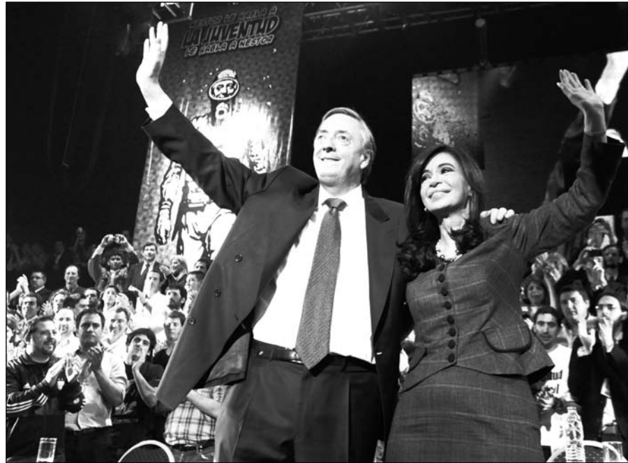
Los K, en el acto del Luna Park. Quieren "re-peronizar" a una juventud que se ha desperonizado; en vano, un masivo movimiento juvenil comienza a levantarse contra el Estado

Hay que tener en cuenta que el aumento de la recaudación, debido al aumento de los precios, tiene lugar con un dólar 'planchado', o sea que también aumenta en dólares, la divisa en la que está registrada la mayor parte de la deuda externa. La prórroga por decreto del actual presupuesto, ante el impasse que existe en el Congreso, no