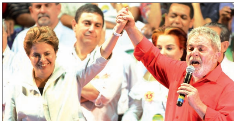
Dilma Rousseff, la candidata de Lula. El programa de la burguesía es el mismo que el del gobierno, por eso prefiere no cambiarlo.

A pesar de que las políticas de Lula favorecieron al gran capital