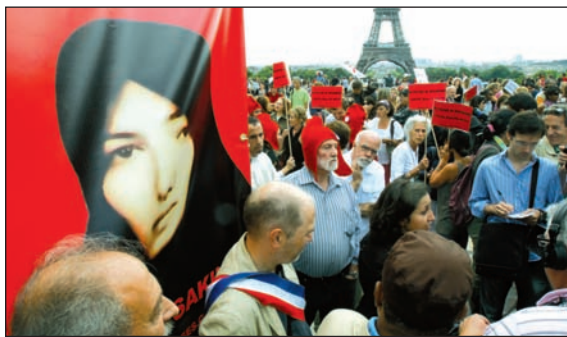
En París. Una de las tantas movilizaciones por su libertad