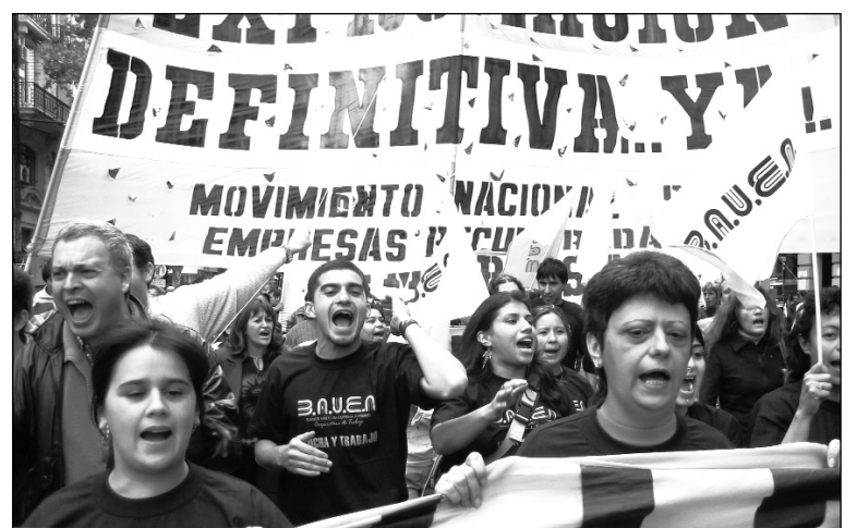
Trabajadores del Hotel Bauen. La sentencia de la Cámara reclama una acción de conjunto y común de las empresas bajo gestión obrera.

Hasta la reforma de la Ley de Quiebras está paralizada en el