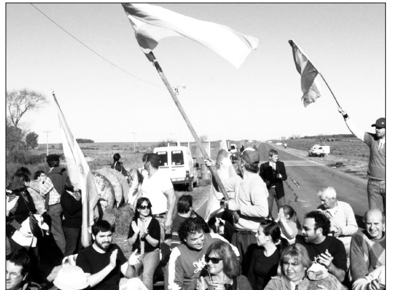
La Asamblea retoma la lucha. Proponemos un encuentro nacional de organizaciones sociales y políticas para discutir su continuidad.

La creación de apuro de más de 60 aserraderos en la zona norte de Uruguay fue una respuesta para cubrir la enorme voracidad de la producción. Los mismos, en su gran mayoría, tienen condiciones muy precarias de seguridad de sus trabajadores, bajo la mirada permisiva del gobierno de Mujica. Los también "despreciados" ambientalistas uruguayos denuncian que los trabajadores forestales en su gran mayoría son contratados por empresas tercerizadas, que utilizan los principales proveedores de made-