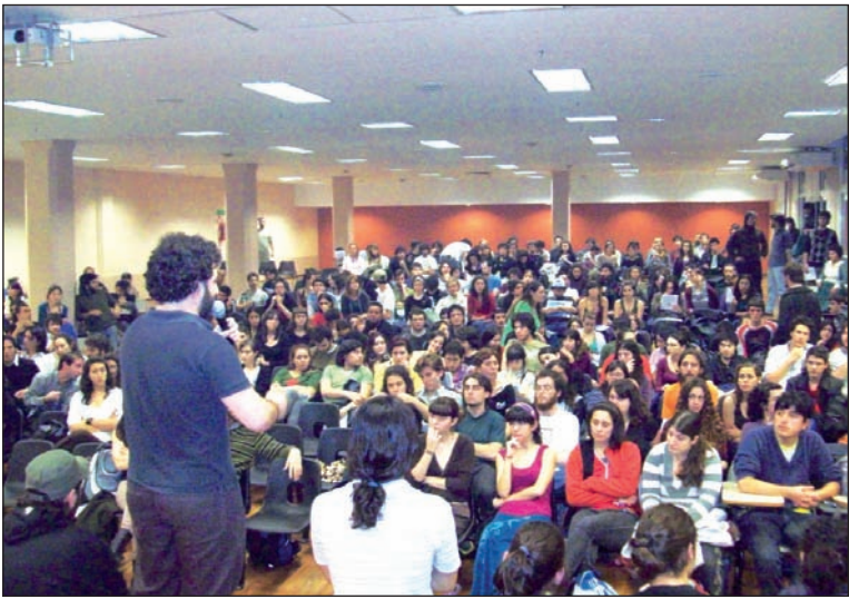
Filosofía y Letras, también. Ya son cuatro las facultades tomadas.

Al cierre de esta edición de Prensa Obrera , el "estudiantazo" es una realidad en ascenso. Día tras día, nuevas escuelas secundarias se suman a la lucha. La política de Macri, que pretendió dividir al movimiento otorgando obras sólo para algunos colegios para "mandar a la casa" a los chicos, fracasó por completo. La rebelión educativa crece y no son únicamente los secundarios. Es que la UBA, cuyo presupuesto no depende de Macri sino de Kirchner, también sufre problemas edilicios de gravedad. Con el estudiantazo de los "secus" en curso, sólo hacía falta una chispa que encendiera un bosque plagado de reivindicaciones. Así, la Facultad de Ciencias Sociales inició una ocupación de las tres sedes que al día de hoy lleva una semana (ver nota). El martes se han sumado a las tomas tres facultades, cada una con sus reclamos: Filosofía y Letras, Arquitectura e Ingeniería. El Iuna también está luchando con ocupaciones y movilizaciones.