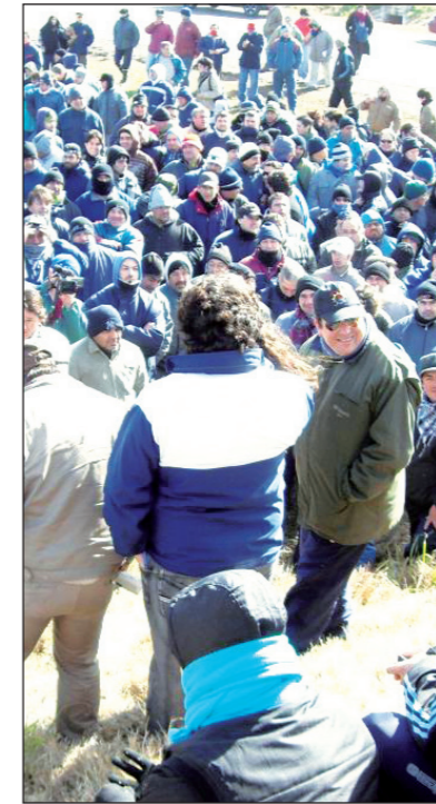
Continúa el corte de la autopista Buenos Aires-Rosario. El "posibilismo" a tocado fondo, tenemos que profundizar la lucha

Ahora, los esfuerzos tienen que estar puestos en colocarlo en primera plana. Para ello hay que continuar con el corte de la autopista por tiempo indeterminado. Reclamar