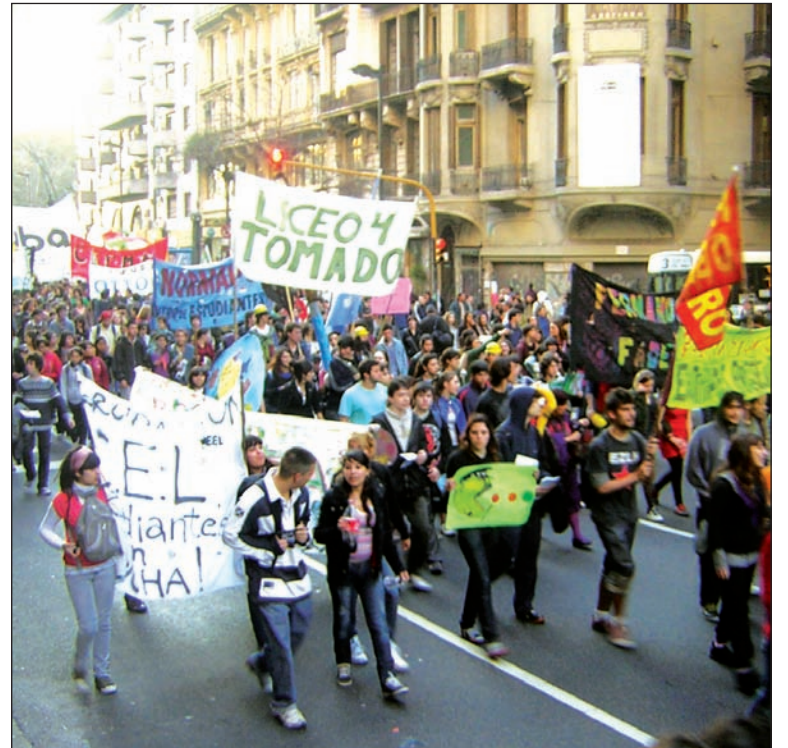
La masiva movilización del viernes 6. El 16, vamos por una gran jornada de lucha en todo el país

En este cuadro se dará la marcha nacional educativa que convocan la Conadu Histórica y la Fuba. Esta movilización, que irá desde Congreso hacia Plaza de Mayo, tendrá lugar en el momento justo, pues la lucha de los secundarios ha puesto de manifiesto una crisis estructural de la educación pública como consecuencia directa de la política de los gobiernos capitalistas. Es el régimen de los Kirchner y los Macri: desmantelaron la educación estatal en beneficio de la