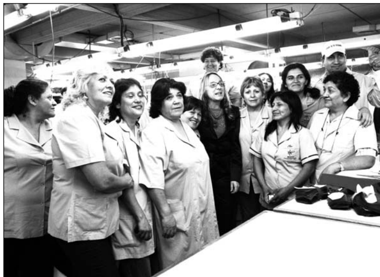
Alicia Kirchner, en una visita a la fábrica Bruckman. La autogestión no puede escapar a las leyes del capitalismo y, por lo tanto, a la explotación capitalista.

Tampoco es cierto que en la autogestión “no exista el costo empresario”, porque los ingresos, según el autor, “sólo se distribuyen entre los socios trabajadores en forma de retiros”. Esto fue refutado por Marx hace 140 años (“Crítica al Programa de Gotha”): en toda forma social de producción es necesario apartar recursos para aumentar la capacidad de producir. Las ganancias del capital no son ‘costos’, ni tampoco la parte que el capitalista reserva para su consumo conspicuo o para especular en el campo financiero. Las ganancias son las diferencias entre los ingresos, de un lado, y los costos del otro; por eso el capital procura bajar costos. Al eliminar el salario por el ‘retiro’, el mismo autor convierte a los cooperativistas en capitalistas que ‘retiran’ su parte del beneficio, o sea que su ‘solidaridad’ no es la del obrero frente al capital sino entre capitalistas (cooperativos). En el caso de cooperativas que trabajan para