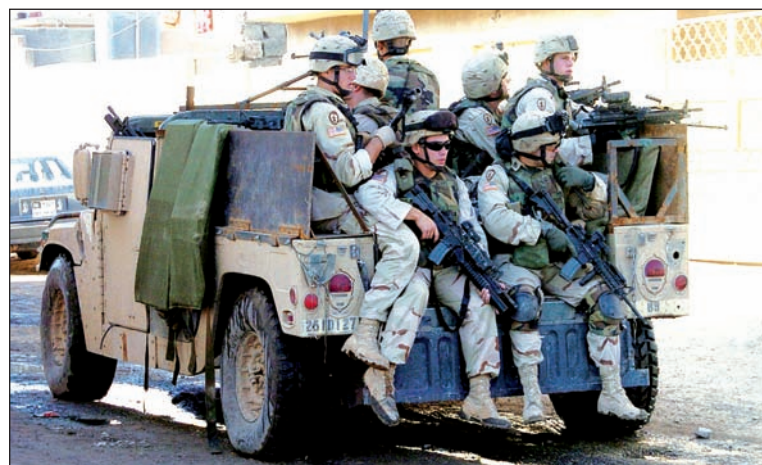
Soldados norteamericanos patrullando Bagdad. Obama refuerza la presencia en Afganistán y protagoniza una "retirada" sin futuro en Irak; un pantano cada vez más profundo

Durante el anuncio del retiro de tropas, Obama afirmó que "la violencia en las calles de Irak está en un mínimo histórico" respecto de 2007. Horas después, el propio gobierno iraquí informó que en julio, con 535 muertos, en su mayor parte civiles, fue el más luctuoso de los últimos años. La sucesión de 20 atentados coordinados en 10 ciu-