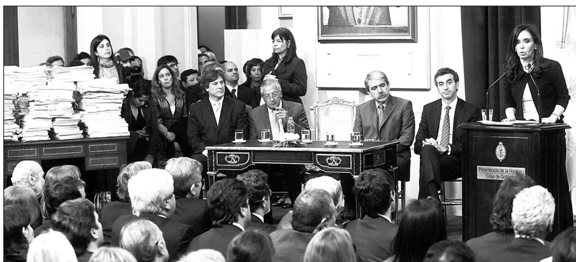
Cristina Kirchner presentando el informe sobre Papel Prensa.

De cualquier manera, un ejercicio efectivo de la supervisión de la producción de papel por parte de una comisión del Congreso no cambiaría un ápice la situación económica de la industria (salvo la de producir una caída más o menos prolongada de la cotización de las empresas respectivas en las Bolsas), ni tampoco afectaría al monopolio capitalista de prensa, información y expresión -con todo lo que ello implica en términos de censura y de manipulación de la información. Para que esta supervisión fuera efectiva, sería necesaria la abolición del secreto comercial, un 'derecho' concomitante al de propiedad. La presencia de "observadores" del parlamento en las reuniones de los directorios de las empresas, en cambio, no afectaría la posición dominante de los accionistas controlantes ni los pactos societarios que están permitidos por la ley y consagrados en los estatutos de las compañí-