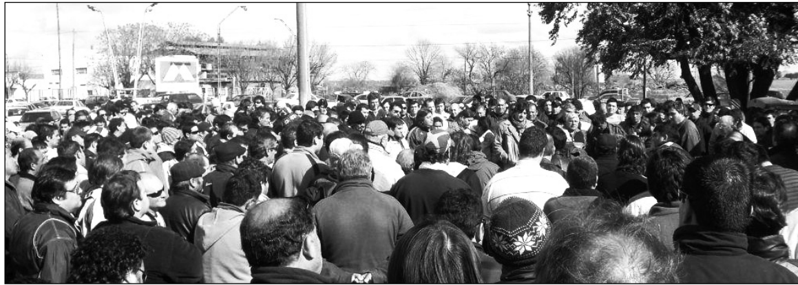
Asamblea de los trabajadores de Paraná Metal. El gobierno nacional y el provincial pueden y deben hacerse cargo de la fábrica y realizar las inversiones necesarias en función del desarrollo nacional, y para defender la fuente laboral.

Por su parte, la directiva de Piccinini explicó las alternativas que, a su entender, estarían planteadas en el conflicto. Esto es "la estatización de la empresa, la transformación en una cooperativa obrera o mixta, o que finalmente