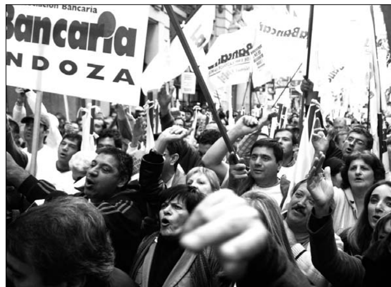
Movilización de los bancarios. Hay que llevar el reclamo a todo gremio que haya firmado por menos del 35%

La docencia universitaria va al paro nacional el 26 de agosto con la Conadu Histórica, que no firmó