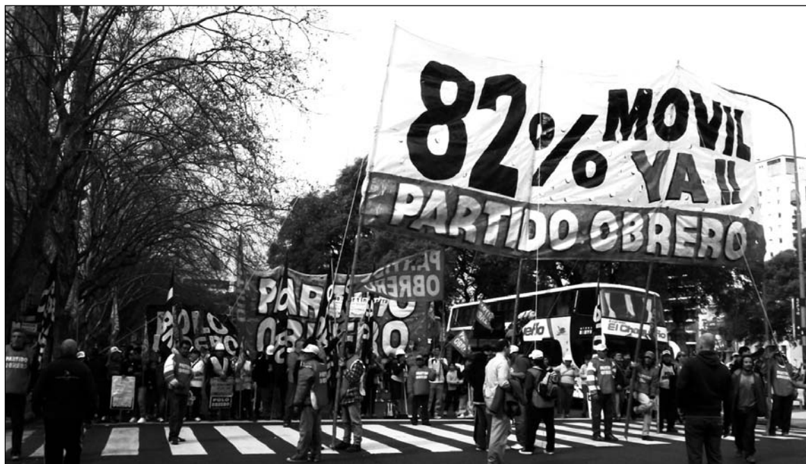
El PO, en la calle por el 82 móvil. Lograrlo exige vencer la feroz resistencia capitalista, que quieren seguir medrando con los fondos de la Anses.

Además de aportes y contribuciones, la Anses recibe impuestos y el 15% de la coparticipación de las provincias, con lo que se justificaría que pague los Repro, la asignación por hijo o las jubilaciones de amas de casa. Pero la Anses recibe esos fondos porque fueron aprobados en los años '90 en compensación por la reducción de los aportes patronales y porque la Anses pasó a cubrir el déficit de las cajas provinciales transferidas y no transferidas. ¿De dónde sale si no de la Anses la plata para cubrir el déficit de la Caja de jubilaciones Santa Cruz provocado por los bajos aportes patronales?