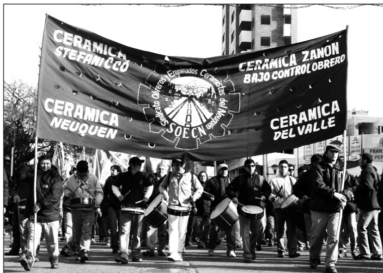
Obreros de Cerámica Zanón. El porvenir de la fábrica se dirime en un escenario más general, donde debe intervenir el conjunto de la clase obrera y del movimiento popular

El problema crucial es, sin embargo, la obsolescencia industrial. Continuar produciendo con