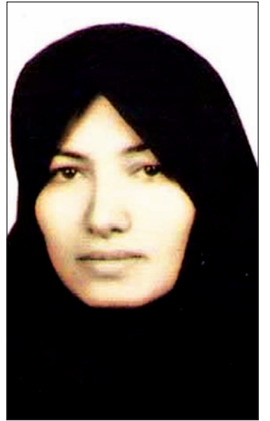
Sakineh Mohamadi Ashtiani.

La iraní Sakineh Mohamadi Ashtiani, de 43 años y madre de dos hijos, fue condenada a morir lapidada por adúltera. En el juicio, en 2005, Ashtiani fue absuelta del cargo de homicidio, pero la semana pasada la llevaron a la televisión y “confesó” que había matado a su marido. Estas confesiones públicas suelen preceder a la ejecución. Irán rechazó una oferta de asilo de Lula y sugirió que tal vez sustituya la lapidación por el ahorcamiento.