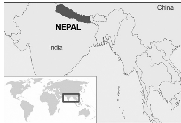
Nepal, China, India y Bangladesh: guerras civiles y levantamientos obreros. La región puede convertirse en un epicentro de una crisis revolucionaria internacional.