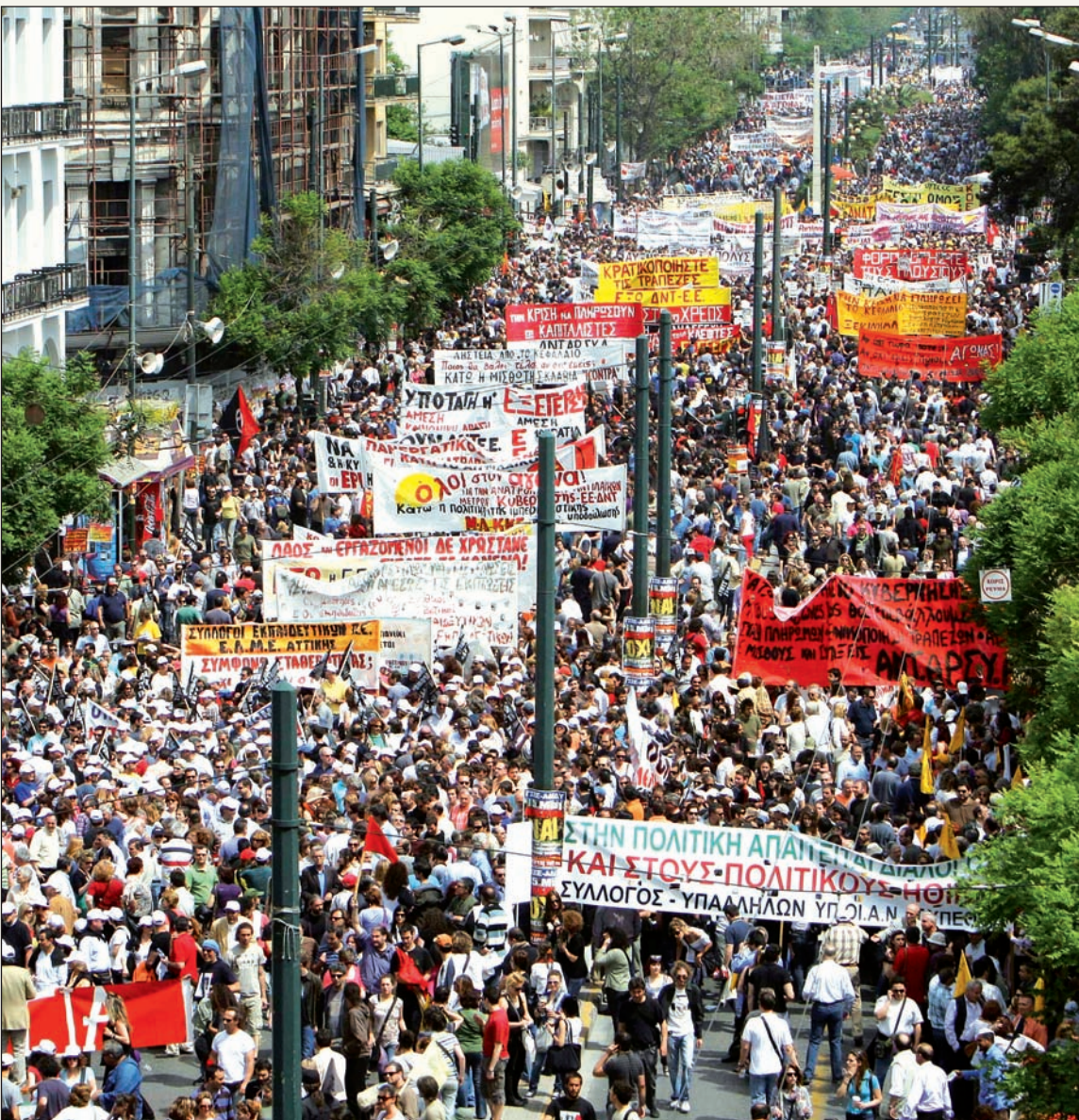
Movilización contra el ajuste en Grecia.

L a crisis capitalista mundial ha entrado en su cuarto año.