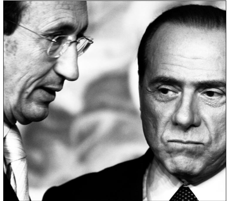
Gianfranco Fini y Silvio Berlusconi. Con la ruptura del partido gobernante, en el marco de la crisis capitalista internacional, el régimen político entero ha llegado a su estación terminal.

Vista de conjunto, la situación italiana es la de un volcán en ebullición. En el marco de la crisis capitalista internacional, se procesa un virtual desmantelamiento industrial, un desplazamiento de las organizaciones patronales y de las burocracias sindicales —todo ello