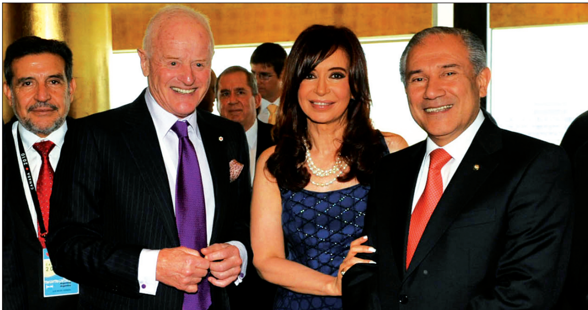
Cristina Kirchner con los representantes de Barrick Gold. Hacia 2011, no escatimará conquistar el apoyo de los capitalistas más poderosos. Cuando se ha vuelto a reactivar el centro de la crisis, hay que ganar la atención de las masas en función de una respuesta a la bancarrota capitalista.

destacar la mejora de los mercados de bonos de deuda de Argentina —la famosa bicicleta financiera. El Banco Central, como en lo mejor del cavallismo, se endeuda para que el dólar no caiga.