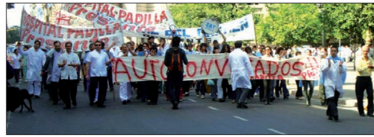
Autoconvocado de la salud. Delegados de su ala más consecuente integran la lista 3