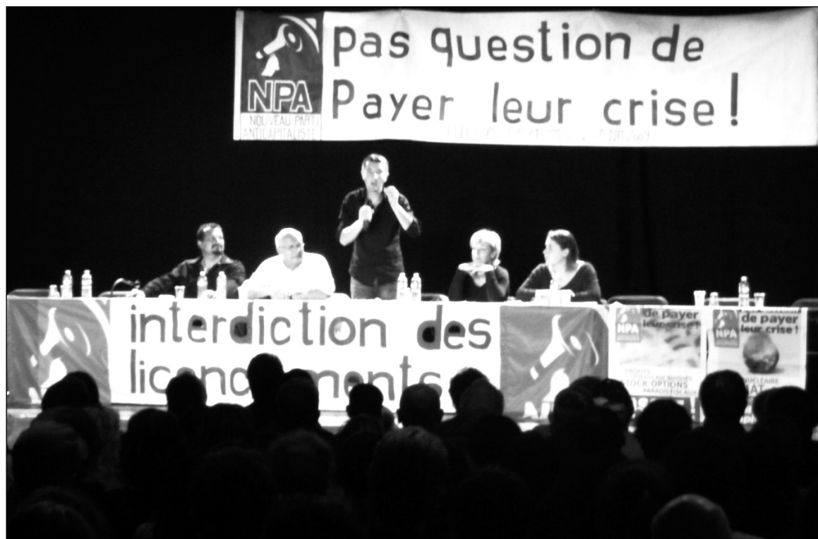
Olivier Besancenot en un encuentro del NPA. Para evitar la desmoralización de la militancia, hay que luchar por un reagrupamiento revolucionario

En el marco de la dislocación actual del NPA (para cuya comprensión más general conviene la lectura de la Resolución Política del Secretariado Internacional de la CRCI y en particular el punto 9, "La izquierda en el laberinto de la bancarrota", publicada en la última edición de En defensa del marxismo ), se ha constituido un agrupamiento de izquierda (ex plataforma B). En el momento del debate sobre las elecciones regionales,