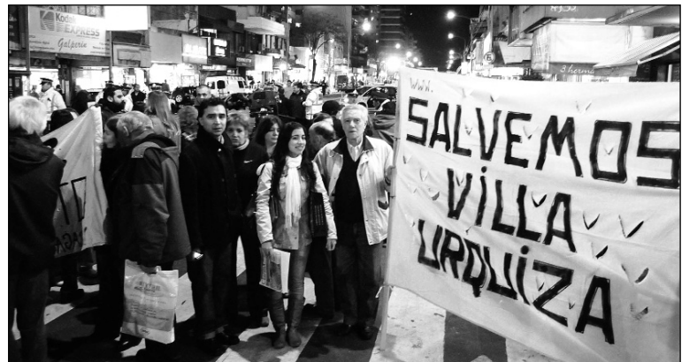
Urquiza movilizada por el castigo a los culpables. Toda la Capital es una zona liberada para los negociados inmobiliarios que juegan con la seguridad y la vida de las personas

Según la Uocra y la Defensoría del Pueblo de la Ciudad "ante una denuncia de riesgo inminente, la inspección y la clausura debe ser inmediata hasta tanto se lleven a cabo las medidas correspondientes, precisamente por el riesgo que implican estas situaciones para la vida de las personas" (ídem). En tal caso el derrumbe no se habría producido. Pero el Gobierno de la Ciudad actuó de manera opuesta. Macri dice que los inspectores de