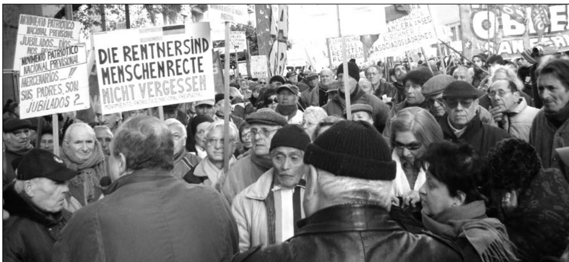
El Partido Obrero se movilizó el 4 de agosto al Congreso en defensa del 82% móvil y denunció las maniobras del oficialismo y de la oposición para frustrar este reclamo.