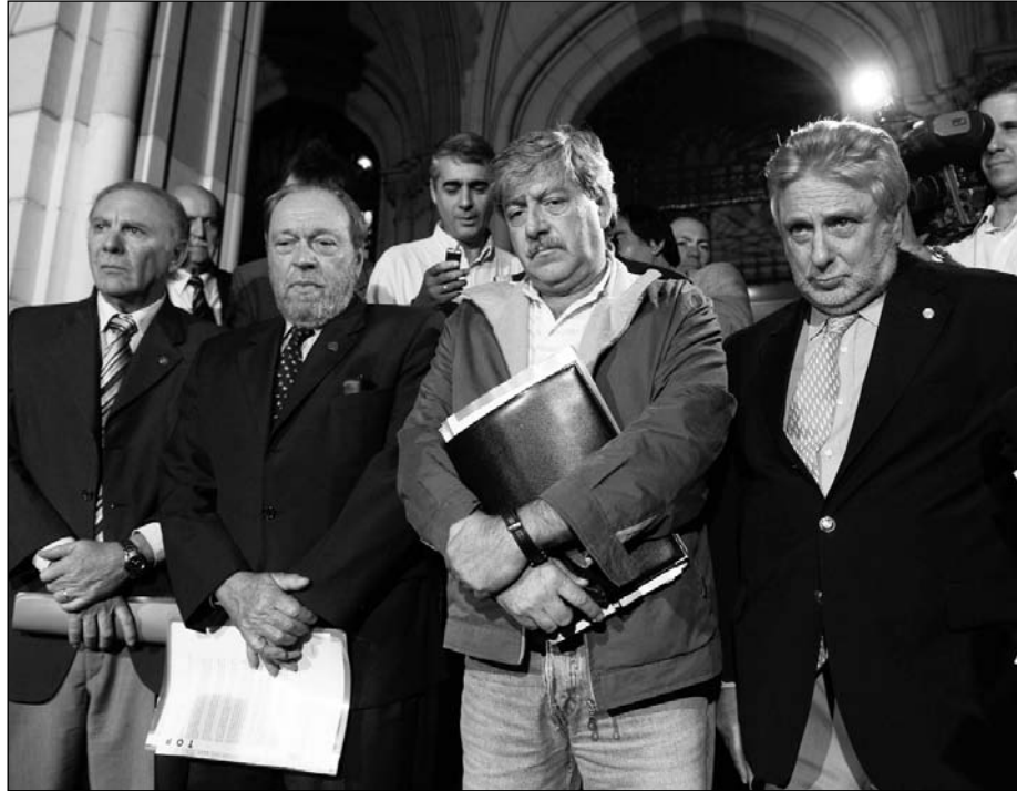
La Mesa de enlace en el Congreso. El gobierno, con la baja de las retenciones y el aumento de las tarifas, marcha hacia una economía dolarizada, insosteniblemente cara para los trabajadores.

No es cierto, como se puede ver, que la división en la burguesía agraria (y entre sus partidos políticos) sea, como dicen los diarios, "la segmentación", sino que este caso no prevé ninguna rebaja de las retenciones a la soja para los capitalistas