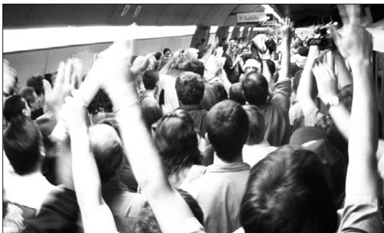
Asamblea durante el último paro. En el subte se forjó sindicalismo independiente, combativo y democrático; ahora montan maniobras para quebrarlo en tanto alternativa.

que la incorporación a la CTA ofrece al sindicato un paraguas protector, aún más si forma parte del acuerdo Yasky-Moyano. En momentos en que las dos listas de la burocracia de la CTA se han enfrascado en una lucha por la verificación de padrones y de garantías contra el fraude en las próximas elecciones, ninguna de ellas ha cuestionado la afiliación inconsulta y sigilosa de los trabajadores del subte, ni tampoco lo ha hecho la UTA o la CGT. Da la impresión de que la protección en cuestión tiene unanimidad en las cúpulas. ¿Sorpresa? No, porque como ya lo estableció un acta firmada en el Ministerio de Trabajo, el sindicato del subte gozará de todos los reconocimientos de forma pero ninguno de los concretos —como el derecho a negociar salarios, ascensos, bolsas de trabajo o a la huelga. Lo que se ha conseguido, siempre en el papel, es una tregua contra las provocaciones de la burocracia de UTA. Pero semejante protección vale también para esta burocracia, que podrá seguir su trabajo de socavamiento del nuevo sindicato en los talleres y líneas