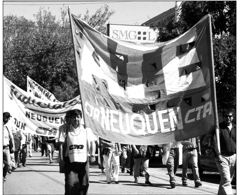
Movilización en Neuquén. La integración de la burocracia de la CTA al capitalismo y al Estado, es una expresión de su quiebra política (y viceversa) y obliga a plantear abiertamente la necesidad de una alternativa.

La división de la burocracia de la CTA está dando lugar a un conjunto de realineamientos de cara a las elecciones de la Central, como ocurre por ejemplo en Neuquén.