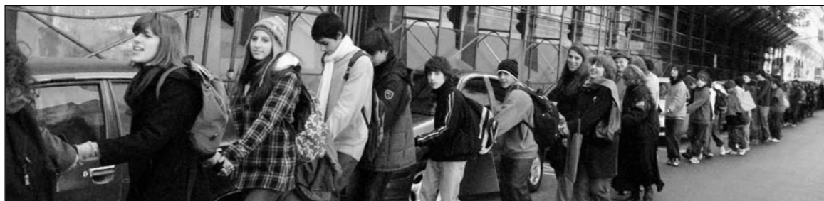
“Abrazo” al Nacional Buenos Aires. La movilización de los preuniversitarios puede ser el puntapié para un alza general del movimiento secundario.