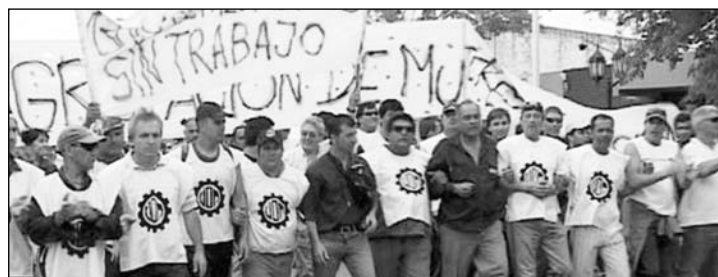
Otra orientación. Es necesaria una lucha decisiva de todo el gremio metalúrgico

En esta línea de provocaciones, sacó solicitudes en los medios de prensa desmintiendo las denuncias de los trabajadores y no cumplió las cuestiones que acordó en el Ministerio de Trabajo. De esta manera, no hizo efectivo el pago de los sueldos con la nueva escala salarial acordada en la paritaria metalúrgica. No devolvió los Repro descontados en la segunda quincena de mayo. Tampoco abonó los feriados de mayo ni hizo efectivo el pago no remunerativo de 1.350 pesos acordados en la paritaria de 2009.