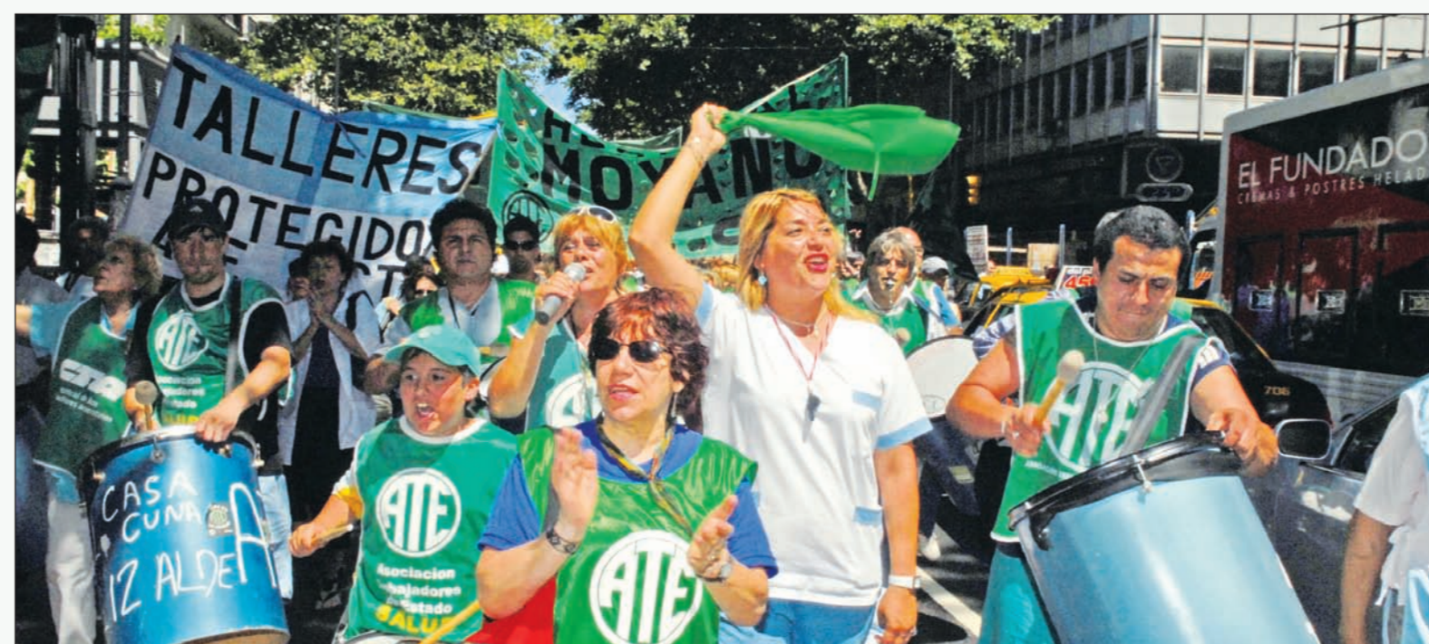
Movilización de trabajadores estatales. Yasky, con la complicidad de la fracción de De Gennaro, está llevando a la disgregación a la CTA; la participación de los clasistas en la elección de la central debe servir para preparar las condiciones (programáticas y organizativas) para que las bases sindicales puedan derrotar a la burocracia.

te con la fracción de De Gennaro contra la de Yasky en las próximas elecciones de la CTA, ha apoyado el ingreso del sindicato del subte en la CTA, en un frente único con la fracción de Yasky (pianellismo), en otro caso más de su absoluta falta de principios y de su oportunismo ilimitado.