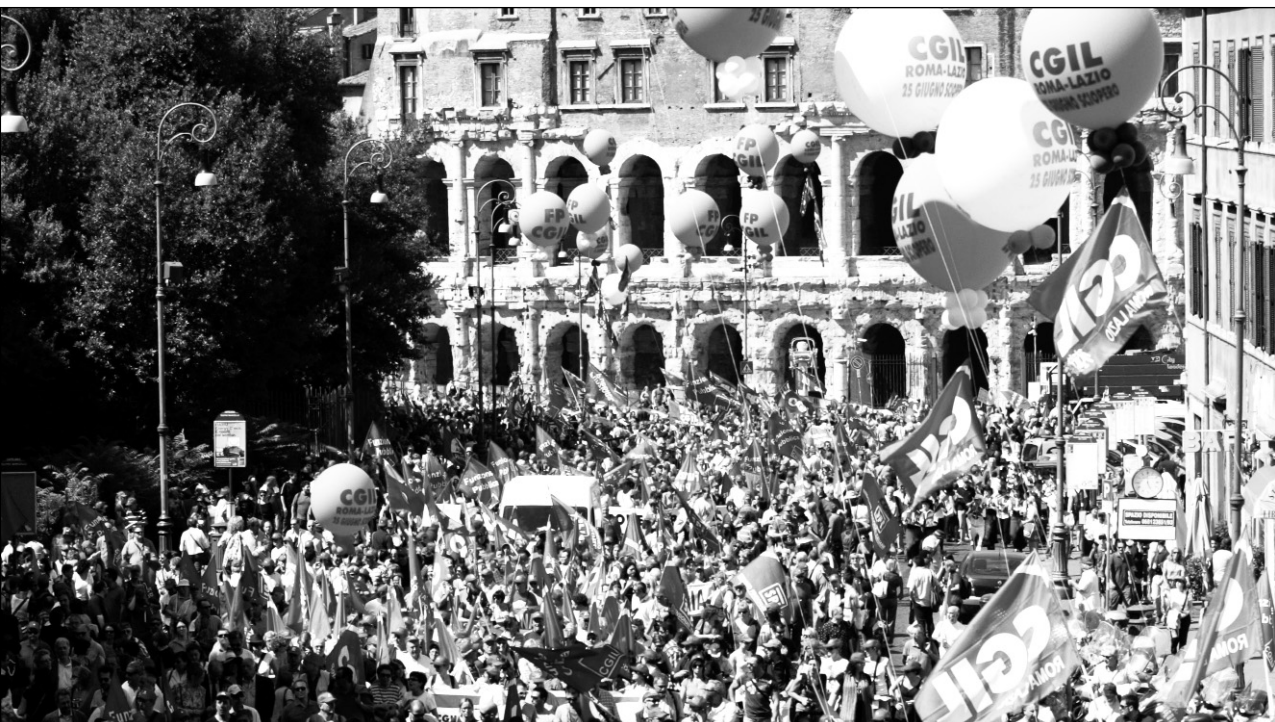
Arriba: Movilización de los trabajadores españoles contra el plan de ajuste y el aumento de la edad jubilatoria. La crisis en Europa mostró que el derrumbe mundial no se compone sólo de recesiones, despidos y quiebras, sino de colapsos que incluyen a los Estados y las uniones estatales.