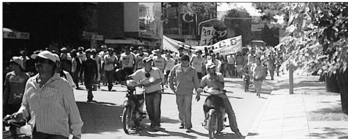
El Movimiento Clasista y Combativo durante una jornada nacional de lucha. Los compañeros están desarrollando una experiencia política revolucionaria, a partir de entender al movimiento piquetero como parte integral de la clase obrera

Estas cooperativas, sustitutas de un verdadero plan federal de viviendas financiado y ejecutado por el Estado, con trabajadores bajo convenio y en blanco, fueron un ar-