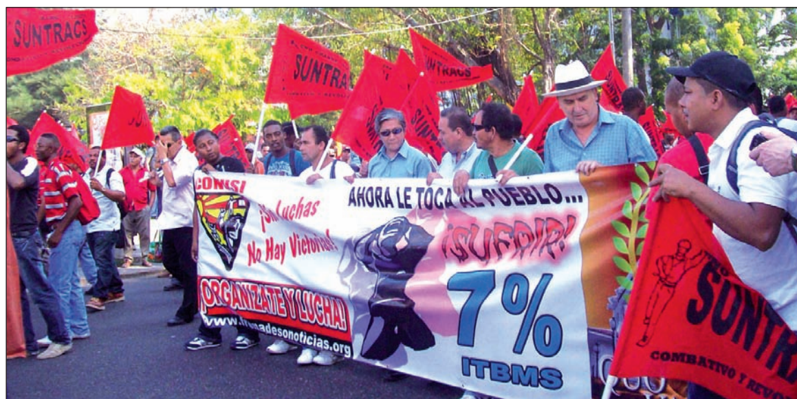
Contra la criminalización de las protestas. El pueblo panameño continúa luchando.

La huelga afectó principalmente a la construcción y la enseñanza pública y privada, y la suspensión algunas actividades de la industria. En la construcción, Genaro López, secretario general del Sindicato de Trabajadores de la Construcción y Similares (Sun-