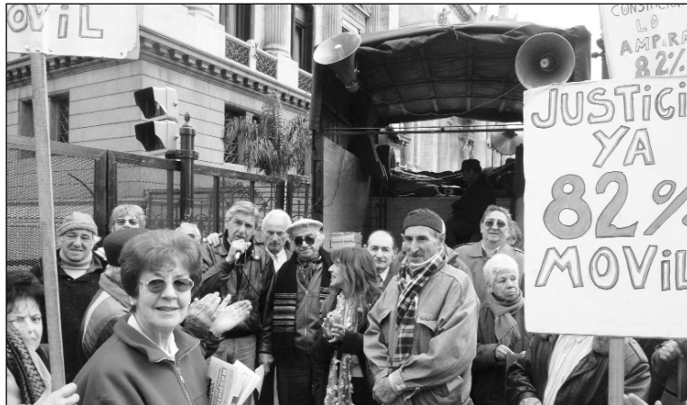
Jubilados en Plaza Congreso por el 82% móvil. Después de haber hecho abundante demagogia, la oposición patronal aceptó que la jubilación siga siendo una prestación asistencial

Según los medios, los senadores votaron este proyecto "en desafío" al gobierno, que concurrió, a través de Boudou, a exponerle al parlamento la "inviabilidad" del aumento jubilatorio. Pero, en verdad, lo que hicieron fue adaptarse a las exigencias kirchneristas. Del aumento jubilatorio, sólo queda en