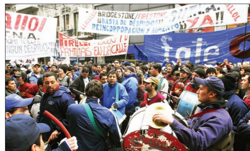
Obreros del neumático, durante el conflicto de 2008. Ha llegado el momento de no depender de la inacción de la burocracia, y que los cuerpos de delegados y sindicatos combativos den un paso al frente

A mediados de abril, una asamblea en Fate votó la exigencia del adelantamiento de la paritaria y la exigencia al Sutna de un plan de lucha por el 35% de incremento salarial. Días después, la burocracia de Pedro Watsiejko hizo pública la exigencia de un 37% de aumento. Hace más de dos meses se establecieron las negociaciones, y hubo siete audiencias en las que las patronales nunca superaron una propuesta del 24% real de incremento.