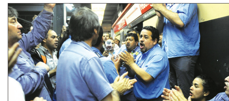
Subte. No será por la vía de una integración ortopédica a la CTA que se solucionarán los reclamos de sus trabajadores

En un plenario al que asistió poco más de la mitad de los delegados de la Asociación Gremial de Trabajadores del Subte y Premetro (AGTSyP), el sector del nuevo sindicato alineado con Yasky (y con el MST) forzó, en una votación de 29 a 16, el ingreso en la CTA. La resolución se tomó sin un debate en las bases y divorciada de cualquier propuesta de lucha por los reclamos de los trabajadores del sector.