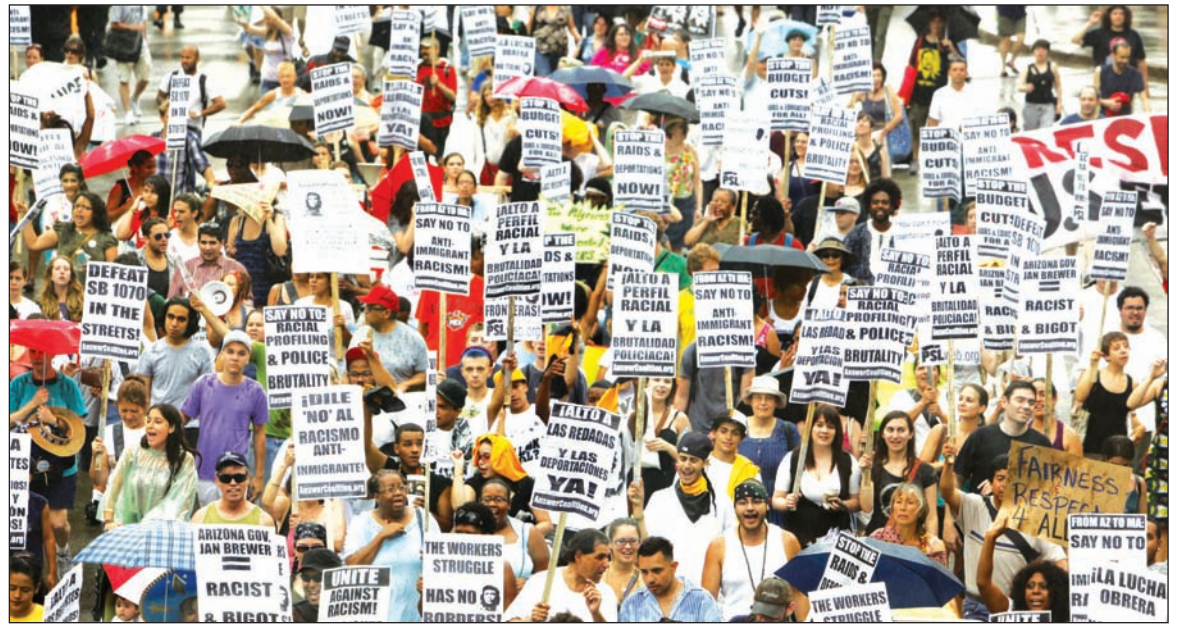
Movilización contra la ley anti-inmigrantes de Arizona. Los inmigrantes son un pilar esencial de la economía pero, al mismo tiempo, una fuente de conflictos sociales, creando un movimiento que muchos comparan con el movimiento por los derechos civiles de la década de 1960.

A despecho de los reclamos derechistas, Estados Unidos no puede darse el lujo de prescindir de los trabajadores inmigrantes no regularizados (12 millones de personas). Es que proporcionan casi toda la mano de obra agrícola, y cubren gran parte de los empleos de menor calificación. El flujo de inmigrantes en Estados Unidos ha causado un descenso de más del 3% en los salarios que se ofrecen para estos puestos de