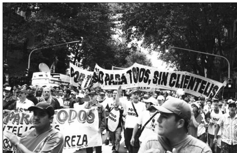
"Trabajo para todos, sin clientelismo". El gobierno armó el plan "Argentina Trabaja" para destapar la olla a presión de la bronca popular por la desocupación, y para rearmar el aparato de punteros

En Tigre, como en casi todos los distritos del conurbano, la inscripción para los AT se hizo en dos etapas. En la primera, fueron inscriptas las cooperativas de los amigos de los K (Movimiento Evita), en la segunda —acampes y plan de lucha mediante— las de las "organizaciones sociales", como gustan decir en el municipio. Aquellas ya están trabajando e, incluso, están amparadas por un plan de Obra Social armado entre la Uocra y el Municipio de Tigre. Las cooperativas de las organizaciones piqueteras no tienen tareas asignadas y están vegetando en los lugares donde se re-