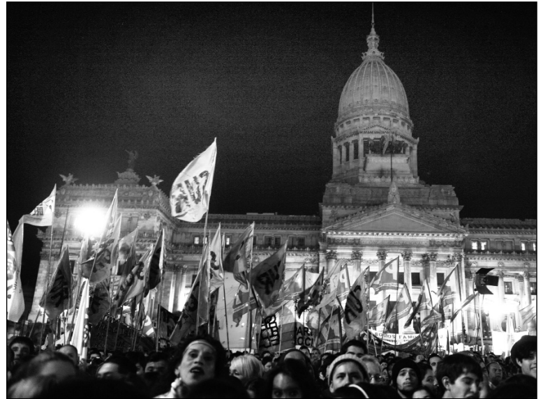
Movilización por el matrimonio entre personas del mismo sexo. Los K acabaron capitulando ante el clero, demostrando así que su llamado proyecto de transformación no existe.

obligó a la Corte a emitir fallos a favor del reclamo de los jubilados, aunque evitando extenderlos al conjunto de ellos; con eso procura evitar el pago de las retroactividades a los jubilados afectados por el congelamiento de sus haberes y evita establecer el 82% móvil del último salario cobrado (incluidos los ítems no remunerativos) para el conjunto de los jubilados.