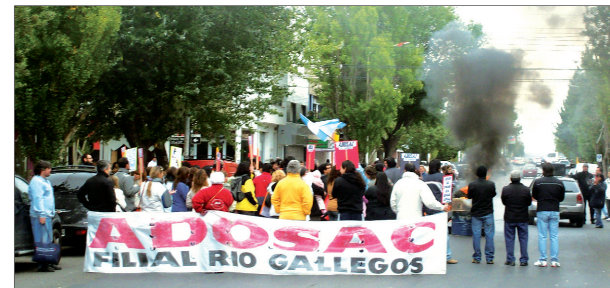
Movilización de Adosac, en 2009. Es necesario poner en pie de lucha nuevamente a nuestra organización gremial.

El panorama en docentes de Santa Cruz es preocupante: después de que Adosac firmara uno de los acuerdos salariales más bajos del país (lo cual la puso en el campo de las paritarias pactadas por Yasky con los K), con la promesa de "reabrir" la paritaria el 22 de junio, ahora el gobierno patea la discusión salarial prometida hacia adelante (confirmando el pronóstico de nuestro artículo anterior, ver PONº 1.125, 22/4), y avanza incluso por encima de la paritaria en la aplicación de la Nueva Ley de Educación, que incluye reformas laborales contra maestros y profesores, y el riesgo cierto de una pérdida de puestos de trabajo en perjuicio de los profesores que se desempeñan en horas cátedra.