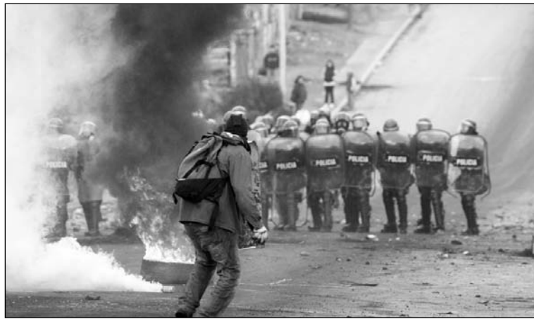
Escena de la represión en Bariloche. Se está preparando el terreno para absolver a los responsables materiales y políticos.

Los familiares de los tres chicos exigen las renunciaciones del gobernador