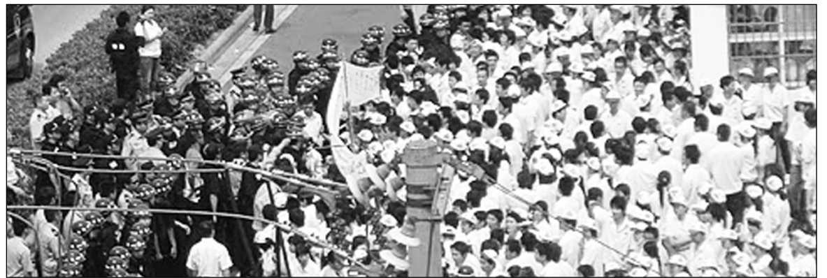
Huelga en fábrica de autopartes china. La maduración de la vanguardia se desarrolla al ritmo acelerado que marca la crisis mundial.

La reciente ola de huelgas obreras en China ha recibido más atención y mejor tratamiento en la prensa financiera de la gran burguesía internacional que en las publicaciones de la izquierda, con la excepción de Prensa Obrera . Los apologistas del capital no se equivocan cuando advierten la trascendencia de las huelgas que estallaron en el corazón industrial de China. Su perspicacia se redujo notablemente, eso sí, cuando intentaron explicar este ascenso obrero como una consecuencia de la disminución relativa de la población de jóvenes que ingresa el mercado de trabajo —producto de las políticas oficiales de control de natalidad— luego de los planes de "estímulo" oficiales de los últimos años. "En conjunto, estos efectos han llevado la oferta de trabajo