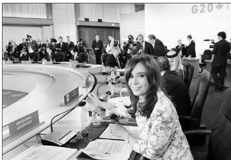
Cristina Kirchner en la cumbre del G-20. Luego aseguraría a las mineras que no tocará ni un centavo de su plusvalía o ganancia extraordinaria.

de Oro Cobre y Lithium Americas, que está encarando la explotación de sendas minas de litio en los salitrales de la puna salteño-jujeña. El noroeste argentino, al igual que Bolivia, posee grandes reservas de este mineral, que es clave en la fabricación de las baterías para los autos eléctricos o híbridos, la tec-